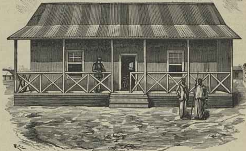
EDIFICIO DO CORREIO

JERONYMO (para a condessa). — Não se ria, snr. a condessa, que isto é mais serio do que cuida. (Para D. Fernando). Eu, senhor, son um bruto, mas também percebo as coisas... Eu bem sei que o snr. D. Fernando é um fidalgo e a minha Joanna uma pobre de Christo!... e que um sogro como eu havia de fazer vergonha aos seus parentes... E na verdade, o Jeronymo um labrego, que tem o maldito sestro de tomar as suas bebedeiras, ir á igreja a par com o snr. marquez, até era uma coisa que dava vontade de rir... Mas a Joanna essa é que até pôde entrar no Paço, que os tapetes das salas não lhe estranham os pés... E o snr. D. Fernando pôde ficar descansado que, se quizer casar com a minha filha, não me torna mais a pôr a vista em cima... Eu, com os diabos, nem já saio de Lisboa, atiro-me ao rio, e Deus me perdoe, que elle bem sabe que é por causa da Joanna... Ella ha-de ter saudades de mim, que tem muito bom coração, mas isto de filhos nunca nos tem o amor que nós lhes temos... e vai o snr. D. Fernando conta-lhe quatro lerias, e ella vai-se esquecendo... E eu, eu no outro mundo a abraçarei, que diz que no céu não ha fidalgos, nem povo... Ah! que eu não posso mais!... Snr. D. Fernando, se as humildes lagrimas de um pae alguma coisa podem, aqui me tem (cãe de joelhos) de mãos postas a pedir-lhe que não deixe minha filha deshonrada.