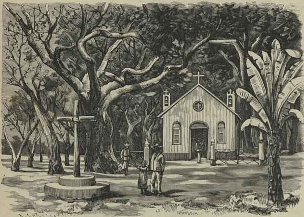
CAPELLA DE S. JOÃO BAPTISTA NA BEIRA