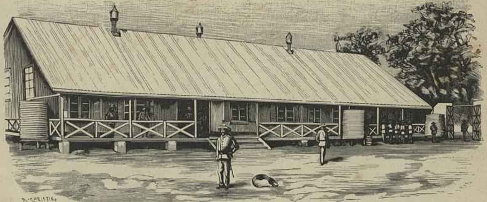
QUARTEL DA POLICIA, NA BEIRA

JERONYMO. — É verdade, sr. a condessa, por nossa desgraça!... Estas coisas cedo ou tarde sempre a gente vem a saber-as, e... e melhor era que as não soubesse nunca... Emfim!... O caso é que o nr. D. Fernando parece que me desinquietou a pequena, e vai depois veio para Lisboa, sem se lembrar da rapariga... Verdade é que o sr. D. Fernando não sabia (com um soluço a entrecortar-lhe a voz) que a Joanna ficára de esperanças... (com amargura) de esperanças!... Assim é que se costuma dizer... e que mais dia menos dia dá á luz um filho aqui do sr. D. Fernando!