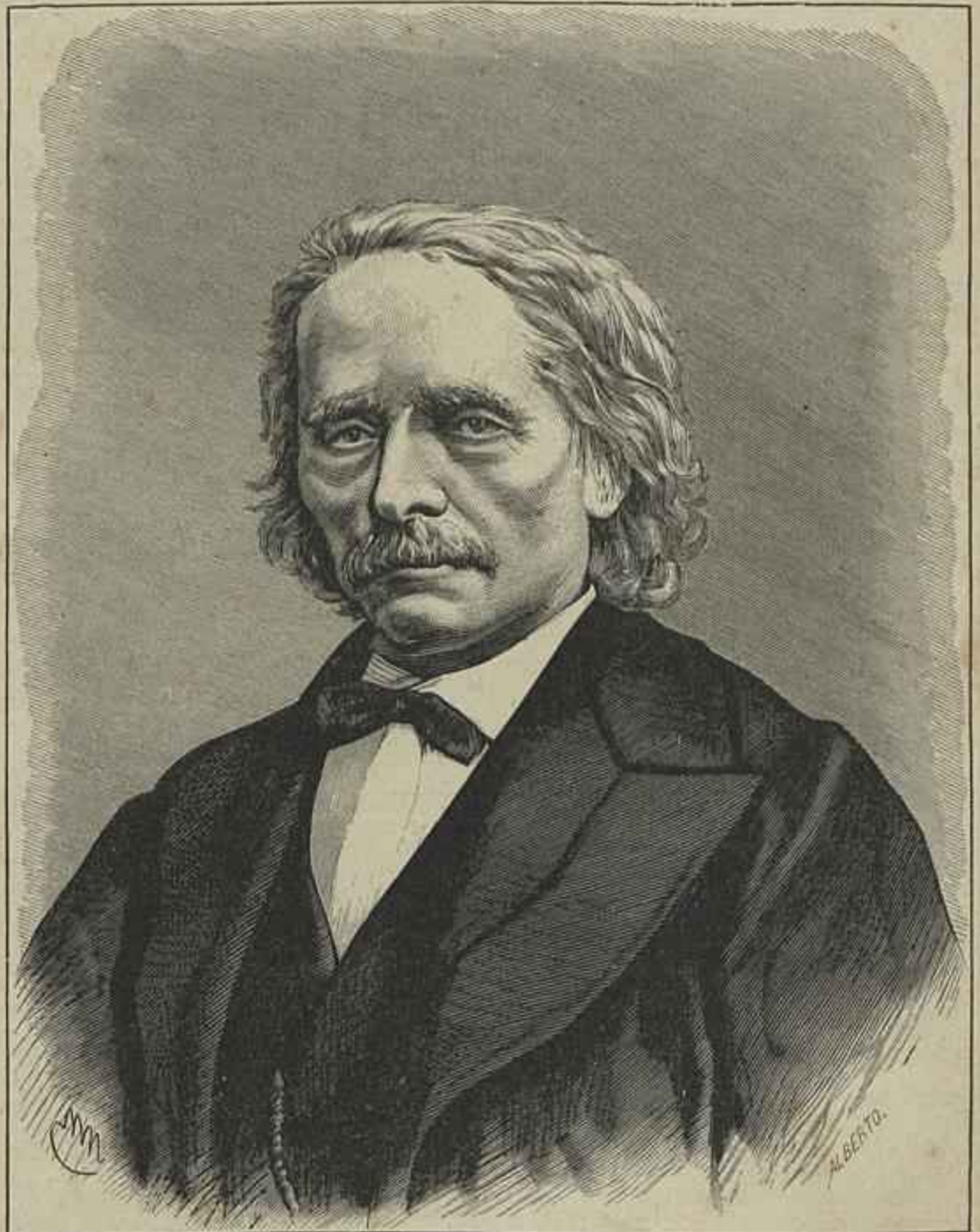
CESAR CANTÚ — FALLECIDO EM 11 DE MARÇO DE 1895