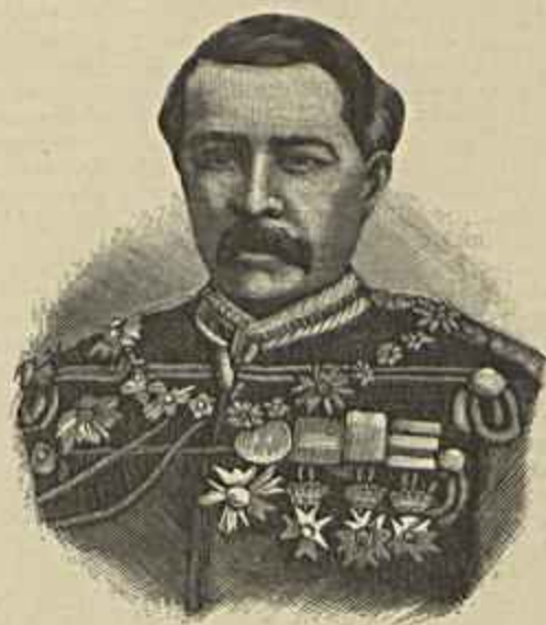
O PRIMEIRO MINISTRO RANILAIARIVONY