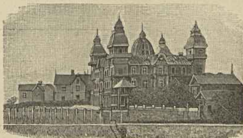
PALACIO DO PRIMEIRO MINISTRO DE MADAGASCAR