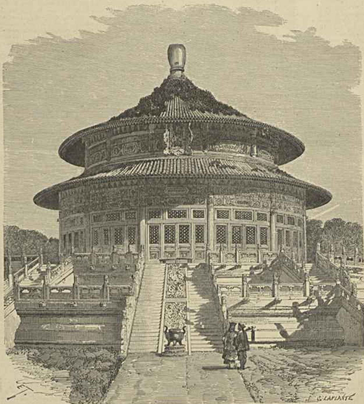
CHINA — O TEMPLO DA TERRA

Na manhã do dia dez de Outubro ia eu seguindo muito de meu vagar, pelo caminho que vae do Calhandriz para Alverca, — aldeia que fica um pouco áquem da Alhandra, quando, a curta dis-