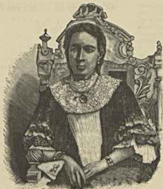
A RAINHA NAVALOMANJACA