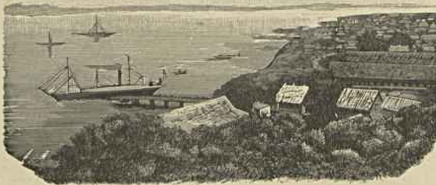
A BAHIA DE DIOGO SOARES

Nova Bibliotheca Economica. Intitula-se Estalagem Maldita o primeiro volume publicado por esta Bibliotheca.