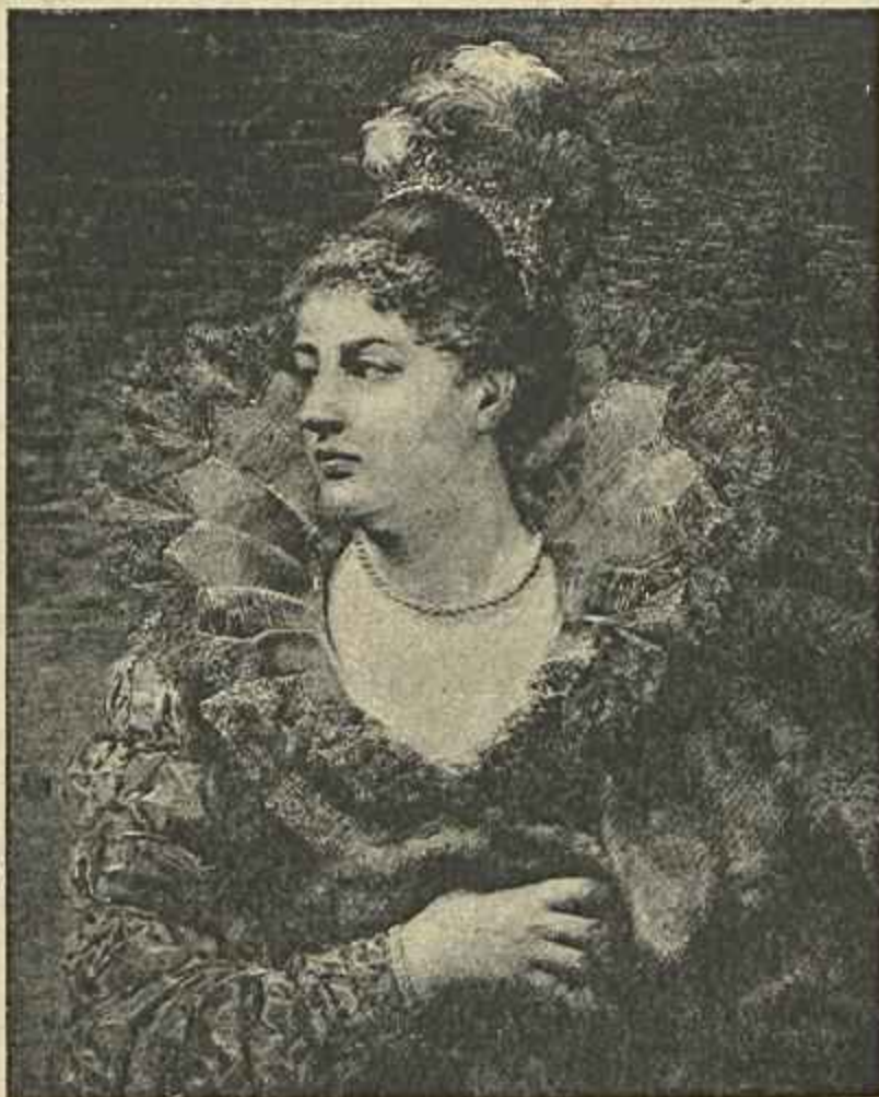
UMA DAMA DO SEculo XVI