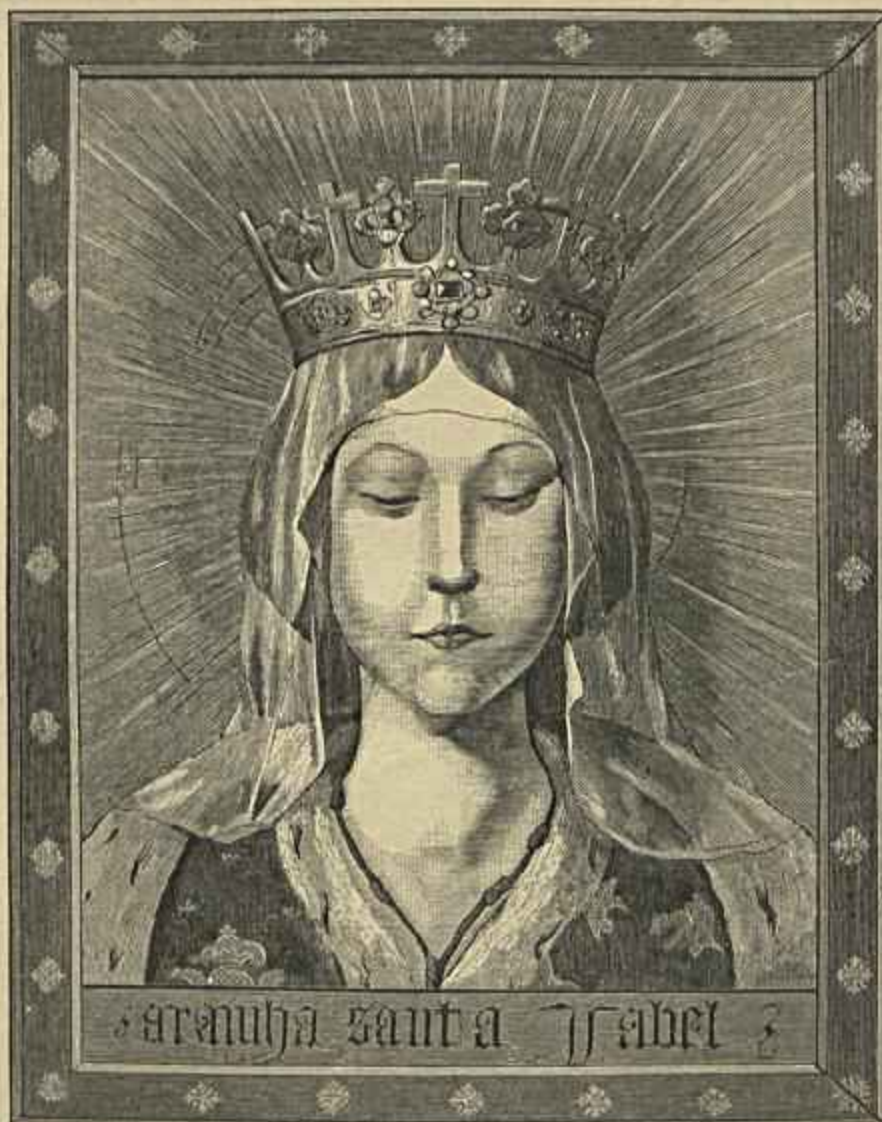
A RAINHA SANTA ISABEL — QUADRO EXISTENTE NO PAÇO D'AJUDA

O Sado já muito sufficientemente explorado pela pintura encontrou agora um outro artista a devassar-lhe as bellezas.