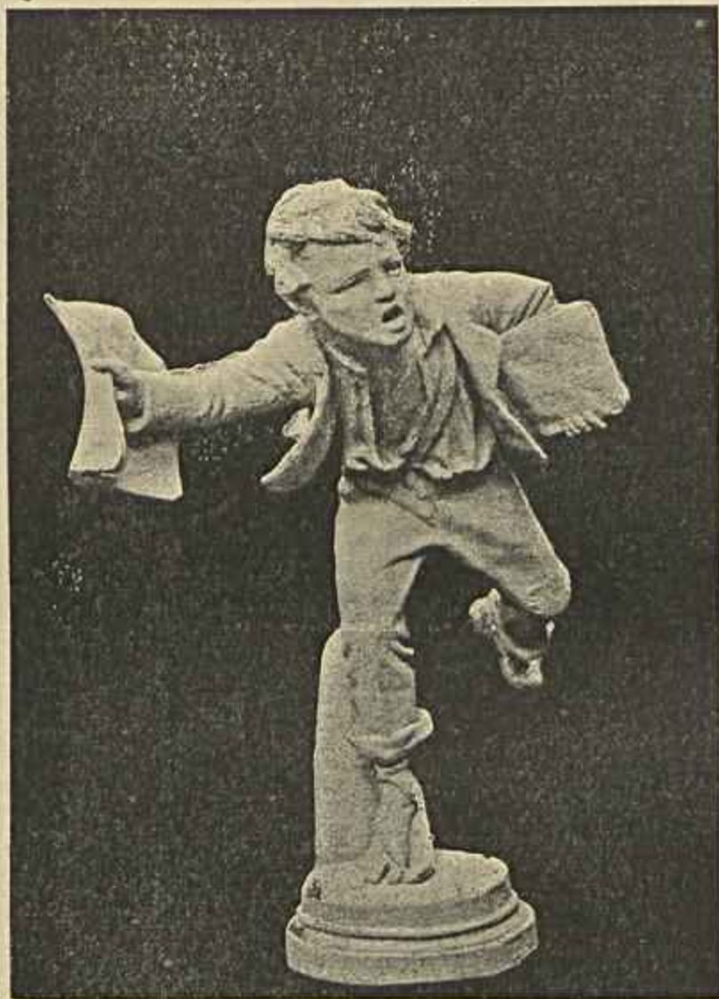
O VENDEDOR DE JORNAES — ESCULPTURA ITALIANA