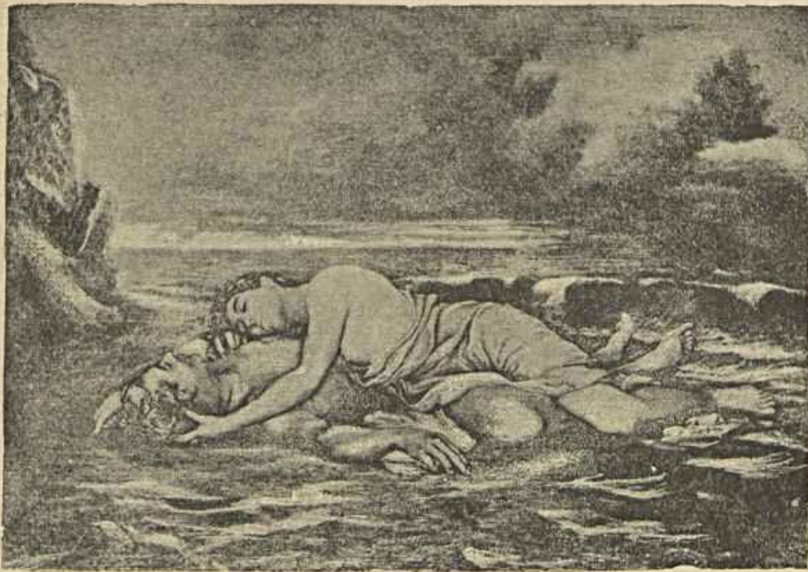
HERO E LEANDRO — QUADRO DE ADOLPHO RODRIGUES, PHOTO-GRAVURA DO SR. JOSÉ PIRES MARINHO (Cópia de uma photographia do sr. Camacho)

ter muita saúde, pois está sendo assada em vida, ao lume da fornalha que lhe serve de almofada. Da composição e perspectiva do quadro não fallemos para não insistirmos em coisas tristes. Por esta mesma razão não fallaremos do quadro — Adormecido , — em que ficamos admirados do prodigioso equilibrio que o rapazito faz para não cair d'aquelle plano inclinado em que o pintor o pôz com o banco em que se senta e a meza a que se encosta.