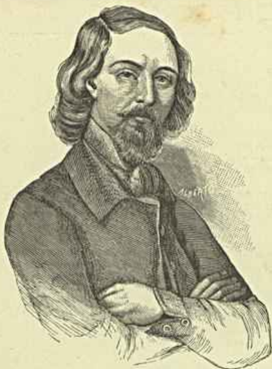
D. JOSE ZORRILLA

Estas grandes solemnidades pontificias são de um esplendor incomparavel e só pôde fazer ideia de toda a sua grandeza, quem tem a fortuna de as ellas assistir.