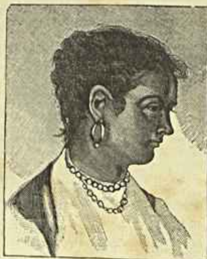
CABEÇA DE ESTUDO (Marques de Oliveira)

De muito menor valor o «Tear», interessante pelo episodio, mas falto de vida e de cor. Tudo aquillo, além de monotono, está acanhado. A figura mais interessante é a da rapariga sentada ao tear, a qual tem um bom movimento e certa expressão.