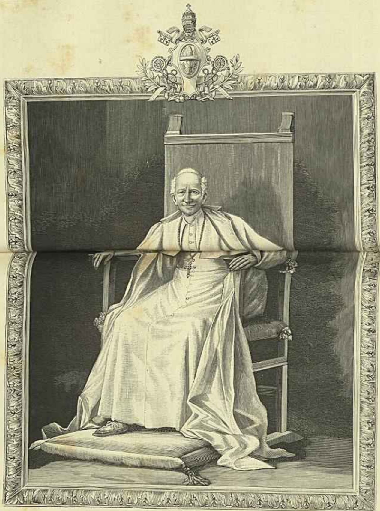
SUA SANTIDADE O PAPA LEÃO XIII