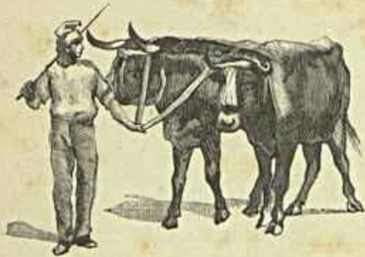
VOLTA DO TRABALHO (Silva Porto)

gada, dão a esta tela um encanto sem igual. E' enfim uma verdadeira obra de mestre.