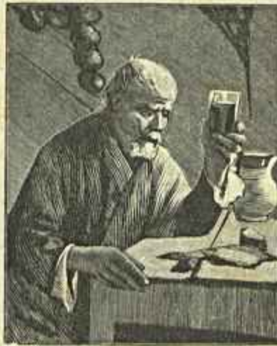
VINHO NOVO EM CASCO VELHO (Almeida e Silva)

«Elegia Pantheista», tem qualidades de perspectiva e de côr local apreciabilissimas. As figuras do sacerdote e do rapazinho, caminham bem ao longo da extensa campina, mas o genero de pintura é mau e faz elle sobretudo perder todo o calor ao quadro. Nunca sympathisamos com aquella maneira de pintar, que é muito peculiar a um artista d'esta cidade.