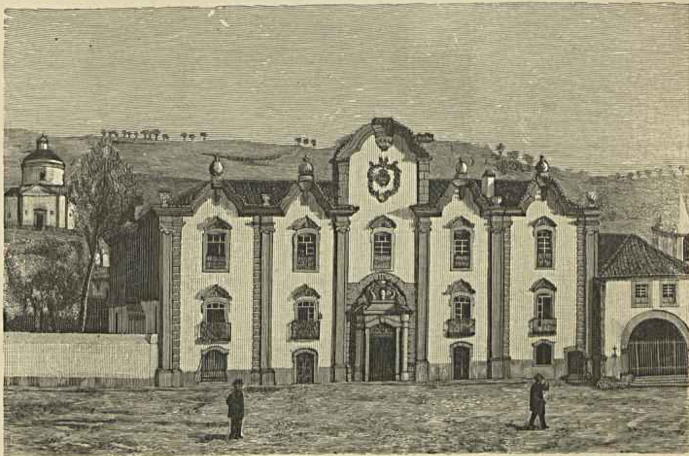
HOSPITAL DE PORTALEGRE

Corre a Paris onde é muito bem recebido, e a primeira missáo que elle pede é ser mandado á Italia para vigiar o que se passa na ilha d'Elba. Era o costume. Já não podia conspirar em França, ia conspirar para a Italia. Effectivamente percebeu que Napoleáo não estava tranquillo, e voltou para França a acautellar o rei. Mas Napoleáo continuava a ter aquella celeridade de resoluções e de movimentos que foi o elemento essencial do seu