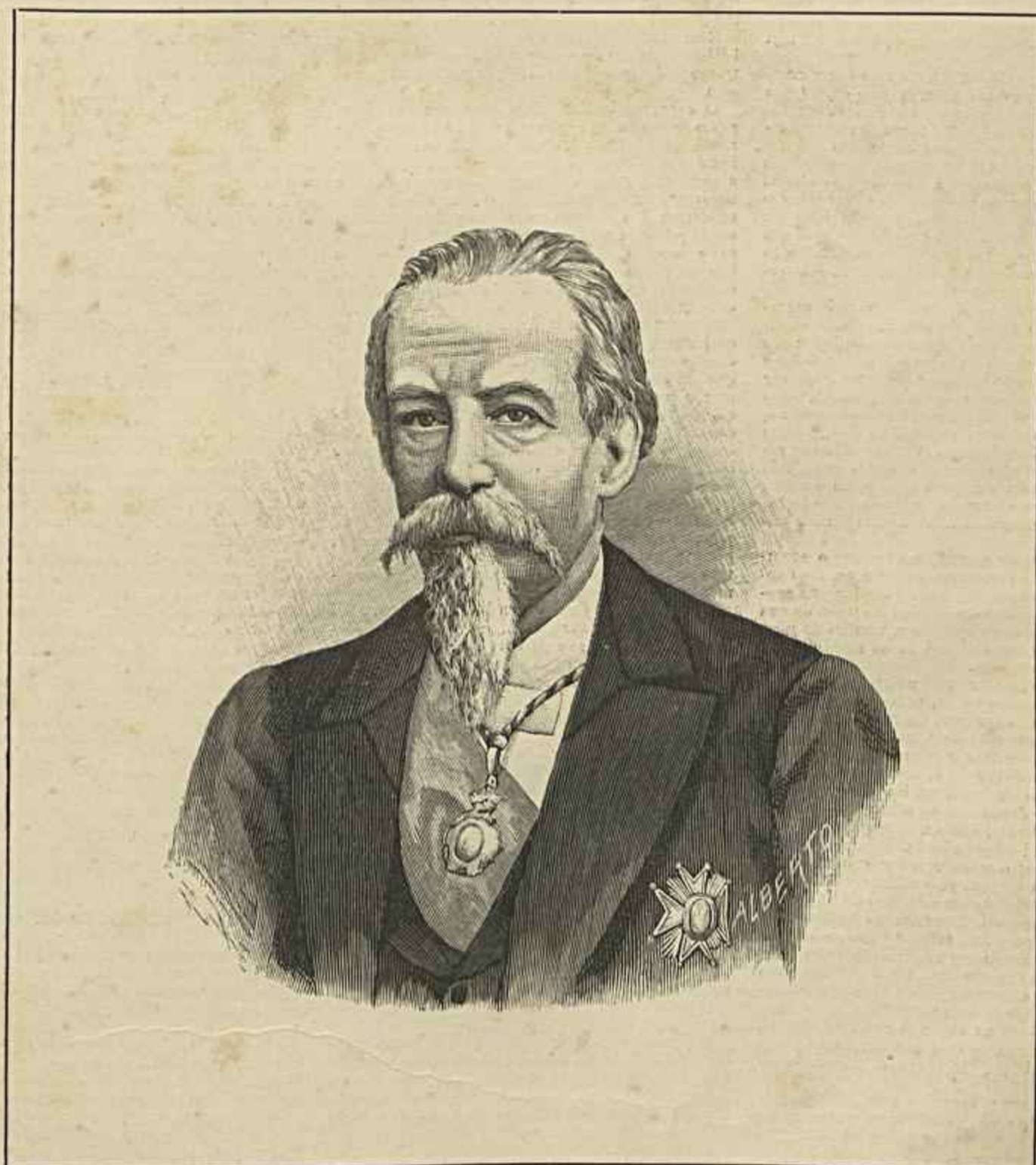
D. JOSÉ ZORRILLA