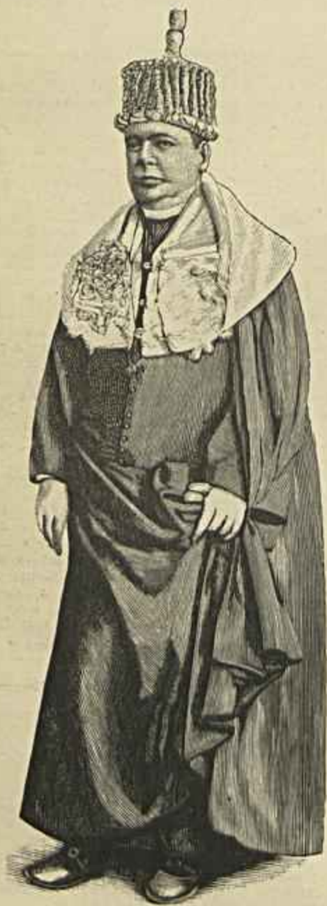
UM DOUTOR DE CAPELO