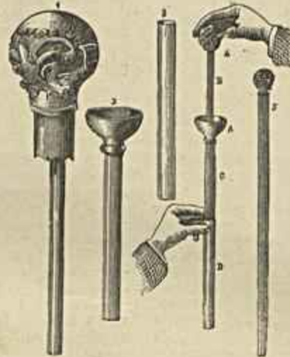
BENGALA-MACHINA DE FAZER CIGARROS

da manifestação monarchica com que foram recebidos el-rei D. Carlos e a rainha D. Amelia no seu regresso a Lisboa.