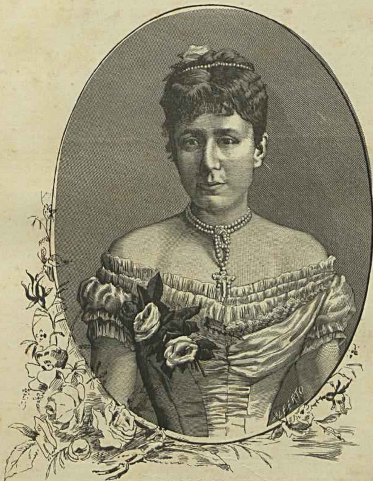
SUA Magestade a Rainha Regente de Hespanha D. Maria Christina (Segundo photographia)