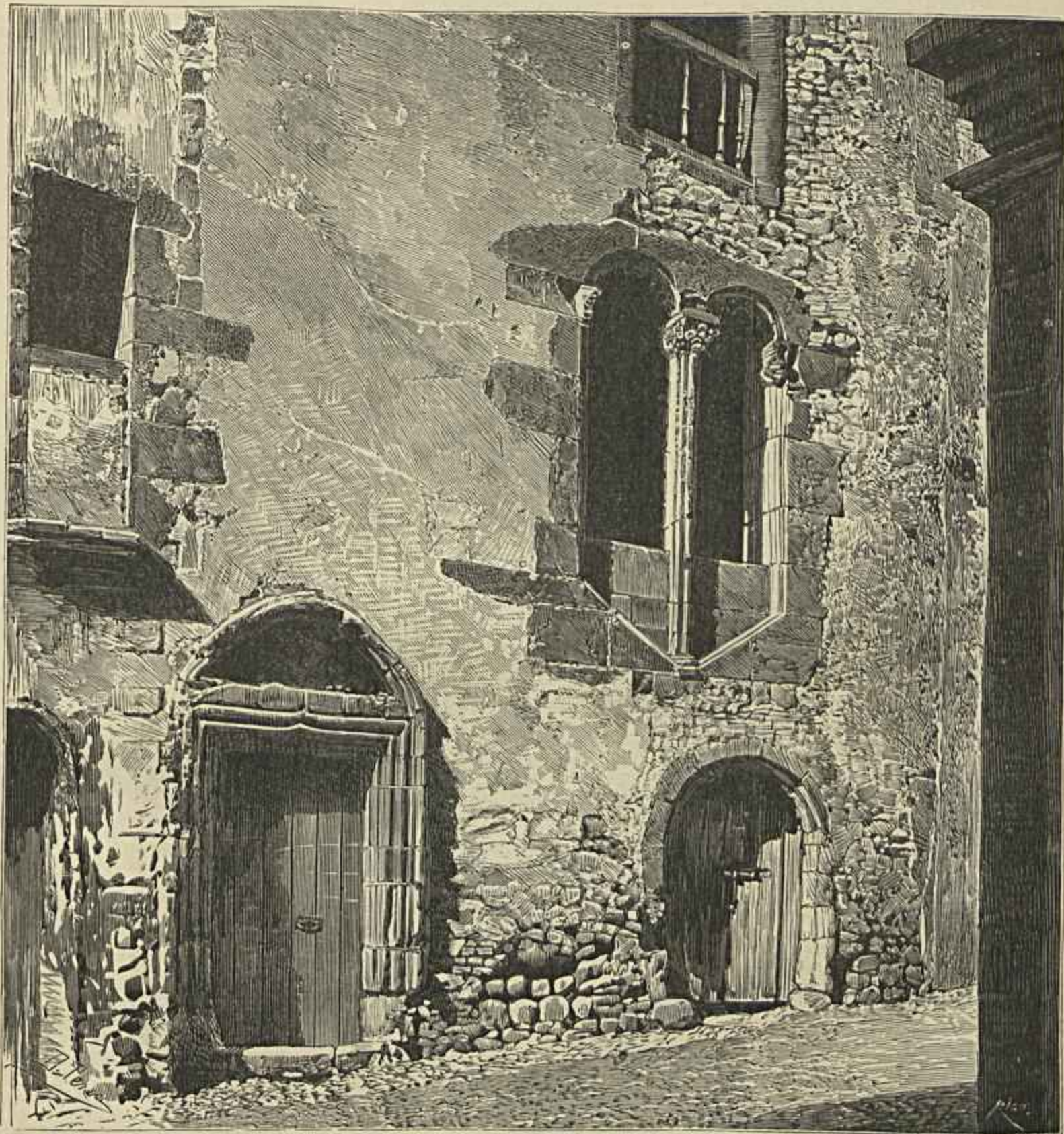
CASA ONDE, SEGUNDO A TRADIÇÃO, HABITOU CHRISTOVÃO COLOMBO — No FUNCHAL