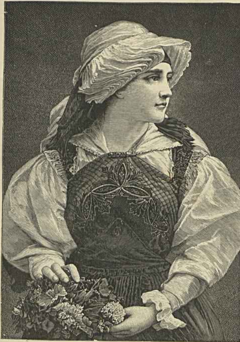
COSTUMES DA BULGARIA — UMA ALDKÁ

A segunda parte d'este relatorio insere documentos relativos a interferencia da Associação em varias questões de interesse para o commercio, junto dos poderes publicos, etc.; concluindo com a relação dos socios effectivos em numero de 630, e com uma estatistica do movimento commercial do Porto, em 1891, e sua comparação com o movimento dos annos anteriores.