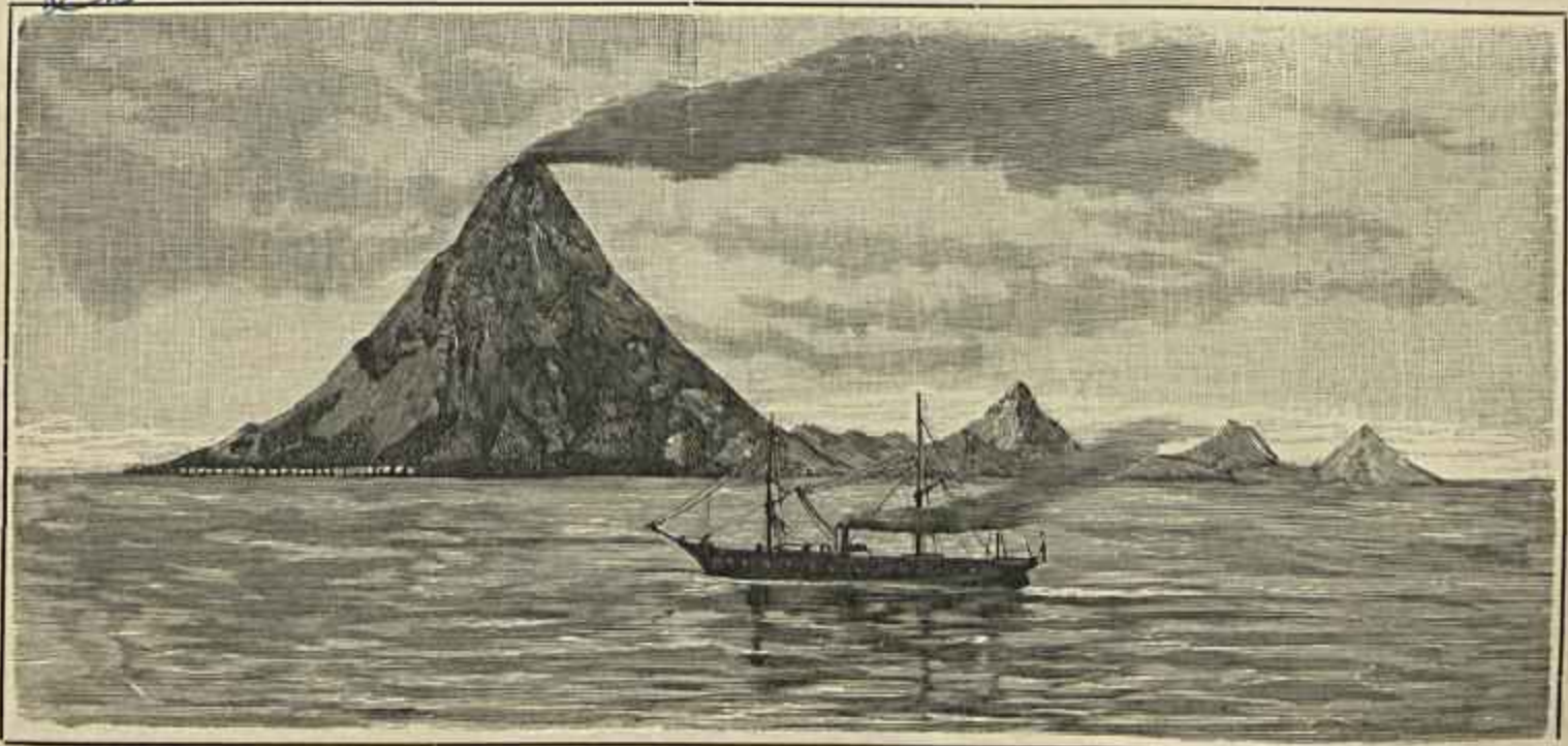
O VULCÃO GUNONA AVÚ NA PARTE NOROESTE DA ILHA ANTES DE AFUNDAR-SE NO OCEANO