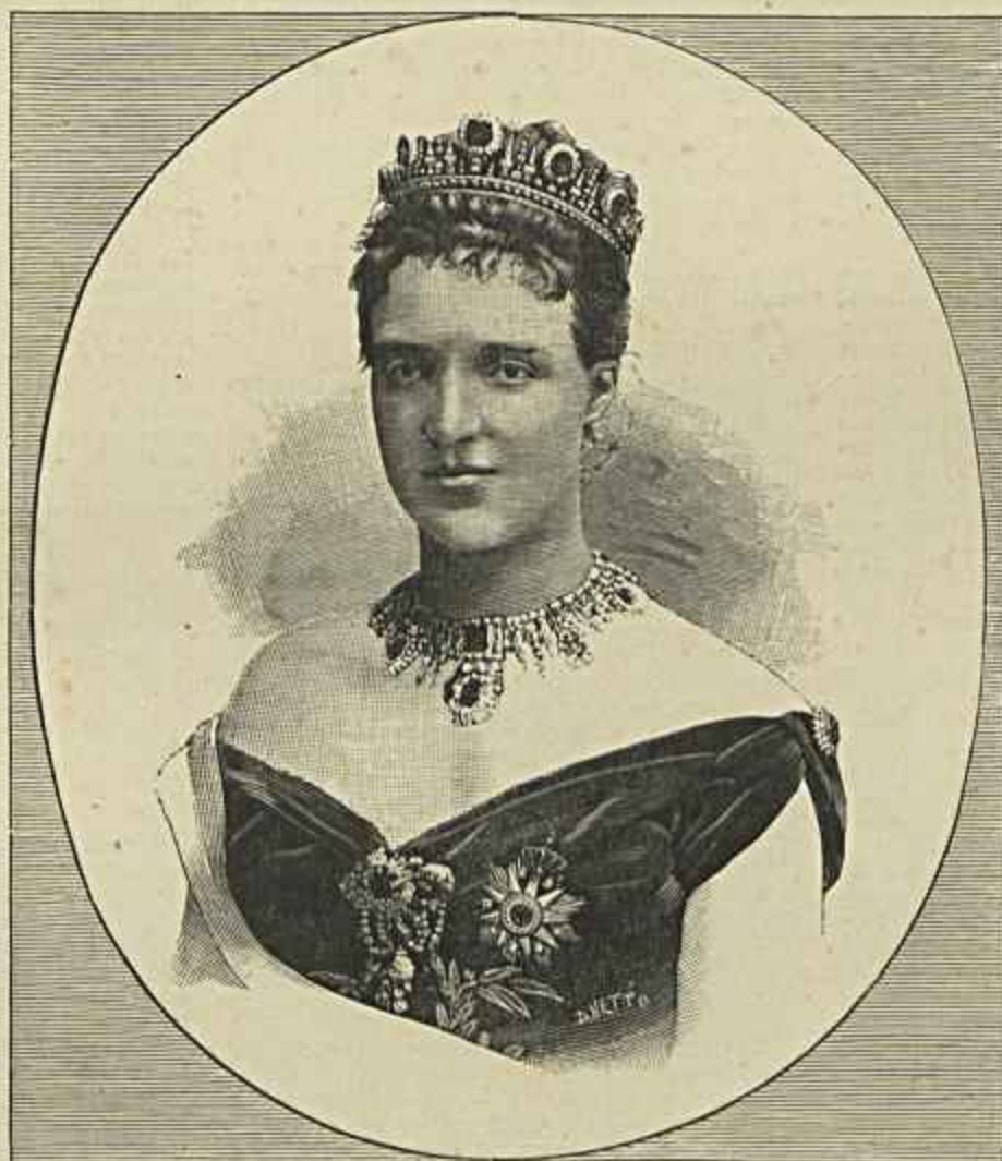
SUA Magestade a Rainha Senhora D. Maria Amelia