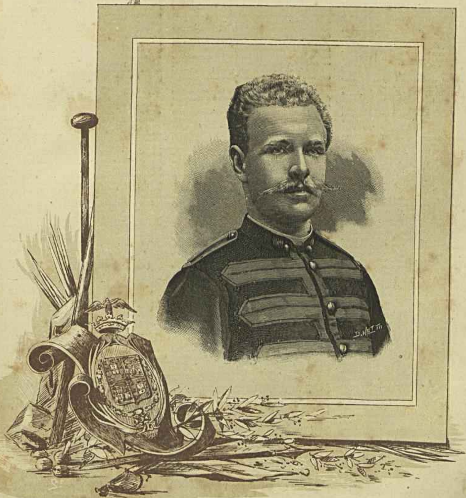
S. A. O SENHOR INFANTE D. AFFONSO, DUQUE DO PORTO PRINCIPAL PROMOTOR DO TORNEIO NO HYPODROMO DE BELEM — Vid. Chronica Occidental