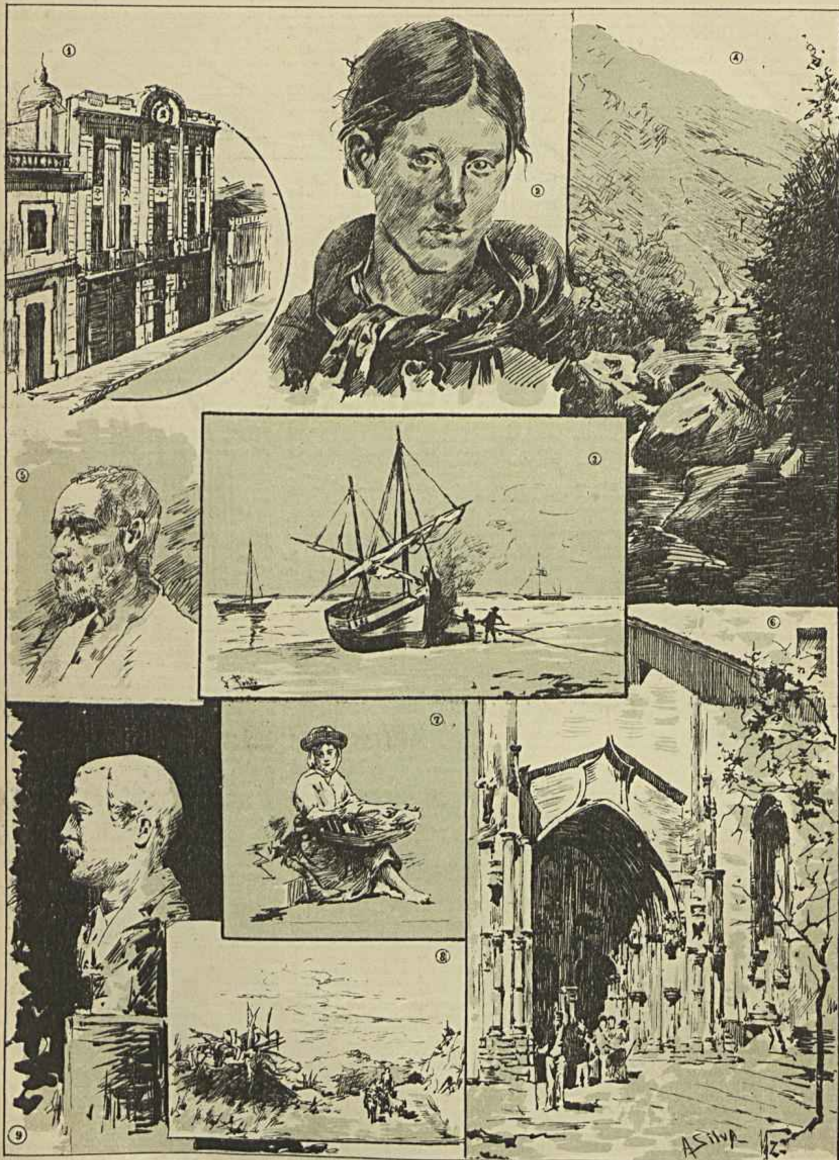
1 Atheneu Commercial. — 2 Cabeça de Estudo de Marques de Oliveira. — 3 Na beira mar, quadro de Silva Porto. — 4 Poço das Pallas, (Gereç), quadro de de A. J. Costa. — 5 Cabeça de Velho, de A. Baeta. — 6 Um portico manuelino, quadro de J. Vaz. 7 Varina, quadro de Adolpho Rodrigues. — 8 Asinhaga do Arieiro, quadro de Ezequiel Pereira. — 9 Busto do Ex. mo L. J. R., escultura por C. F. Leituga. (Desenhos de A. Silva)