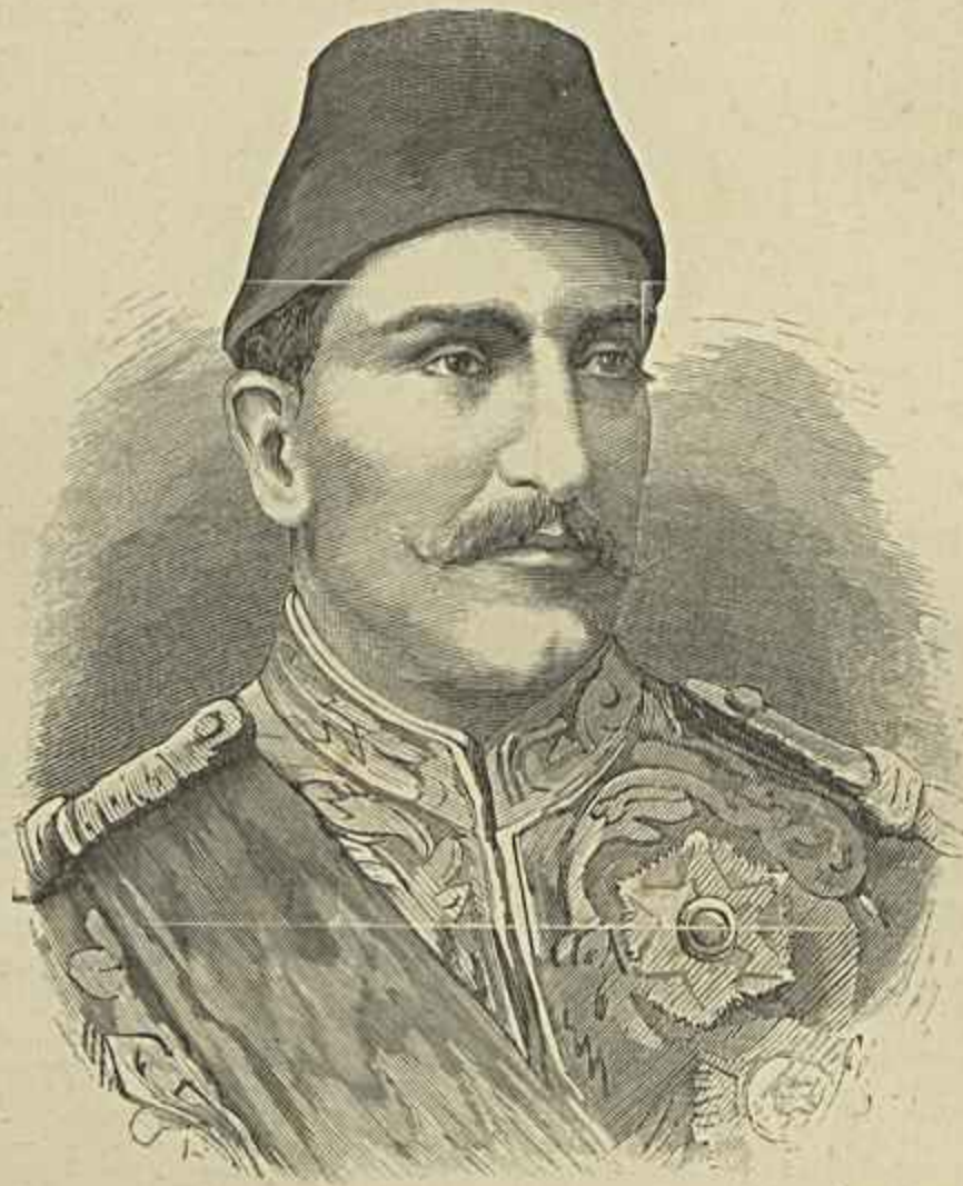
O KHEDIVA THEWFIK I — FALLECIDO EM 7 DE JANEIRO DE 1894