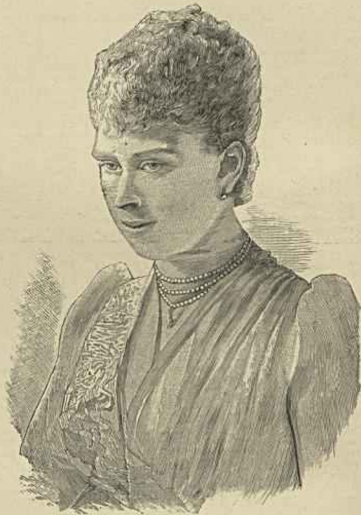
A PRINCEZA MARIA DE TEK — NOIVA DO PRINCIPE ALBERTO VICTOR

fazer idéa do seu peso, direi, que quando o fui buscar a Guimarães, para a exposição d'arte ornamental, que se realizou em Lisboa em 1881, eram precisos 8 homens, ou 6 auxilio possantes, para o transportarem para as carroças, etc.