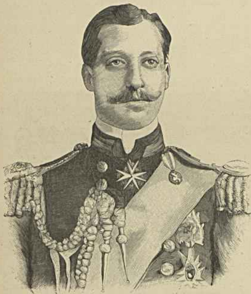
O PRINCIPE ALBERTO VICTOR — FALLECIDO EM 14 DE JANEIRO DE 1892