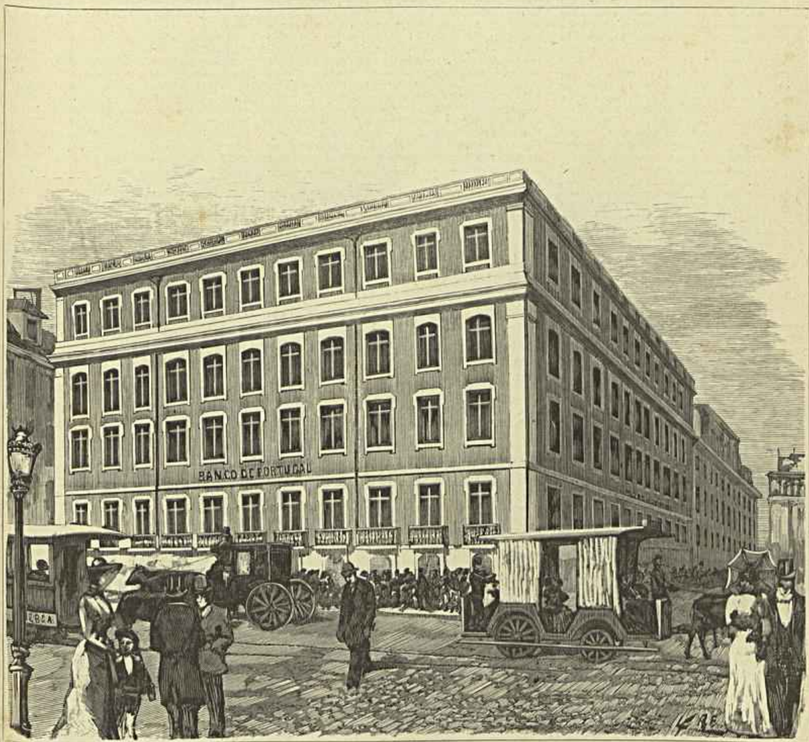
EDIFICIO DO BANCO DE PORTUGAL, EM LISBOA