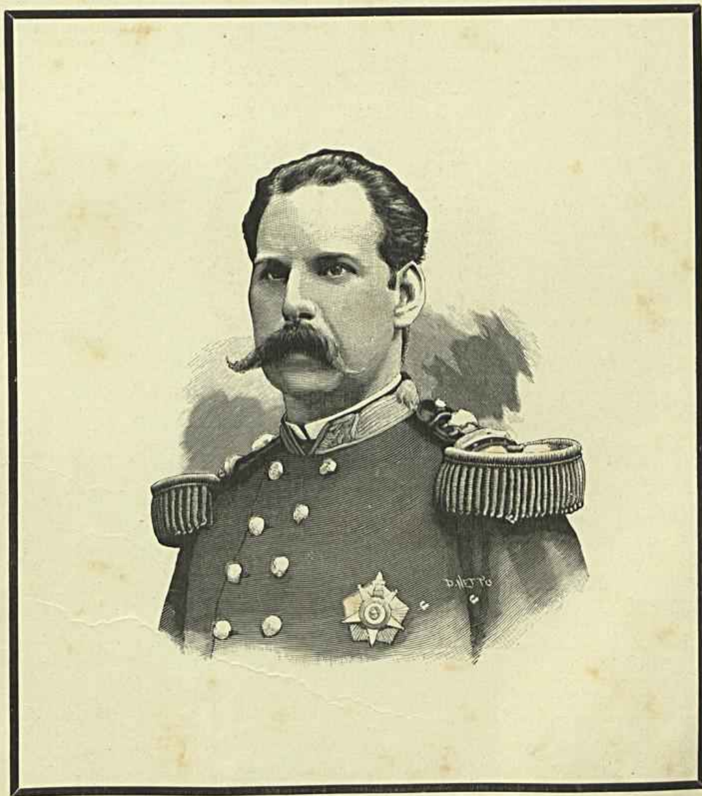
SUA ALTEZA O SENHOR INFANTE D. AUGUSTO, DUQUE DE COIMBRA E DE SAXE — FALLECIDO EM 26 DE SETEMBRO DE 1889