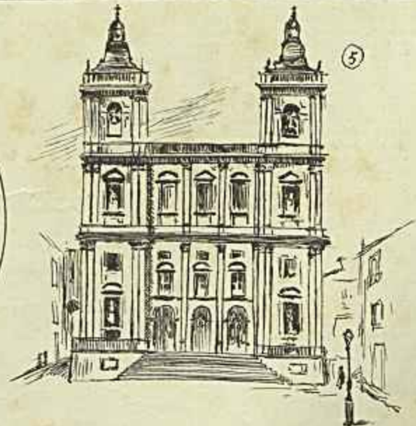
1. Exposição do feretro na Capella das Necessidades. — 2. Passagem do cortejo fúnebre na Praça do Commercio. — 3. Capella e palacio das Necessidades, onde Sua Alteza nasceu e falleceu — 4. Um Porteiro da Canna. — 5. A Igreja de S. Vicente, Pantheon Real