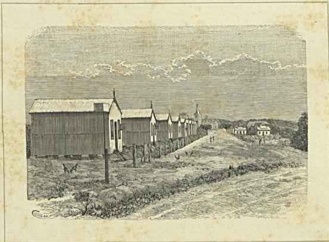
LOURENÇO MARQUES — AVENIDA DE EL-REI D. MANUEL

Junta do Credito Publico. Administração das Caixas Geral de depositos e Economica Portuguesa. Relatorio, balanço em 30 de junho de 1888, e Conta do Exercicio de 1886-1887. Lisboa. Este relatorio muito desenvolvido com mappas do movimento d'estes estabelecimentos de credito, accusa um saldo de lucros liquidos no anno economico de 1887-1888 na importancia de 794.825$205 réis.