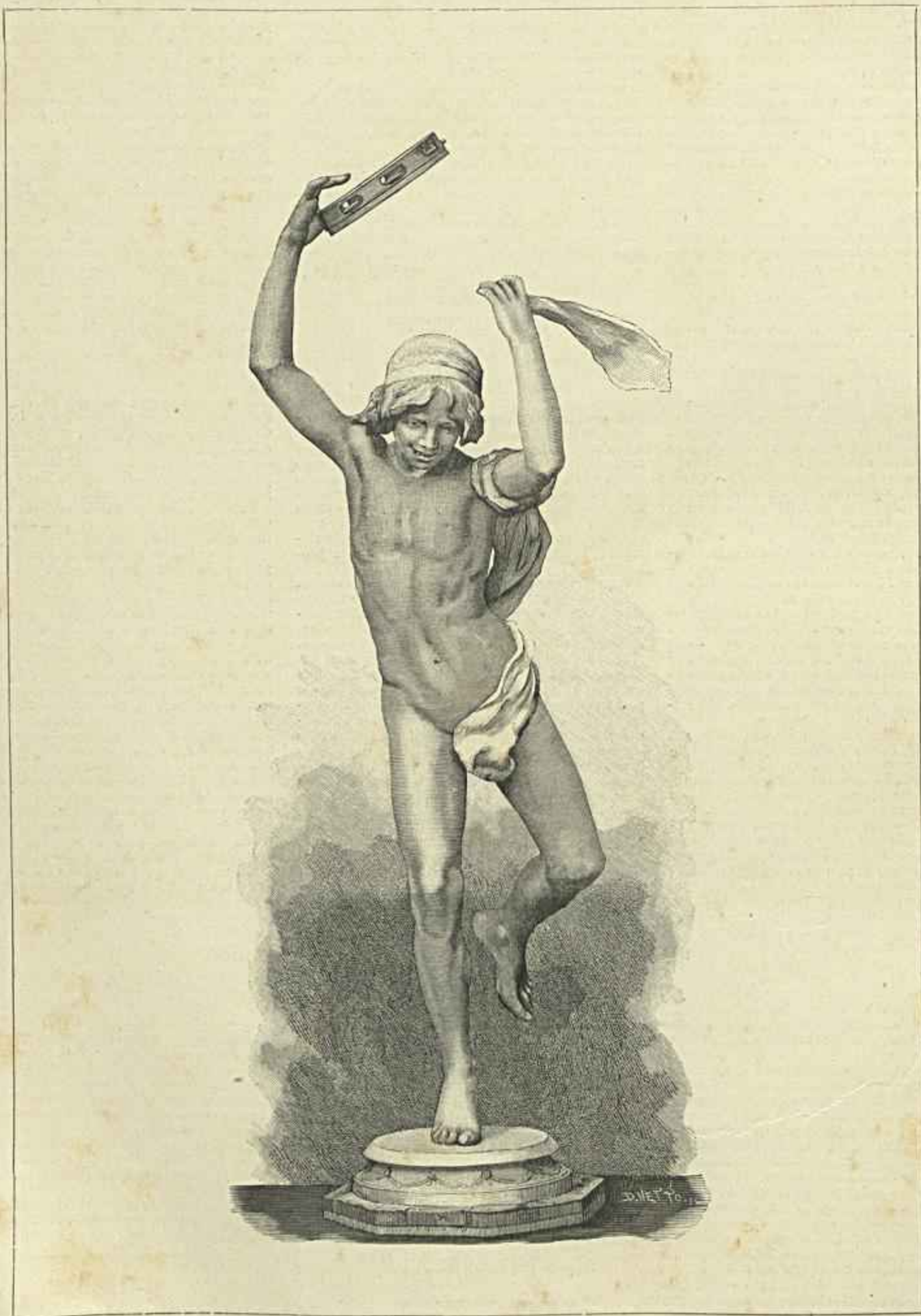
O «DANSEUR AU TAMBOURIN»

ESTATUA EM BRONZE DE THOMAZ COSTA, ADQUIRIDA PELO ESTADO PARA O MUSEU DE BELLAS ARTES