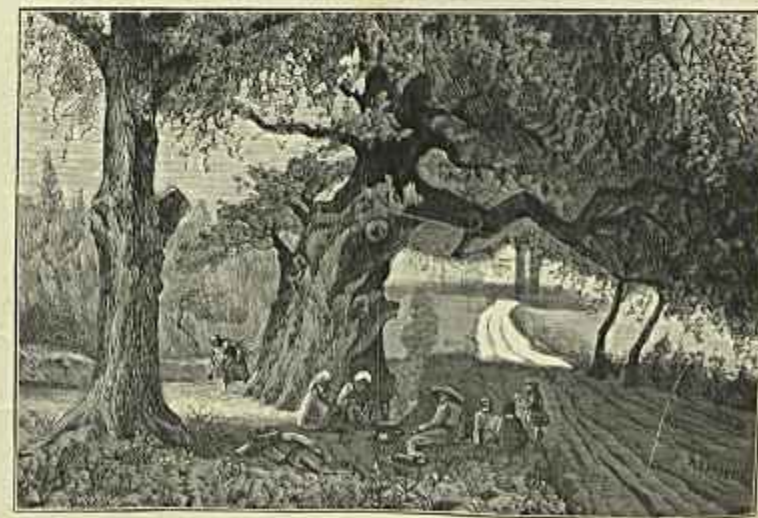
MATTA DA CORUJEIRA QUADRO DE CRISTINO DA SILVA (Desenho do mesmo auctor)