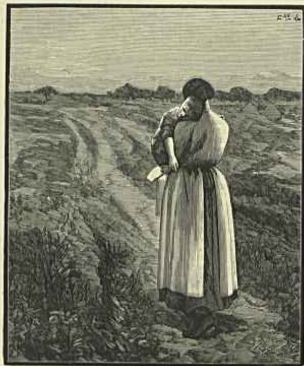
O DOENTINHO ( Salon de 1887 ) QUADRO DE SOUSA PINTO