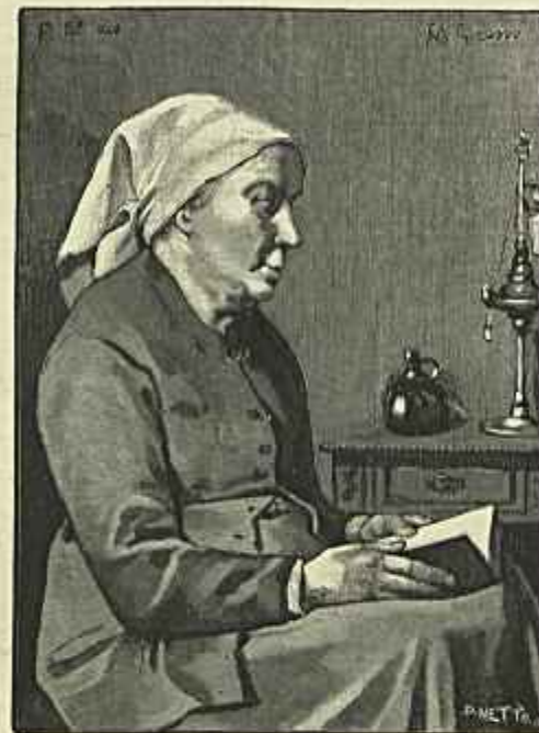
ANTES DO TRABALHO QUADRO DE GRECO