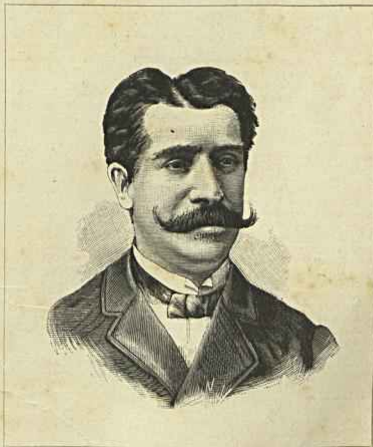
FREDERICO RESSANO GARCIA

MINISTRO DAS OBRAS PUBLICAS (Segundo uma photographia)