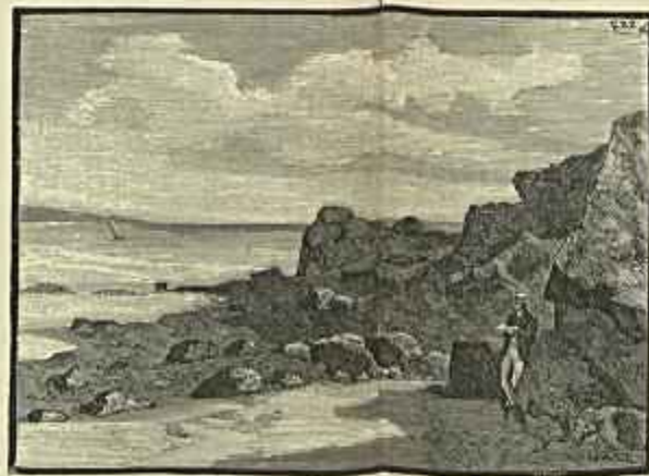
A PRAIA DO INGLEZ MORTO, PAÇO D'ARCOS QUADRO DE CONDEIXA (Desenho de L. Freire) — Vid. artigo Oitavo Salão