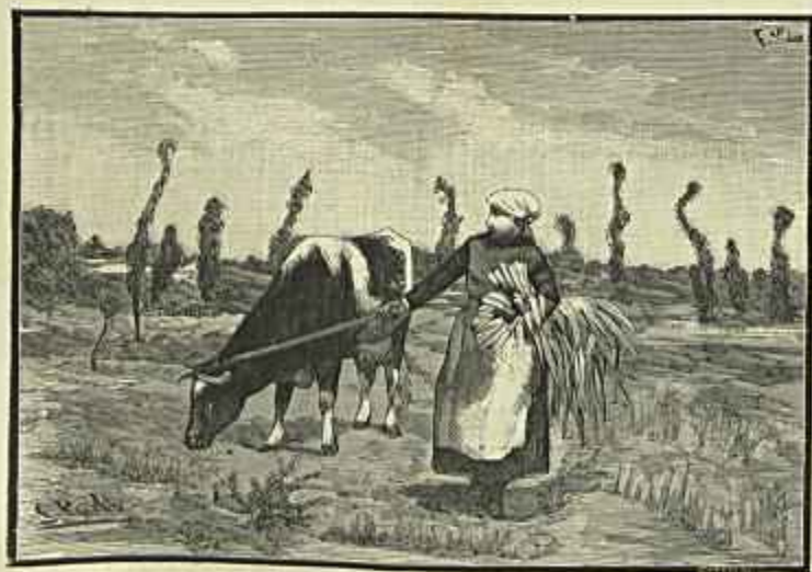
VOLTA PARA A ARRIBANA, ARRABALDES DE LISBOA QUADRO DE SILVA PORTO