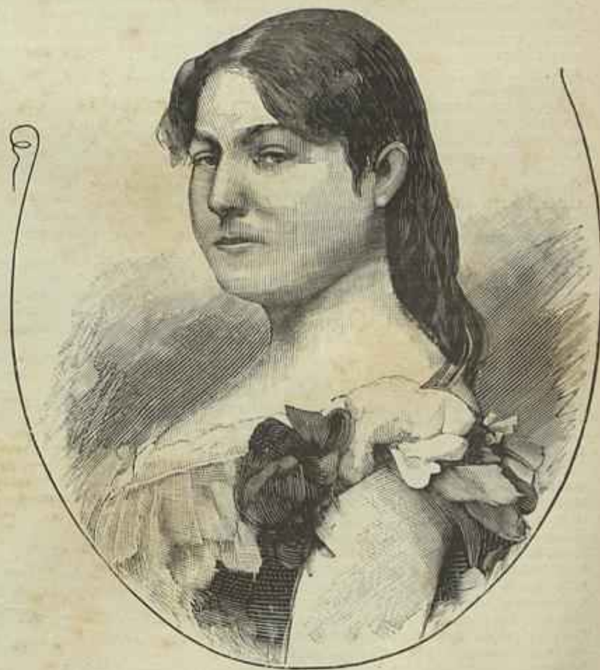
A RAINHA NATHALIA