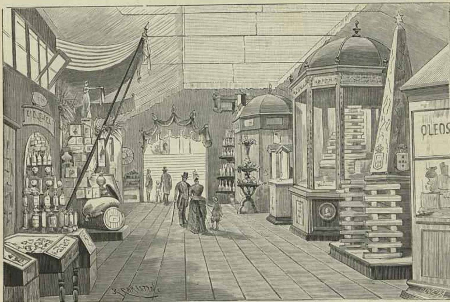
A GALERIA FARIA GUIMARAES (Desenho de J. R. Christino)

assim, dando noticia segura d'esta revista do trabalho e da arte, conseguir que ella fique perpetuando, em todos, a sua alta significação.