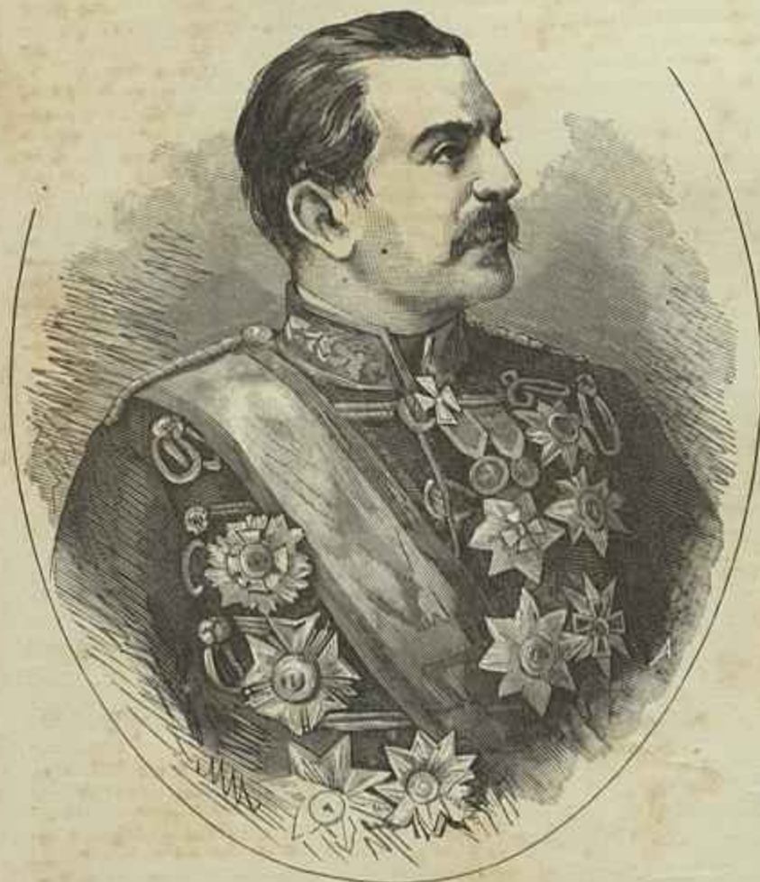
O REI MILAN DA SERVIA

E dei-lh'a, mas depois d'elles já sabem tudo pelos outros jornaes; porque só lh'a dei quando voltei a Lisboa. De lá nem uma linha sequer.