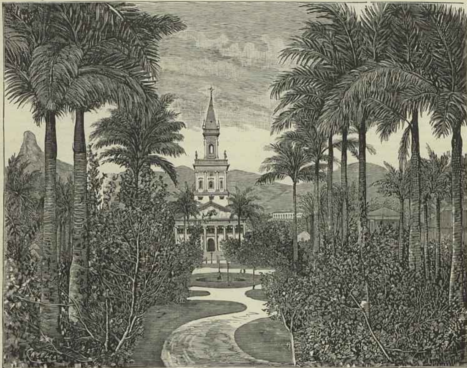
BRAZIL—EGREJA DA GLORIA NO RIO DE JANEIRO (Segundo uma photographia)

A exposição nacional tem geralmente agradado aos portuguezes e surprehendido muito os estrangeiros que, segundo parece, nos não supunham capazes de tanto. E comtudo, o Portu-