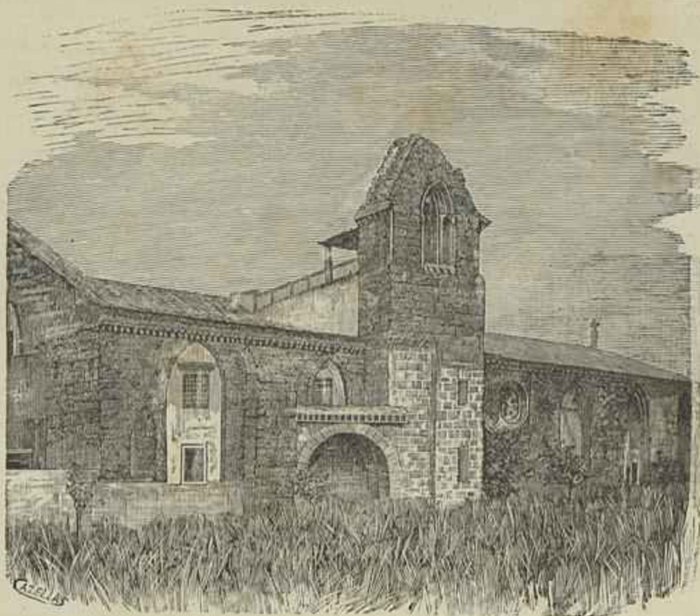
RUINAS DO ANTIGO MOSTEIRO DE SANTA CLARA, EM COIMBRA