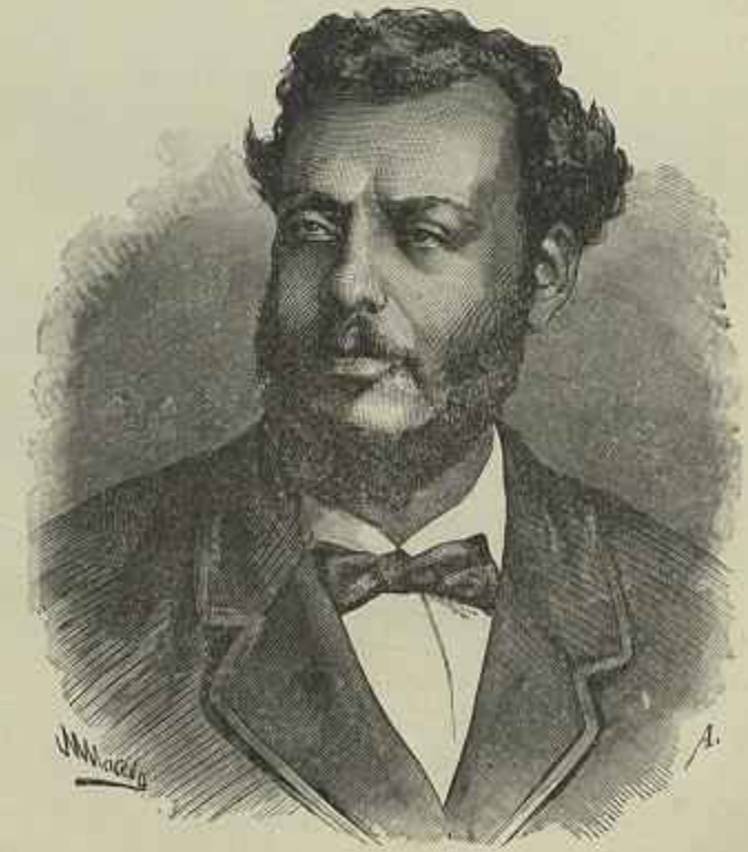
JOSÉ DO PATROCÍNIO