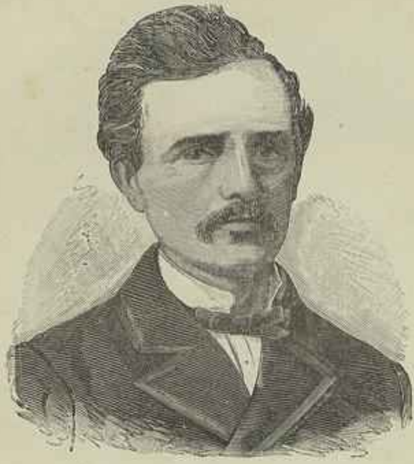
O CONSELHEIRO JOÃO ALFREDO PRESIDENTE DO MINISTÉRIO BRASILEIRO