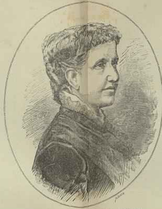
SUA ALTEZA A PRINCEZA IMPERIAL D. IZABEL REGENTE DO BRASIL