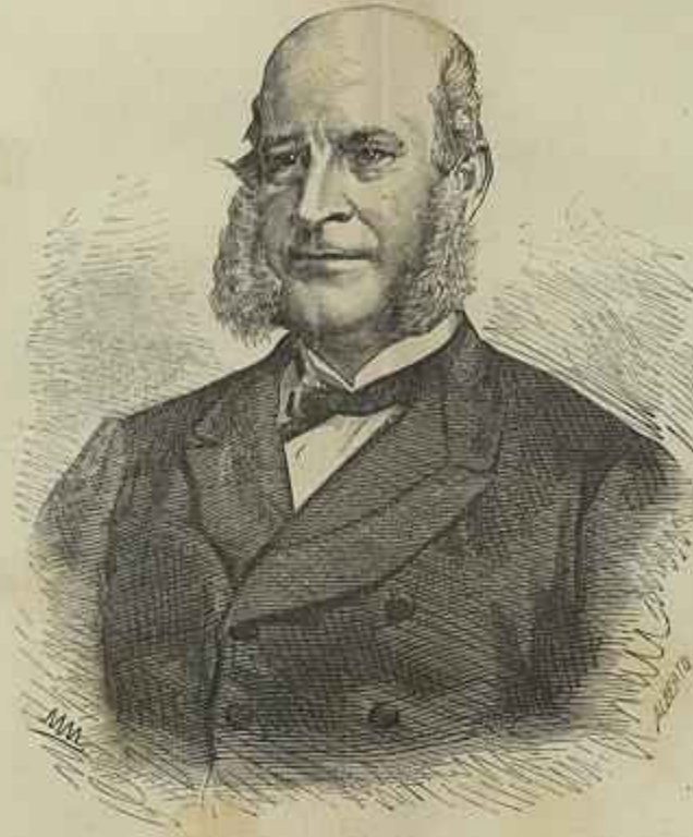
VISCONDE DO RIO BRANCO