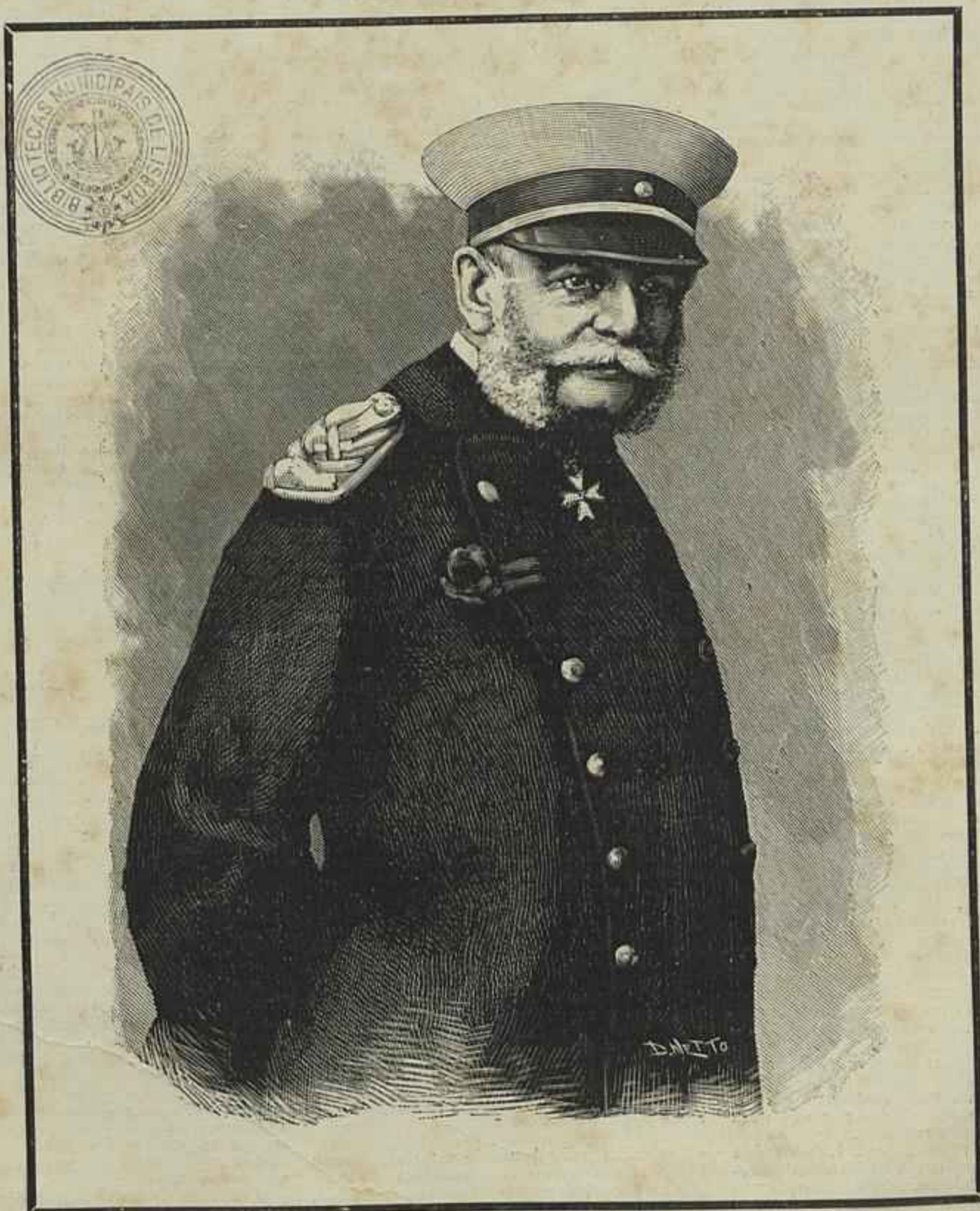
SUA MAGESTADE O IMPERADOR GUILHERME I DA ALLEMANHA FALLECIDO EM BERLIM NO DIA 8 DO CORRENTE