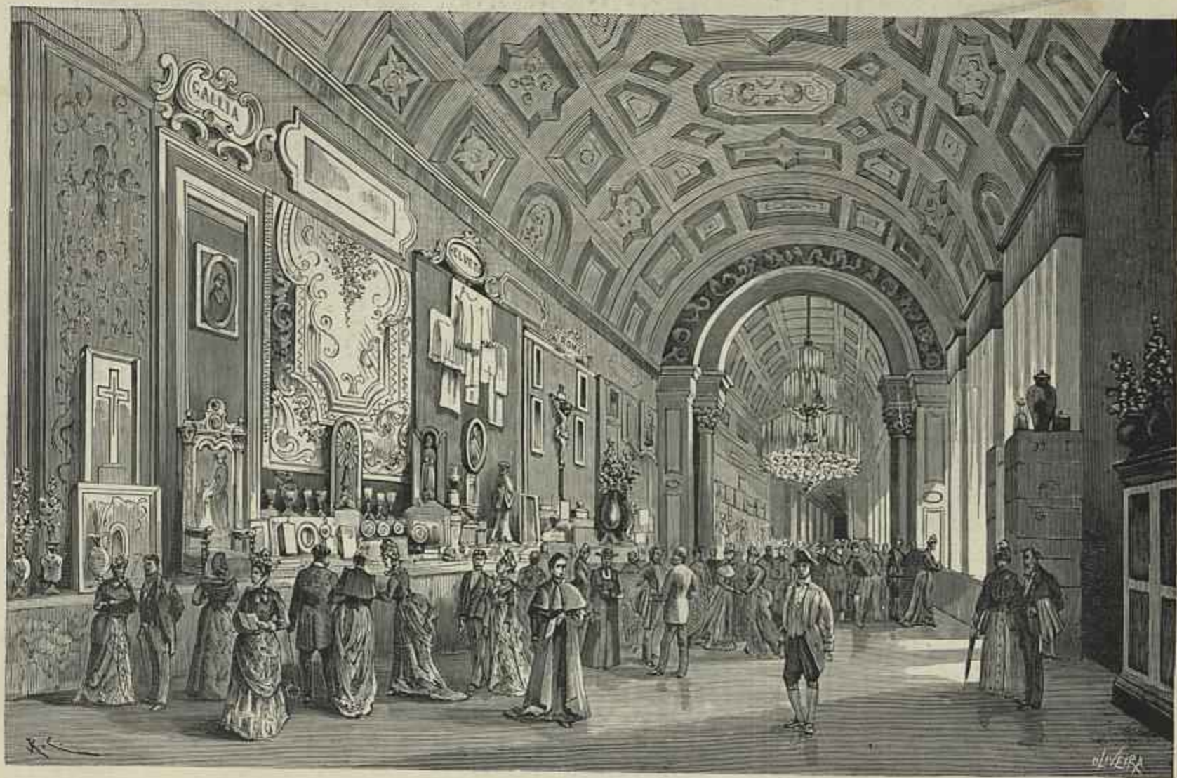
EXPOSIÇÃO NO VATICANO DAS OFFERTAS FEITAS A SUA SANTIDADE LEÃO XIII