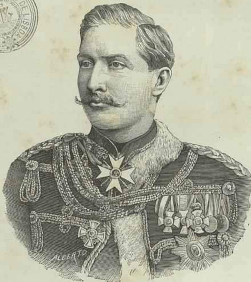
SUA ALTEZA O PRINCIPE FREDERICO GUILHERME VICTOR ALBERTO DA ALLEMANHA