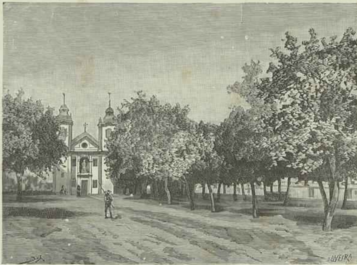
CAPELLA DE NOSSA SENHORA DA PENHA DE FRANÇA, NA VISTA ALEGRE.

Vid. artigo «Fabrica de Porcelana da Vista Alegre»