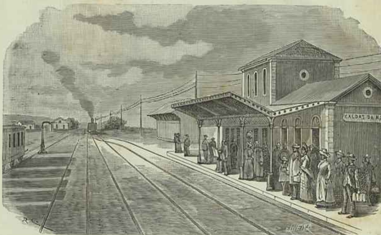
CAMINHO DE FERRO DE TORRES VEDRAS—ESTAÇÃO DAS CALDAS DA RAINHA

(Desenho do natural por J. R. Christiano)