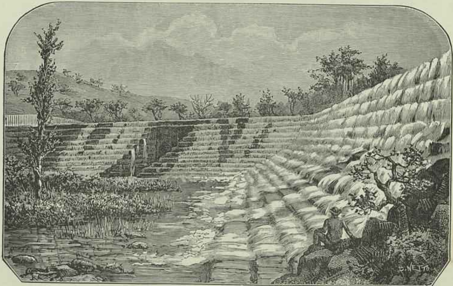
O AÇUDE DA FABRICA DE FIAÇÃO, DE THOMAR, NO RIO NABÃO

«Se me perguntassem a mim qual o romance que prefiro, de tantos que a litteratura portugueza lhe deve, eu lembrar-me-hia immediatamente d'aquelle delicioso Amor de perdição , perola iriada, perola delicada e transparente, que é um achado raro até na vida intellectual de um cerebro como o seu; lembrar-me-hia das encantadoras Novellas do Minho , nas quaes o drama mais completo encontrou a forma mais simples e mais genial, e a paizagem do norte a sua cor mais propria, a sua expressão mais viva, o desenho mais potente; mas responderia logo, sem hesitar: — Não prefiro nenhum dos romances em particular; amo-os a todos, porque são o reflexo da alma portugueza em alguns dos seus aspectos especiaes mais verdadeiros e mais nativos, porque são o repositório riquissimo de