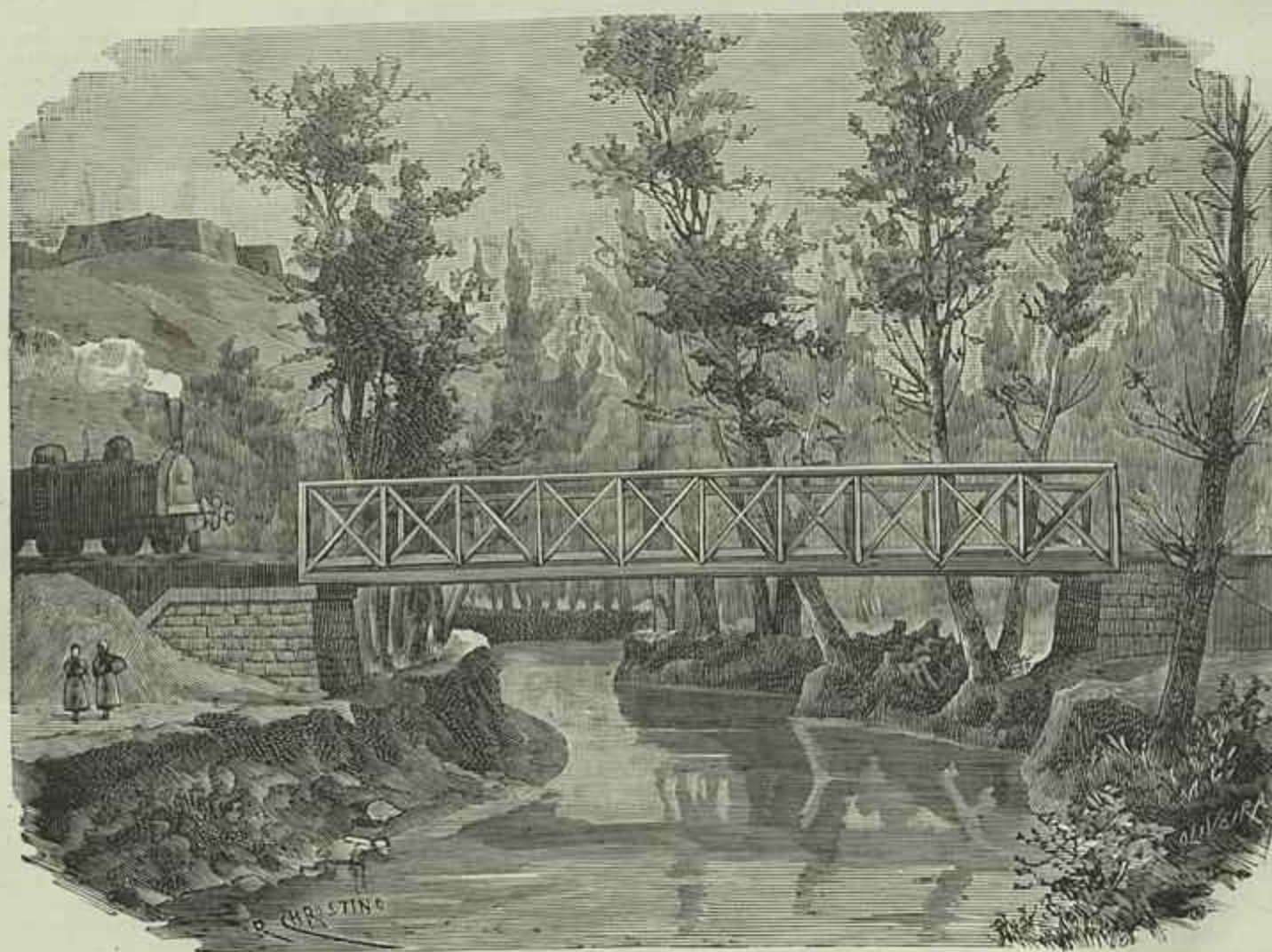
CAMINHO DE FERRO DE TORRES VEDRAS—PONTE METALICA SOBRE O SIZANDRO (Desenho do natural por J. R. Christino)