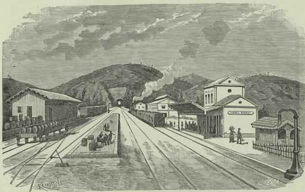
CAMINHO DE FERRO DE TORRES VEDRAS—ESTAÇÃO DE TORRES VEDRAS E TUNEL DA CERTÃ (Desenho do natural por J. R. Christino)