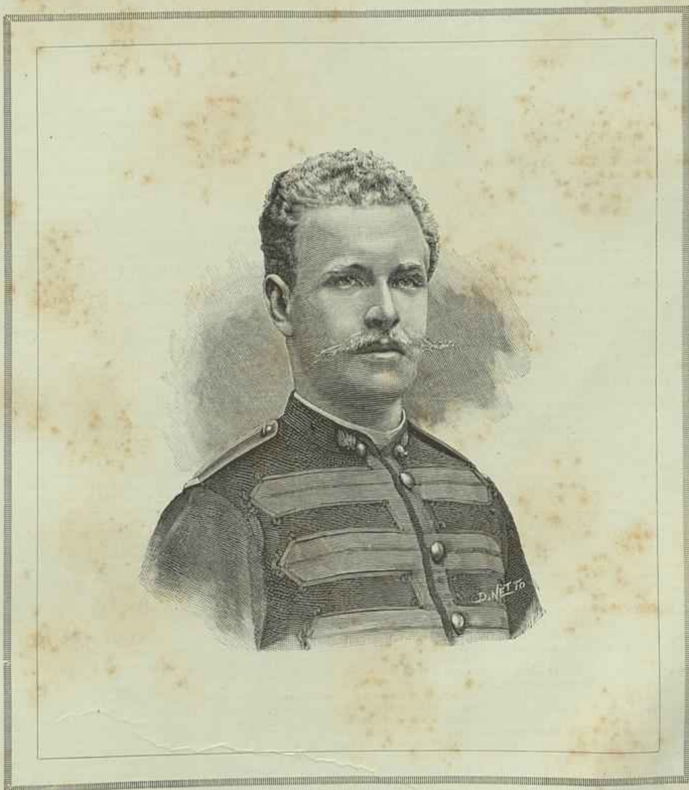
SUA ALTEZA O SENHOR INFANTE D. AFFONSO