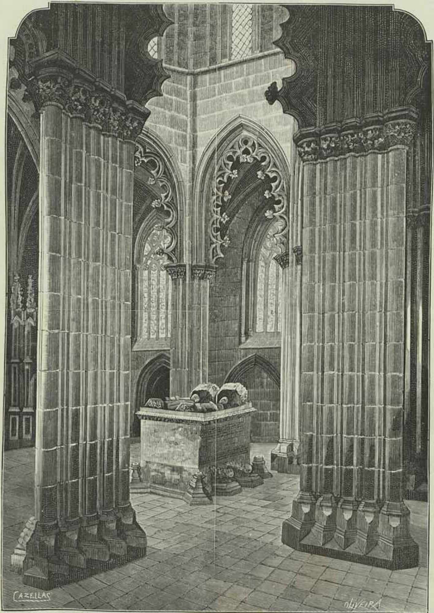
TUMULO DE D. JOÃO I, NO CONVENTO DA BATALHA — Vid. artigo «Uma visita á Batalha»