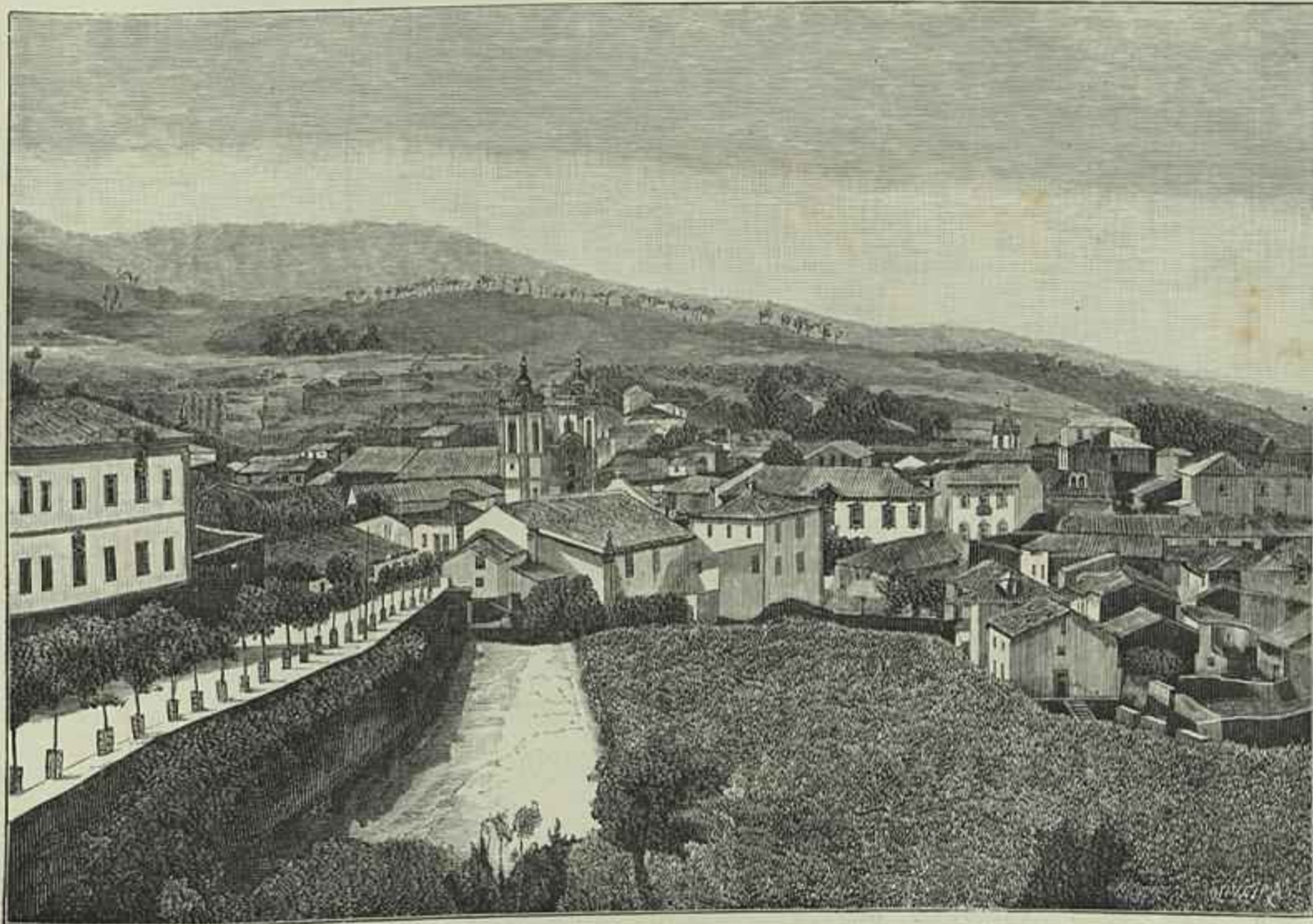
UMA VISTA DE GOUVEIA

A situação em que entrava no poder no dia 13 de setembro de 1871 o ministerio presidido por Fontes Pereira de Mello era verdadeiramente difficil e tormentosa. O ministerio Avila apresen-