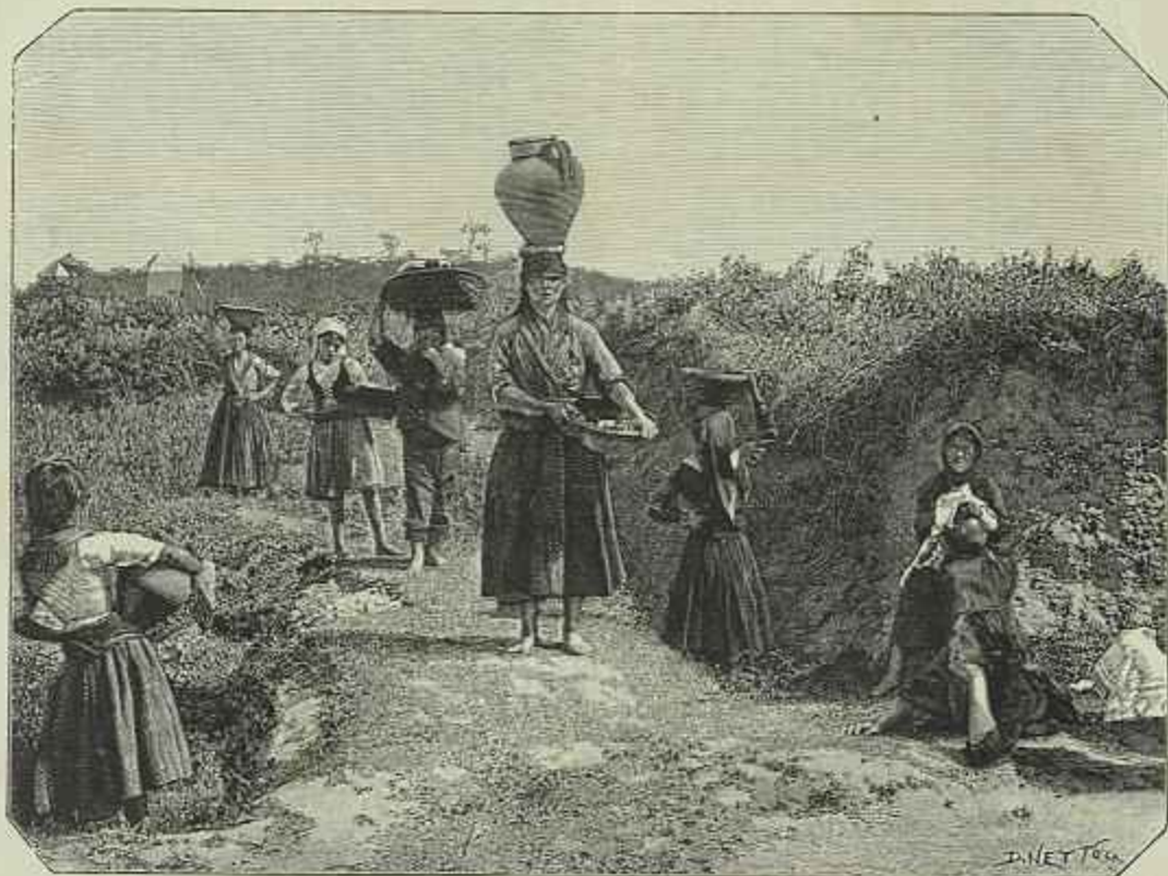
EM ESPINHO—COSTUMES