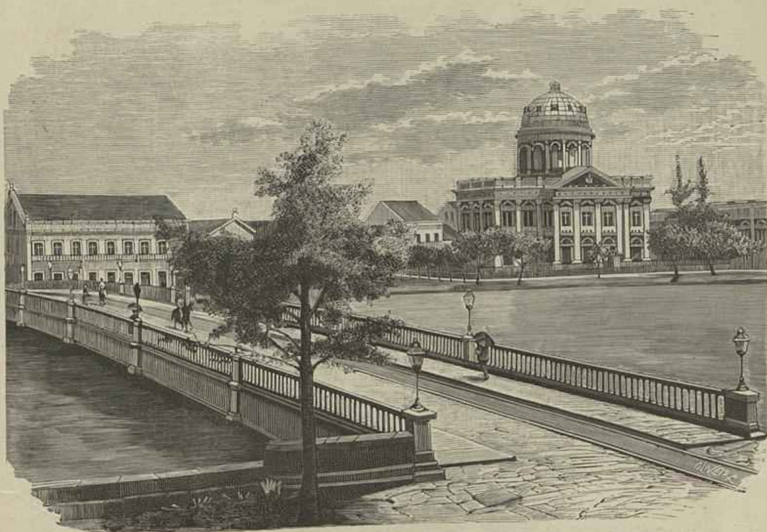
BRASIL. — PONTE DE SANTA ISABEL E PALACIO DA ASSEMBLÉA PROVINCIAL, EM PERNAMBUCO (Segundo uma photographia)

No arco que se segue está o tumulo do infante D. Henrique, duque de Vizeu, instituidor da escola de Sagres, o grande iniciador das aventuras viagens e notaveis descobertas dos portugueses, e cujo nome é pronunciado com respeito por todo o mundo onde chegou a fama do seu valor e da sua sabedoria. Sobre este tumulo vê-se a estatua do infante, vestido de armas brancas tendo na cabeça uma touca ou fóta. Por sobre a cabeça, que descança em almofada, ergue-se um baldaquino rendilhado, tudo obra de pedra delicadamente trabalhada. Sobre o friso superior do tumulo corre uma folhagem e por entre esta ve-se esculpido na pedra a seguinte letra do infante escripta em francez: Talant de bien fere . Por baixo do friso está a inscripção sepulchral em caracteres germanicos, a qual se acha deteriorada em alguns pontos, incluindo o da data