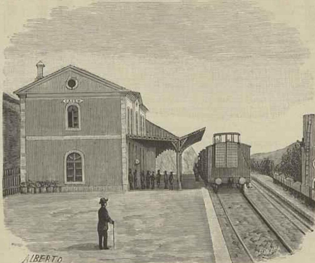
CAMINHO DE FERRO DE LISBOA A CINTRA—Estação de CACEM (Segundo uma photographia do photographo amador sr. Augusto Lamião)

legação, membros da colonia brasileira e da Sociedade de Beneficencia Brasileira, a qual suas altezas contemplaram com cincoenta libras. Na sua passagem no Tejo para bordo do paquete, salvou o couraçado Vasco da Gama . Os navios de guerra embandeiraram todos, tendo no tope a bandeira brasileira.