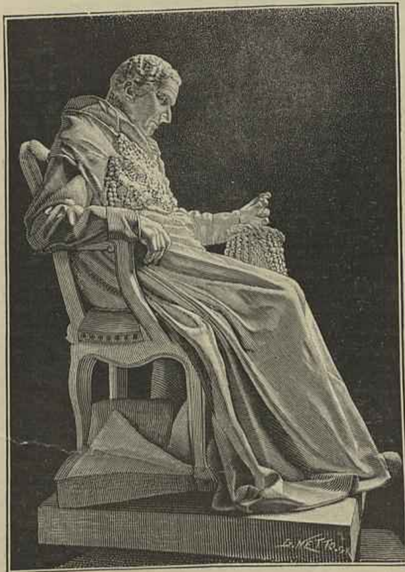
ESTATUA DE FELIX DE AVELLAR BROTERO, ESCULPTURA DE SOARES DOS REIS INAUGURADA NO JARDIM BOTANICO DA UNIVERSIDADE DE COIMERA, EM 30 DE MARÇO DE 1887