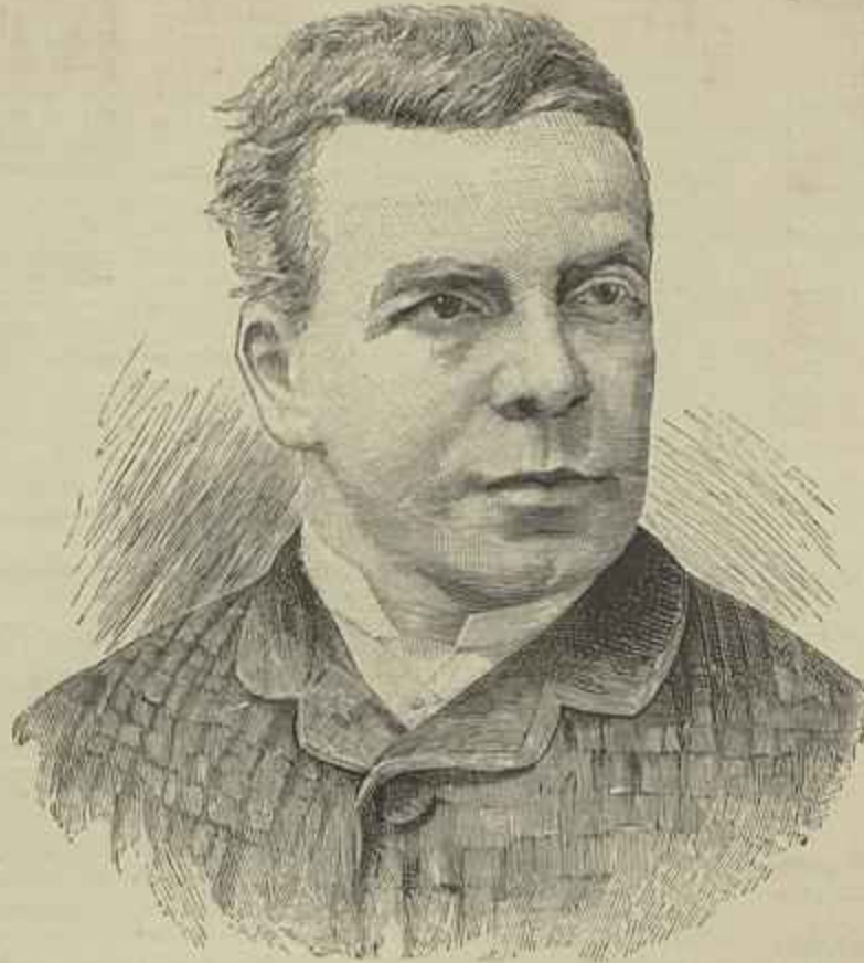
O ACTOR COQUELIN

FUNDAÇÃO DE ROMA. Dizem as folhas italianas que no dia 21 do mez passado se celebrou em Roma o