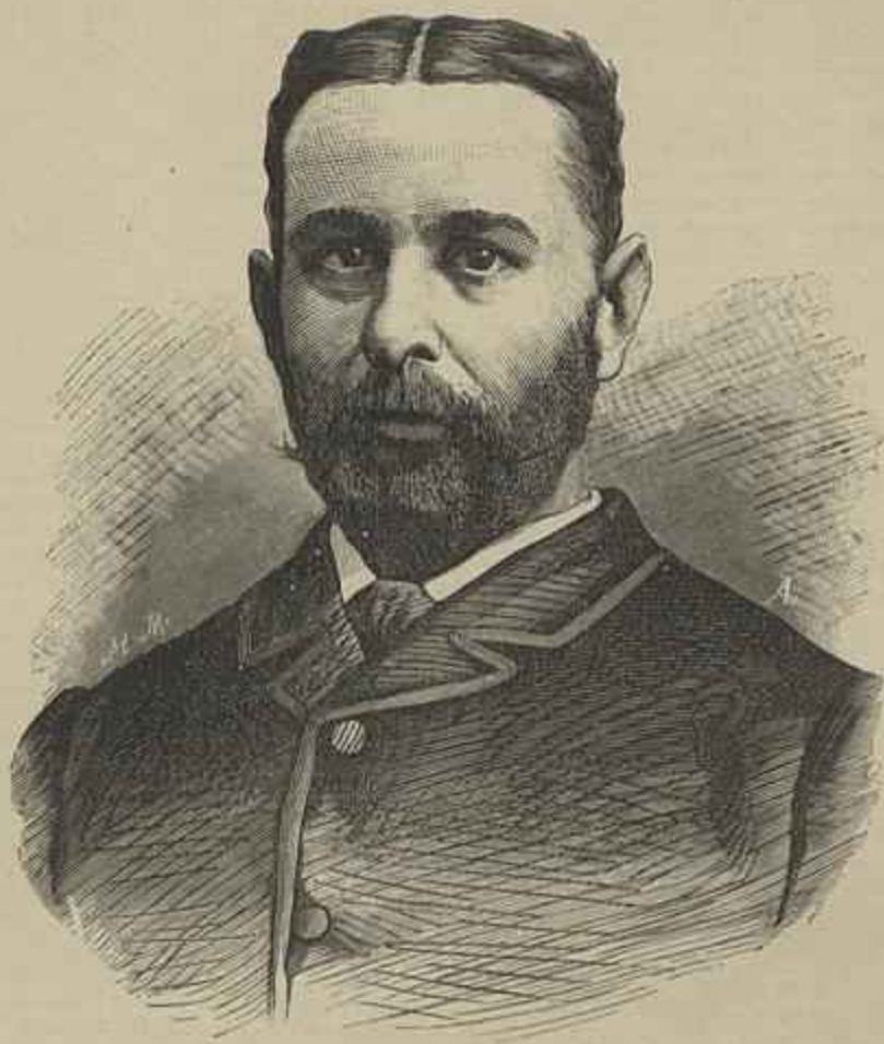
CONSELHEIRO AUGUSTO DE CASTILHO, GOVERNADOR GERAL DE MOÇAMBIQUE (Segundo uma photographia)

de linhas correctas e severas; em volta veem-se as aberturas dos fornos crematorios, construidos segundo os modernos preceitos d'este genero de construcções.