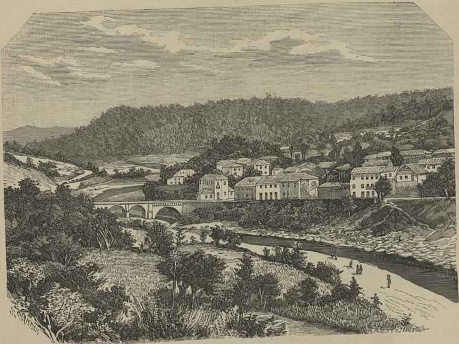
VILLA DO BANHO

N'este folheto veem-se os desenhos da caixa Castro, da caixa antiga, e das caixas modificadas da Imprensa Nacional de Lisboa, francezas e hespa-