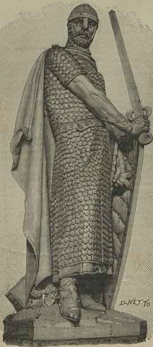
ESTATUA DE D. AFFONSO HENRIQUES — ESCULTURA DE SOARES DOS REIS

Levantei-me cedo, almocei, e fui á igreja levar o meu voto.