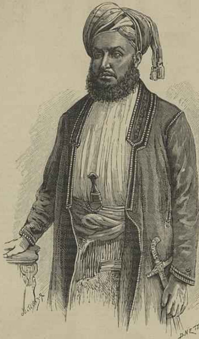
O SULTÃO DE ZANZIBAR

O OTHELLO DE VERDI. — O maior acontecimento artistico n'este momento é a representação da nova opera de Verdi Otello no Scala de Milão. O triumpho foi completo para o insigne maestro que na avançada idade de setenta e tres annos tem todos os enthusiasmos e todo o amor da arte que anima os talentos mais jovens. A grande opera em que trabalhava ha bastante tempo faria a reputação de Verdi se ella não estivesse já feita ha mais de um quarto de seculo. Verdi dirigiu os ensaios da sua nova obra e tem assistido ás representações, sem que a fadiga lhe tenha quebrado o enthusiasmo. Na noite do ensaio geral, Verdi ao aprear-se da carruagem que o conduzia ao theatro, foi alvo das mais ruidosas manifestações de applauso e conduzido triumphantemente até ao logar da orchestra. Na primeira noite de representação do Otello , Verdi estava no palco, e agitava as laminas de me-tal com que se imita o fragor do vento, na scena da tempestade que se segue ao preludio. No terceiro acto mareou o compasso dos coros e tomou parte em alguns, e no meio dos applausos que enchiam a sala conservava a maior serenidade, applaudindo por sua parte os artistas que desempenhavam a opera. Durante o espectáculo recebeu um telegramma dos reis de Italia que lhe desejavam o melhor exito á nova opera. Quando recolheu ao hotel em que estava hospedado, Verdi recebeu uma carta do director do theatro com nota de urgente, mas que não abriu. A