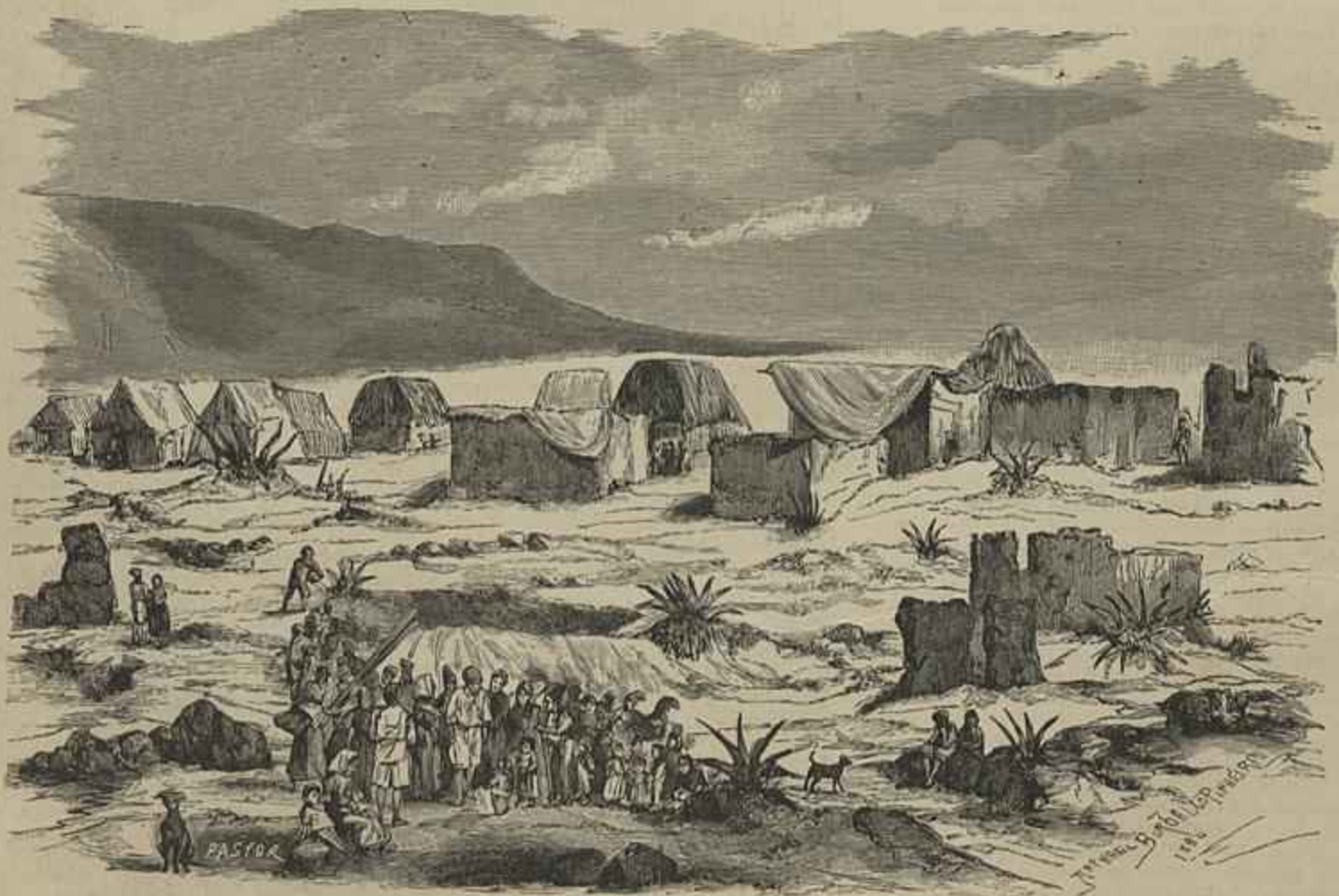
A COSTA DE CAPARICA, DEPOIS DO INCENDIO (Desenho do natural por Bordallo Pinheiro)

Grande artista pelo talento, a Theodorini possui uma voz maravilhosa, d'uma grande extensão, d'uma rara agilidade, que lhe permite abordar com grande successo todos os generos, triumphar no