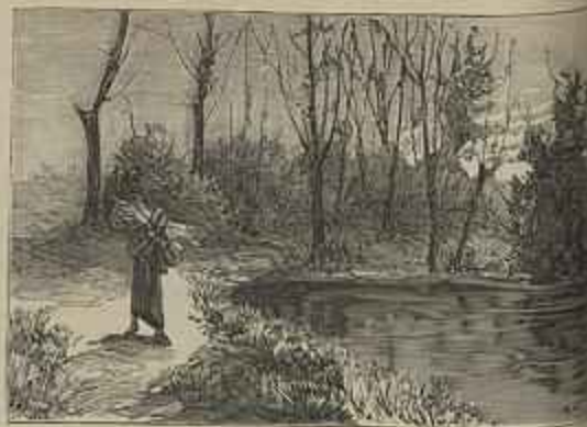
BOSQUE DE MENDON Quadro de Condessa, adquirido por Sua Magestade a Rainha