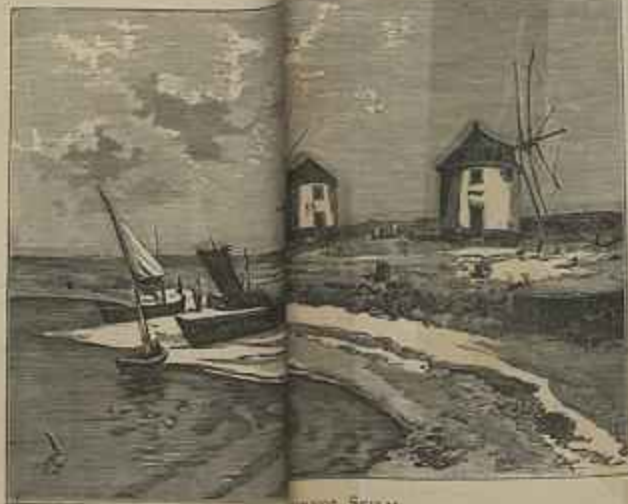
ERVILHAS, SEILAL PRAIA DE M. F. S.