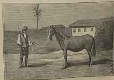
ANDALUZA Quadro de Reis