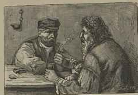
NA TABERNA Quadro de J. T. Bastos