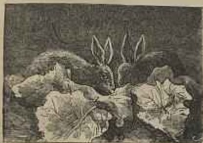
COELHOS Quadro de Oyrão