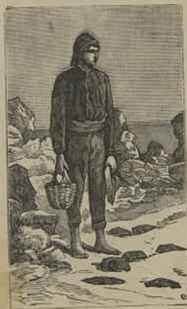
UM PESCADOR Quadro de Condessa