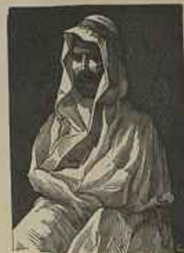
ARABE Quadro de A. C. M. Green