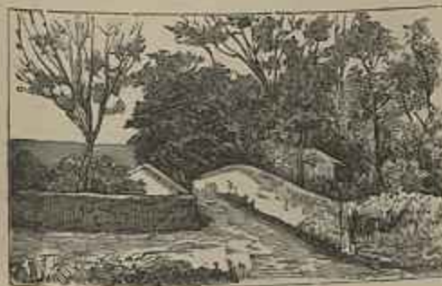
PONTE VELHA, PORTALEGRE Quadro de H. Pim