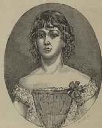
RETRATO DA MENINA G. CABRAL Quadro de A. Baralho