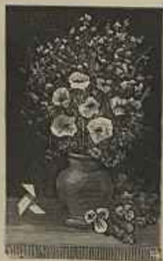
PAPÓULAS E BOTÕES DE OUBO Quadro de D. J. E. Green