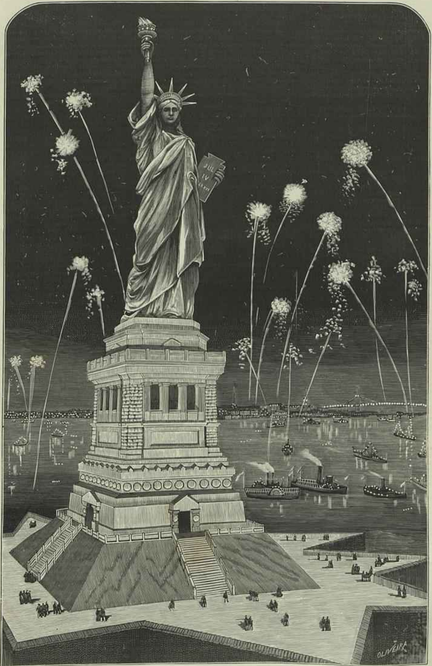
INAUGURAÇÃO DA ESTATUA DA LIBERDADE, ILLUMINANDO O MUNDO, Á ENTRADA DO PORTO DE NEW-YORK, 28 DE OUTUBRO DE 1886