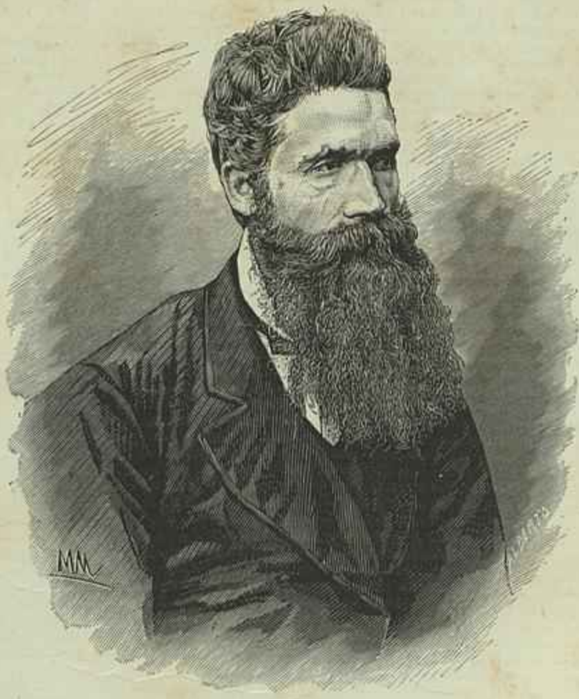
ANTONIO SOARES DOS REIS, PROFESSOR DE ESCULTURA DA ACADEMIA PORTUENSE DE BELLAS-ARTES