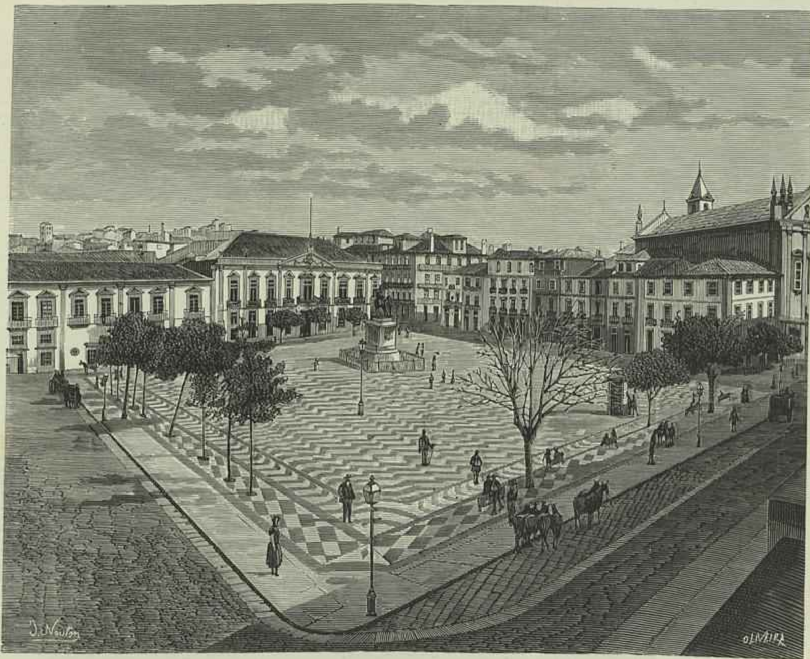
A PRAÇA DE D. PEDRO, NA CIDADE DO PORTO

Em toda a parte, e entre nós não é isso extranho, antes é constantissimo, os serviços nocturnos retribuem-se pelo dobro dos diurnos; pois na bibliotheca nacional não o são nem pela millesima, quanto mais pelo dobro. O empregado acaba o serviço de dia ás 4 horas da tarde, sae da repartição ás 4 e meia, e quando tem serviço nocturno, que para uns é um dia sim um dia não, para outros de dois em dois, ou de trez em trez, tem que ir a correr a casa, jantar á pressa, vir de novo a correr até á bibliotheca, porque ás 7 ha de estar aberta. Imagine-se quem mora á Estrella, ao Campo de Santa Anna, a Santos, a Arroios, ao Castello