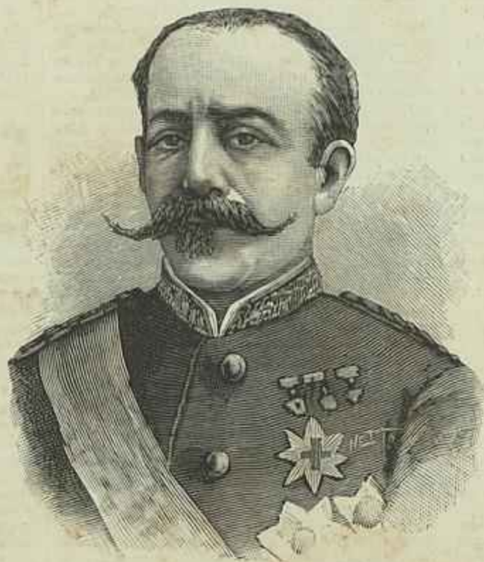
O BRIGADEIRO VILLACAMPA

Boletim da Sociedade de Geographia de Lisboa , fundada em 1875, Lisboa, Imprensa Nacional , 1885. — 5.ª serie, n.º 11 e 12, reunidos em um fasciculo, encerra elle, além das actas do