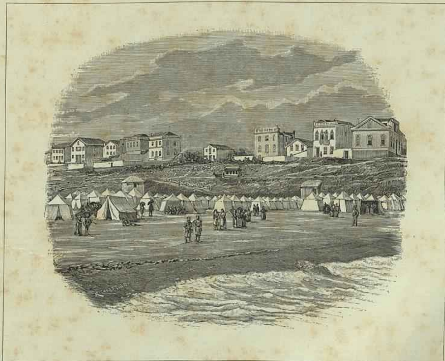
PRAIA DA FIGUEIRA DA FOZ (Segundo uma photographia)