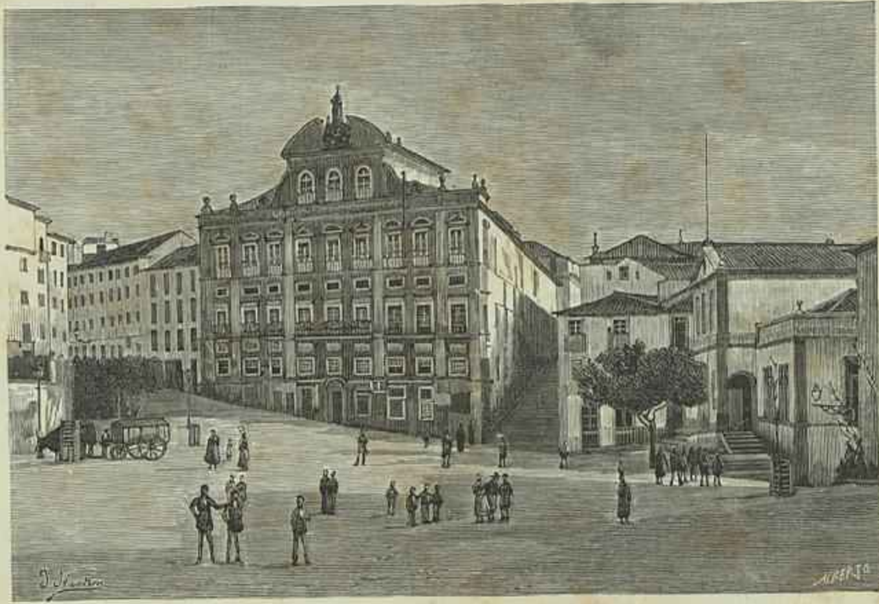
COLLEGIO DE S. JOÃO EVANGELISTA EM COIMBRA

amigos e beneficio do estabelecimento a que tão do coração se dedicára.