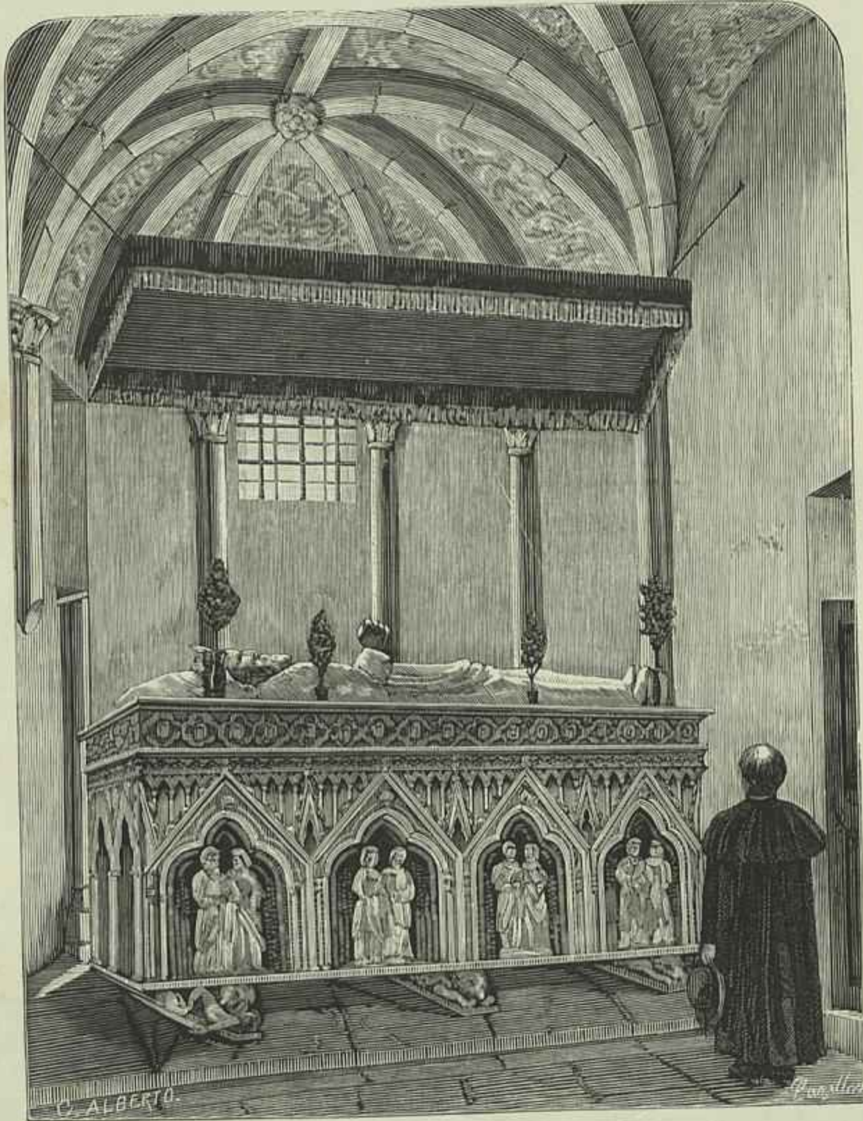
TUMULO DE EL-REI D. DINIZ, NO CONVENTO DE ODIVELLAS (Desenho do natural por C. Alberto)

pitulo III. A terceira e ultima reconstrucção foi em resultado da destruição causada pelo terramoto do 1.º de novembro de 1755. A capella-mór ficou illeza interiormente, mas no exterior padeceu grande ruina. No corpo da igreja abateu uma grande parede da abobada de laçaria de pedra das suas tres naves. Como a ruina da capella-mór apenas prejudicava a conformidade e belleza da architectura exterior, ficou sem reconstrucção. Porem a abobada das naves desapareceu, ou derrocada