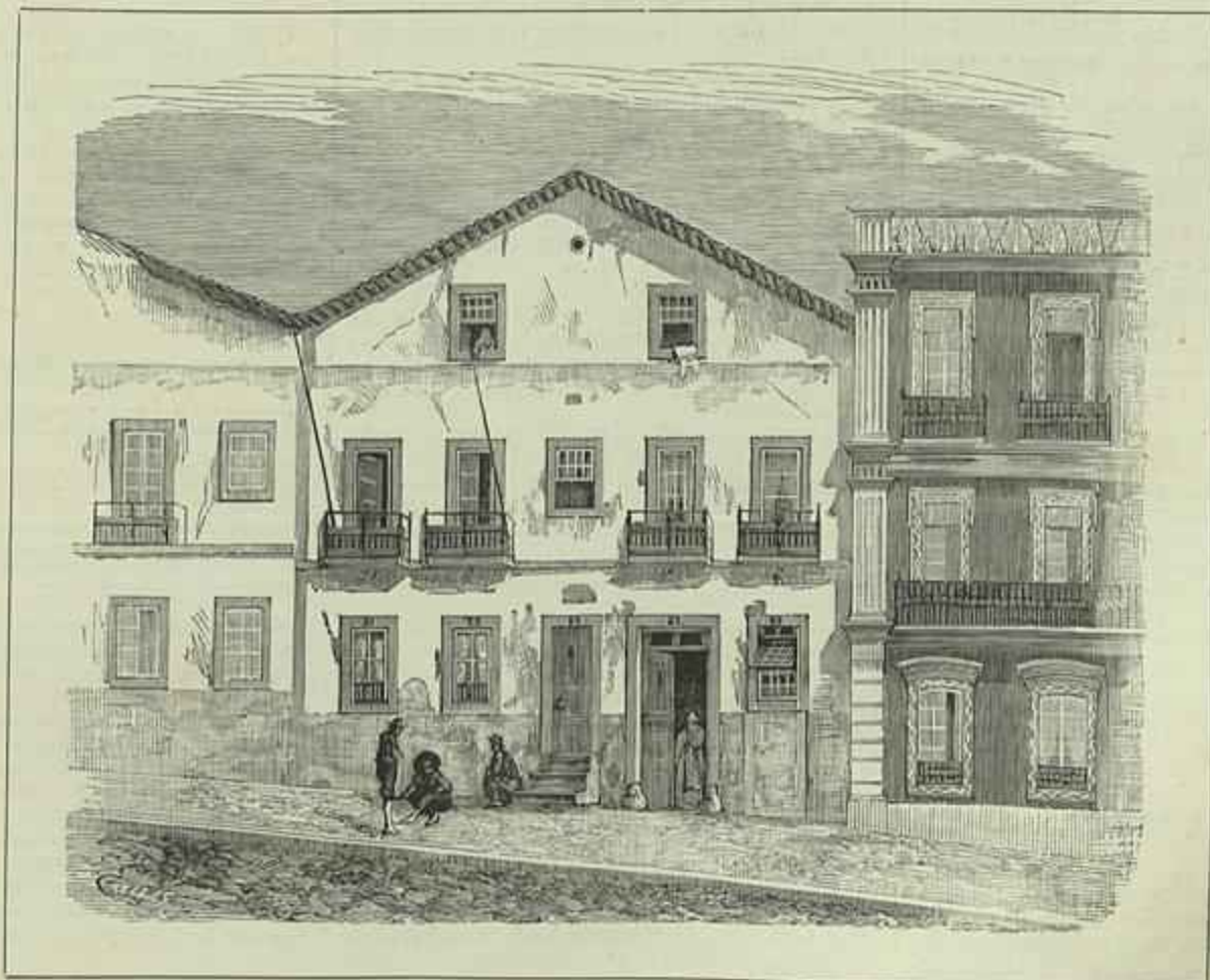
CASA ONDE MORREU O POETA NICOLAU TOLENTINO DE ALMEIDA (Desenho do natural) por Cazellas