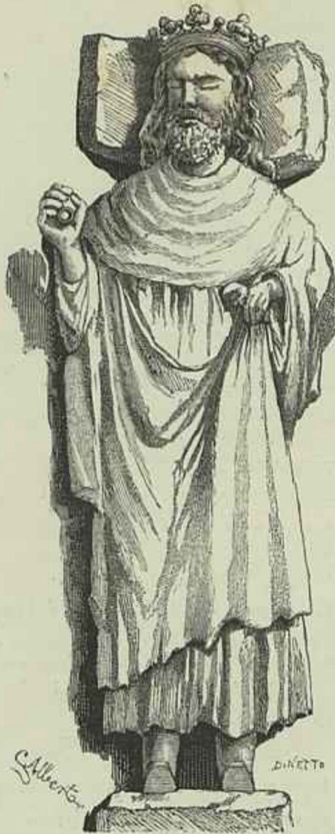
ESTATUA TUMULAR DE EL-REI D. DINIZ (Desenho do natural por C. Alberto)

e selvageria. E que vergonha para nós, portugueses, que nos ufamamos da nossa civilização, se alli for um estrangeiro, e observar aquelles repugnantes emplastros, e as proprias mutilações da estatua do rei-lavrador!