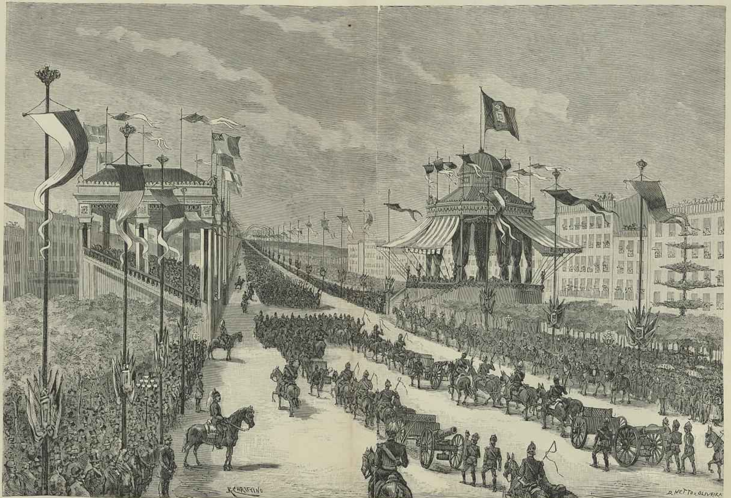
CASAMENTO DE S. A. O PRINCIPE REAL D. CARLOS DE BRAGANÇA — A PARADA DO DIA 25 DE MAIO DE 1883, TRÓPAs DESFILANDO EM FRENTE DA TRIBUNA REAL, NA AVENIDA DA LIBERDADE