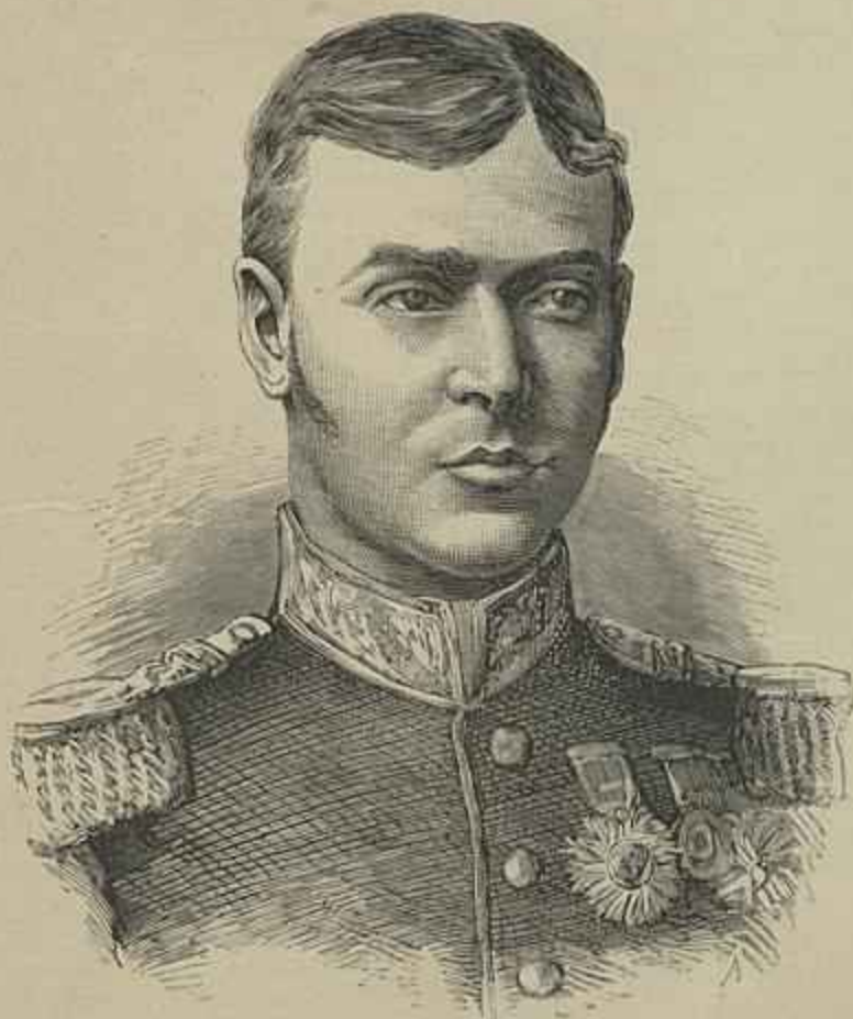
PRINCIPE JORGE DE INGLATERRA