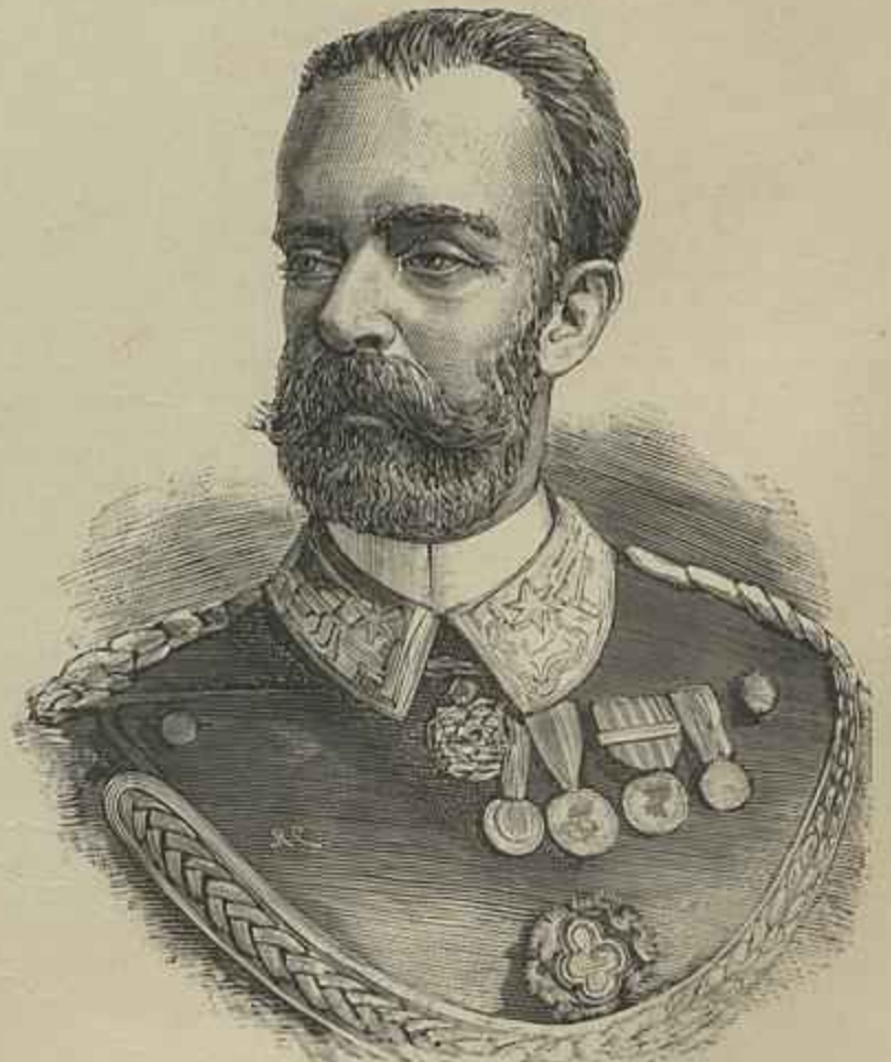
PRINCIPE AMADEU, DUQUE DE AOSTA