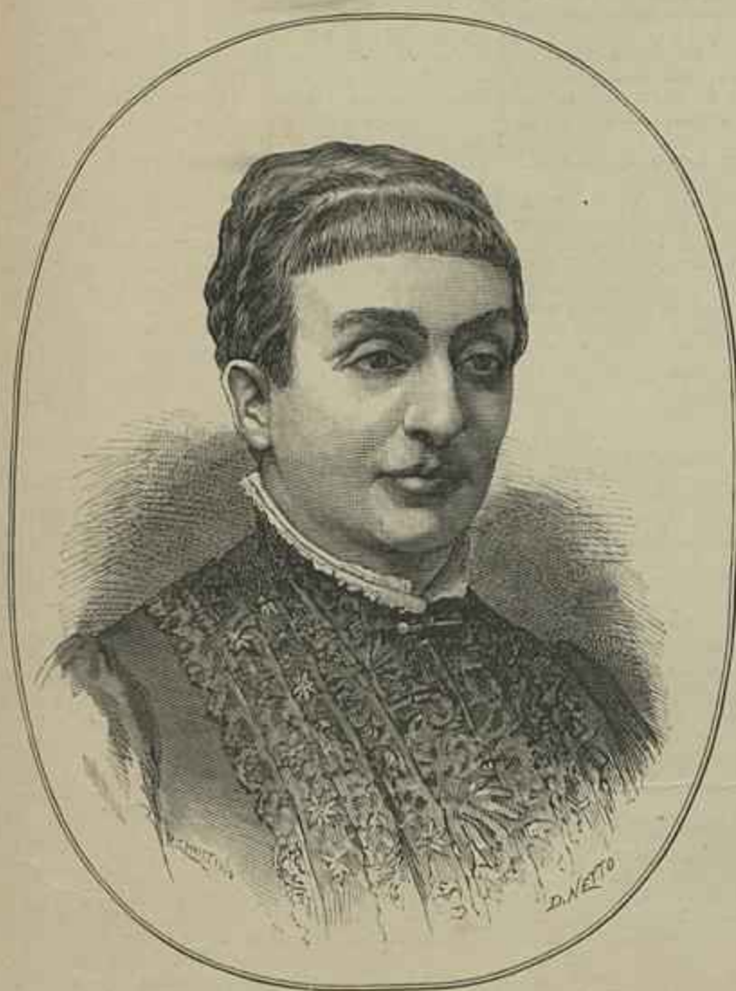
CONDESSA DE PARIS