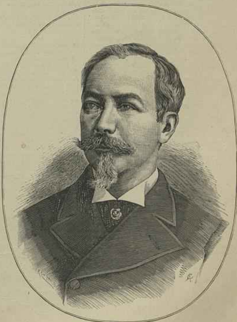
CONDE DE PARIS