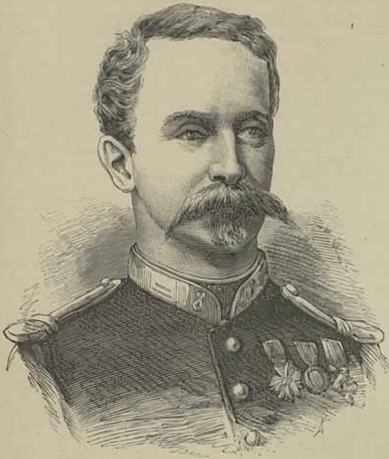
DUQUE DE CHARTRES