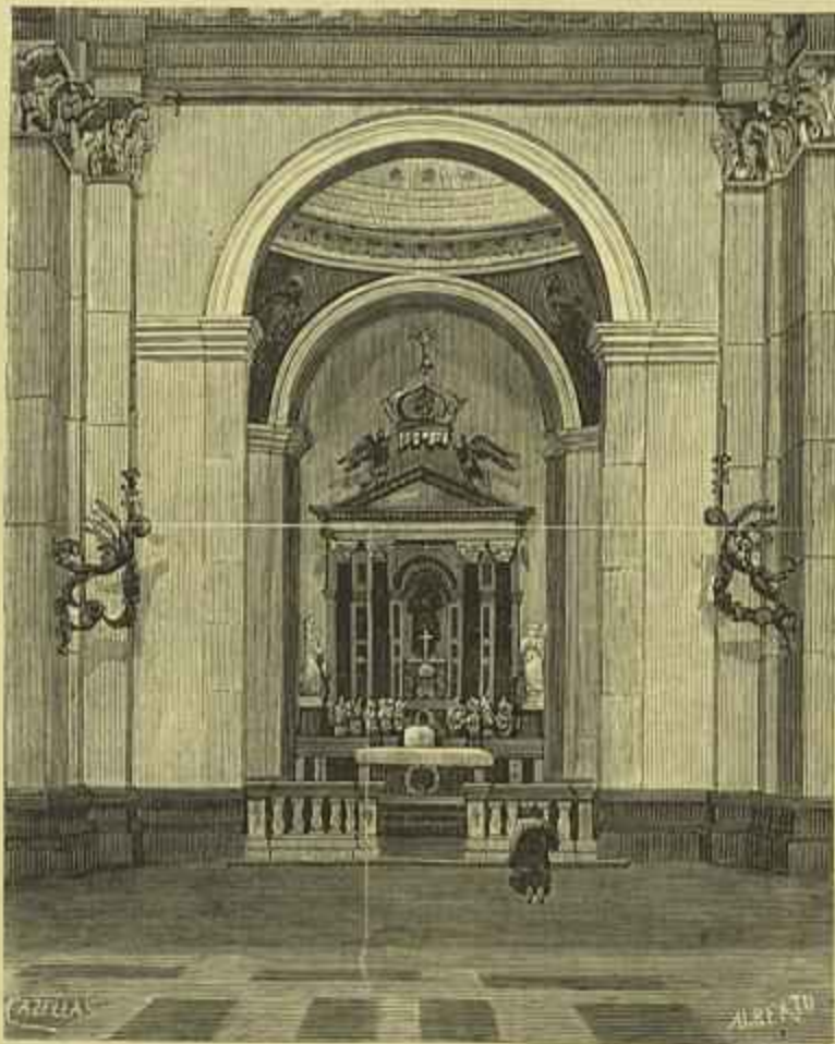
BRAZIL — CAPILLA DO SANTISSIMO CORAÇÃO DE JESUS, NA NOVA EGREJA DE NOSSA SENHORA DA PENHA, EM PERNAMBUCO

A estas traducções seguiram-se com pequenos intervallos: o Me-