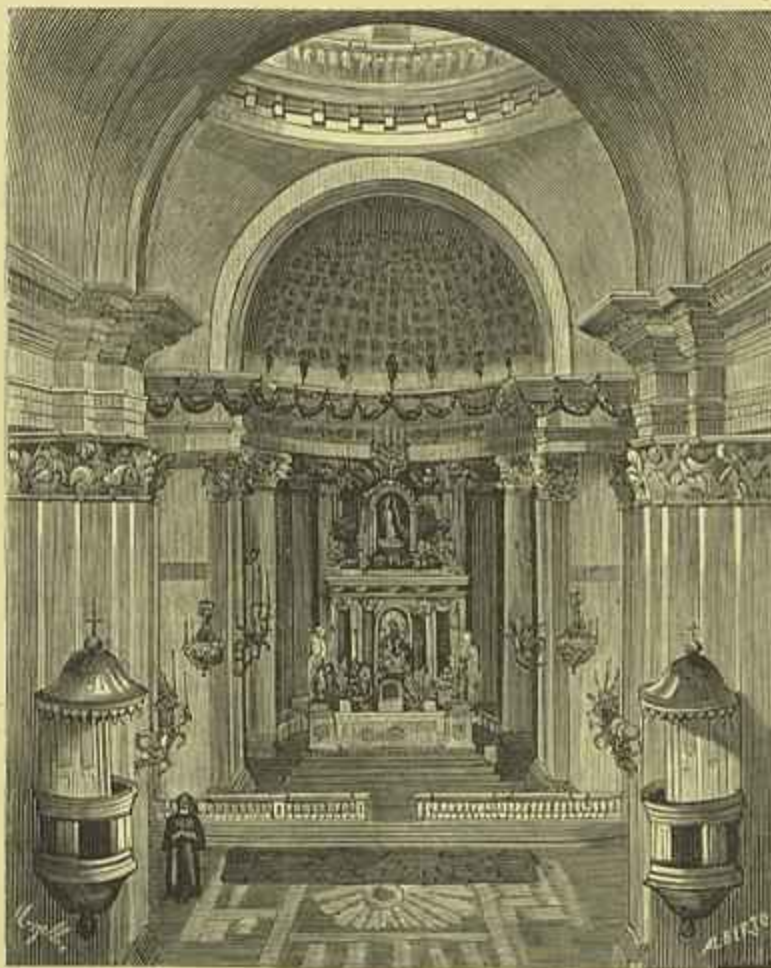
BRAZIL — CAPELLA-MÓR E CRUSEIRO DA NOVA EGREJA DE NOSSA SENHORA DA PENHA, EM PERNAMBUCO

É pasmosa esta actividade de trabalho que este homem desenvolve nos ultimos quinze annos de