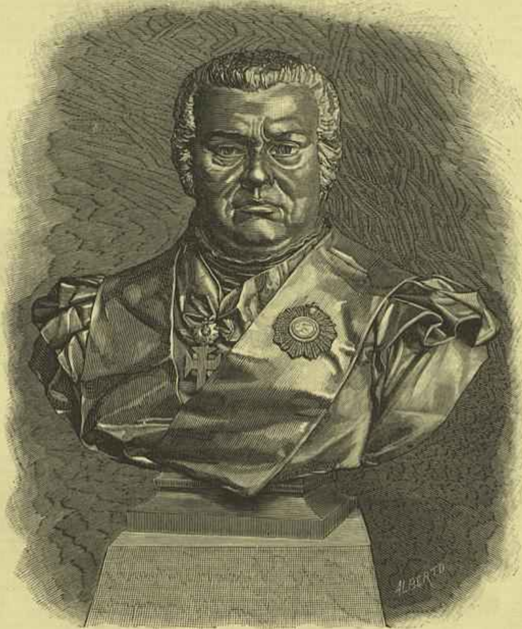
BUSTO DE FRANCISCO DE ALMADA E MENDONÇA, INAUGURADO NO DIA 5 DO CORRENTE, NO CEMITERIO DO PRADO DO REPOUSO, NO PORTO

O illustre ministro da marinha, que tem, pela sua influencia e pelo valente impulso dado á viagem exploradora de Capello e Ivens, parte brilhante nos resultados gloriosos da expedição, acompanhado pela direcção da Sociedade de Geographia, a quem cabe a enorme honra de ser a iniciadora em Portugal d'esta nova epocha de estudos das colonias e de exploração das regiões africanas, vão esperar a Paço de Arcos os bene-