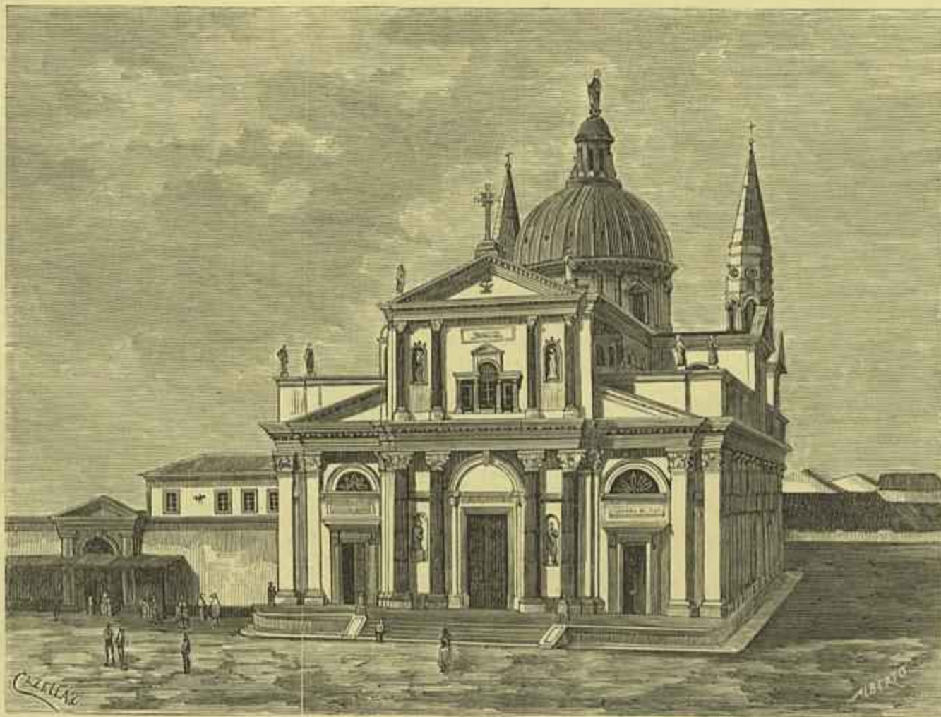
BRAZIL — NOVA EGREJA DE NOSSA SENHORA DA PENHA, EM PERNAMBUCO