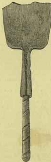
A PÁ DE ALJUBARROTA, DA PADEIRA BRITES DE ALMEIDA