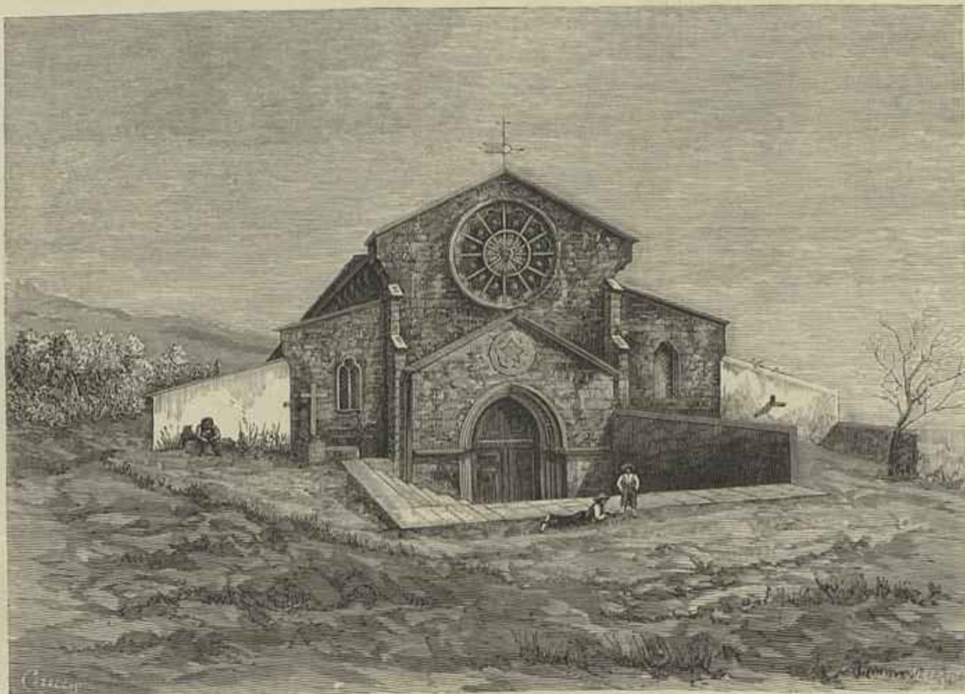
THOMAR — EGREJA MATRIZ DE SANTA MARIA DO OLIVAL (Segundo um desenho do natural de Ribeiro Arthur)