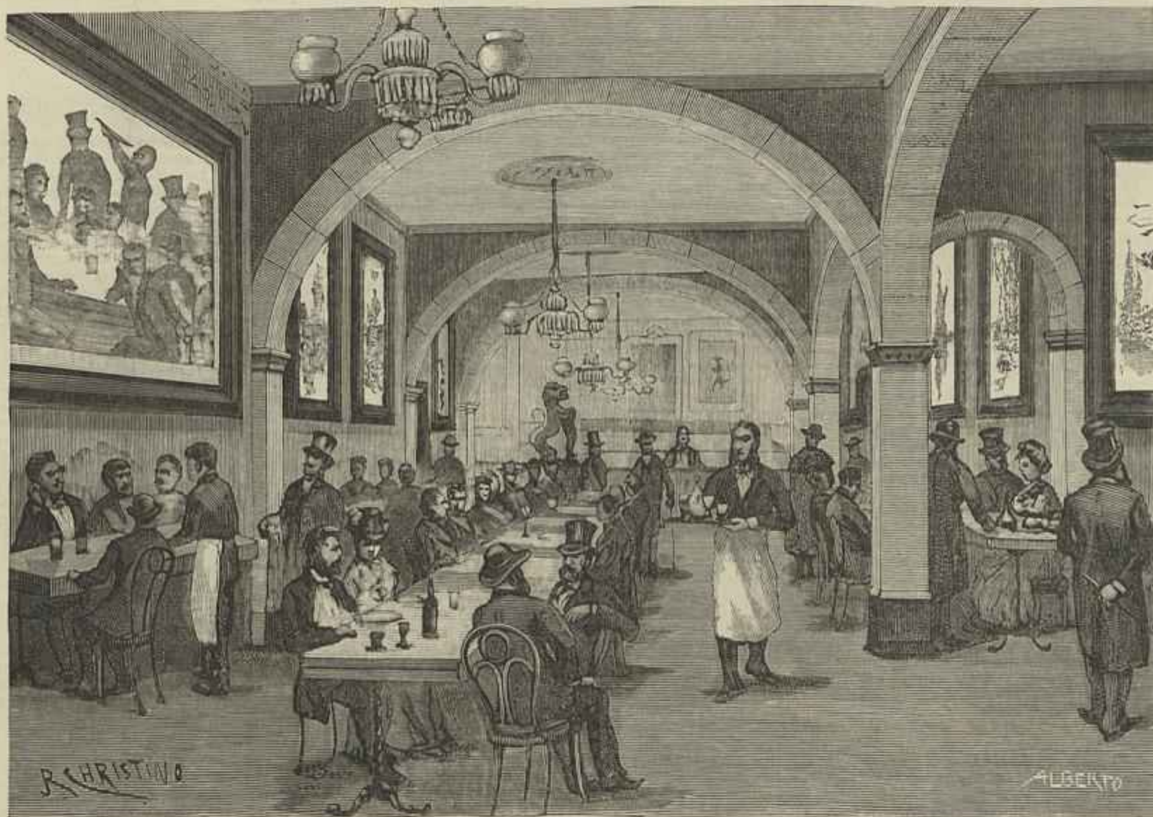
A CERVEJARIA LEÃO DE OURO, INAUGURADA EM 16 DE ABRIL DE 1885 (Desenho do natural por J. Christino)

Ora eu creio que no cartaz do Gymnasio não