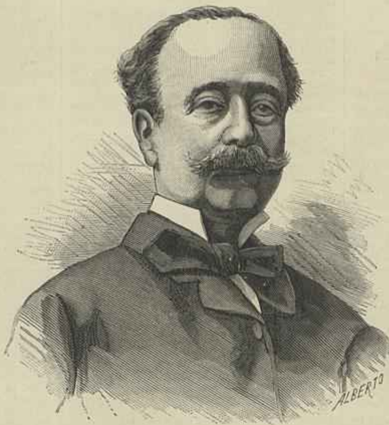
MARQUEZ DE PENAFIEL, MINISTRO DE PORTUGAL EM BERLIM