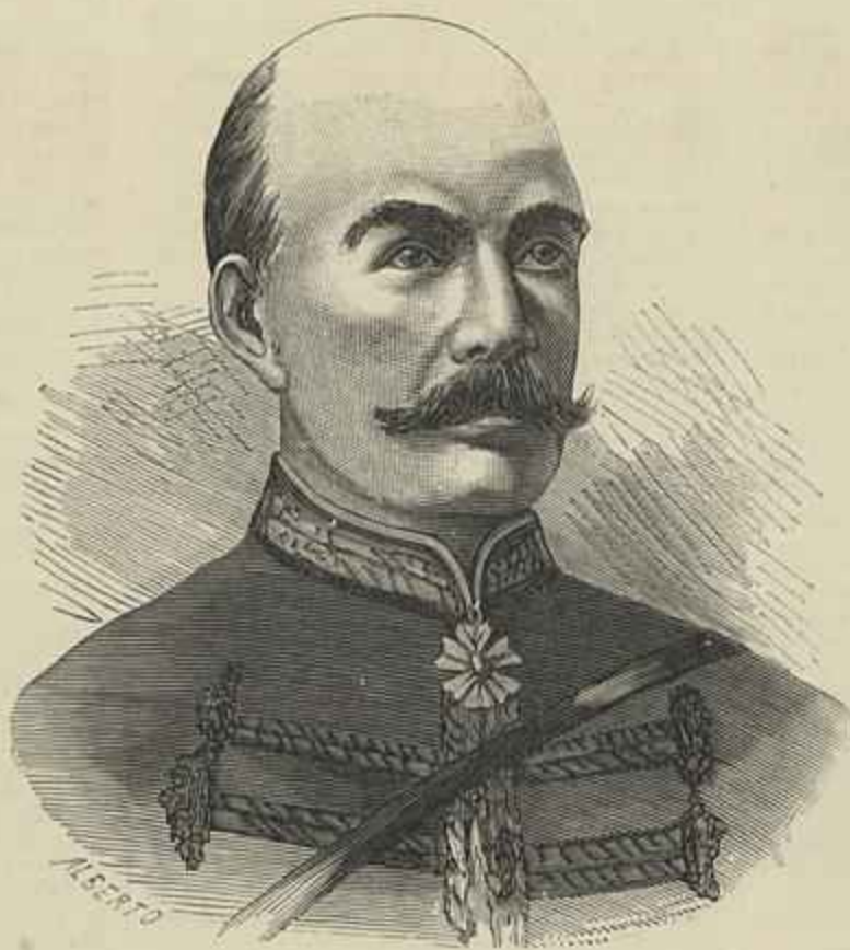
GUERRA FRANCO-CHINEZA — O GENERAL DE NÉGRIER

de juros e amortisação muito soffrivel que, fatalmente augmentará logo que se façam as obras e habilitem Lisboa a ser um dos primeiros portos do mundo. O sr. Paes conclue assim este volume: