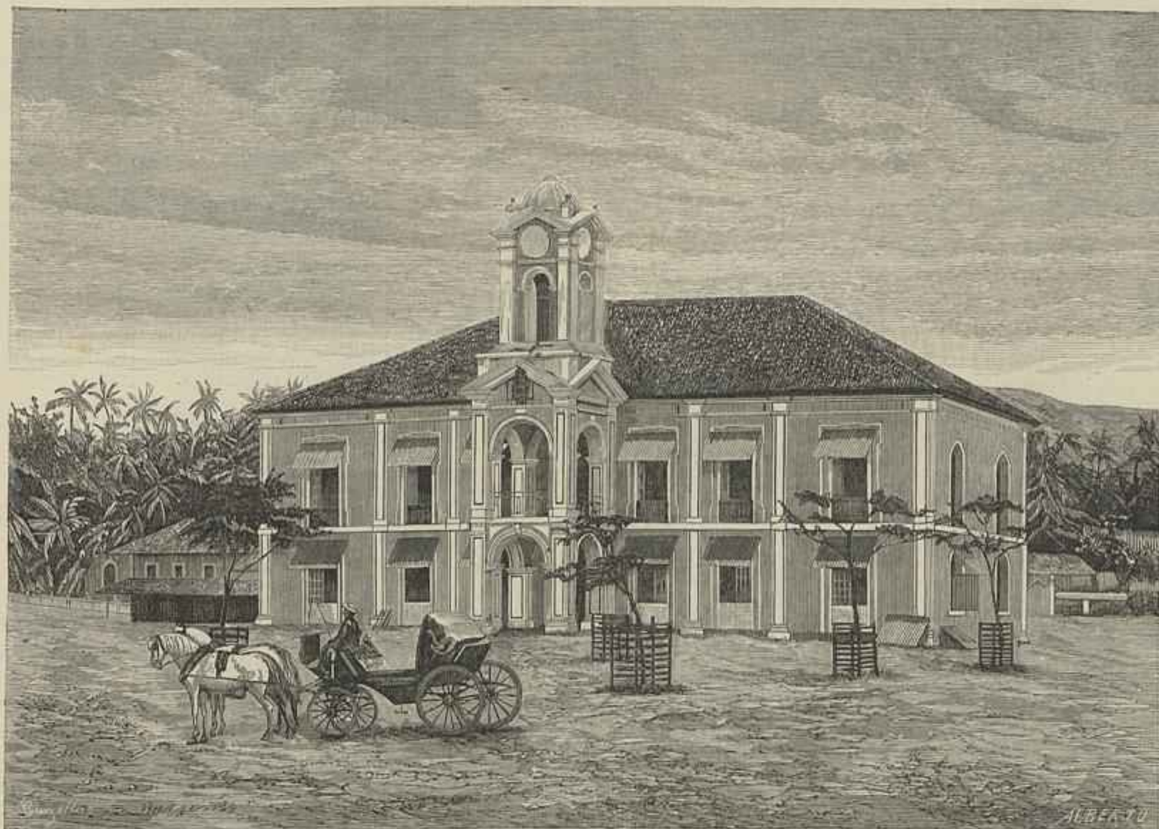
INDIA PORTUGUEZA — PAÇOS DO CONCELHO, EM PANGIM (Segundo uma photographia)

A Noute do Castello era a conversão em poema de uma das mil e uma baladas e historias da epoca das cruzadas, como tantas ouvimos contar em pequenos; e com quanto se lhe quizesse logo dar parentesco com esta ou com aquella, é certo que o facto é commum a varias, com maior ou menor differença nas peripecias. Nem valia a pena perder tempo a discutir esse ponto. O as-