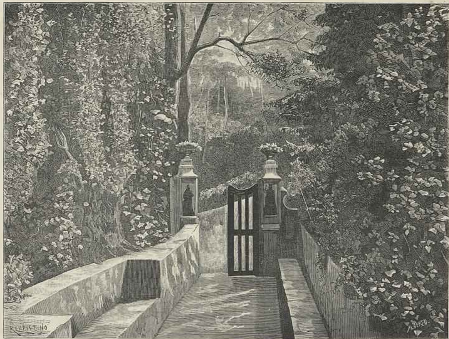
LAPA DOS ESTEIÓS, EM COIMBRA, LOGAR PREDILECTO DE CASTILHO