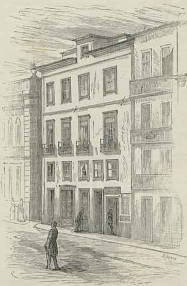
CASA ONDE NASCEU CASTILHO, NA RUA DA TORRE DE S. ROQUE, EM LISBOA (Segundo um desenho do sr. Visconde de Castilho (Julio))