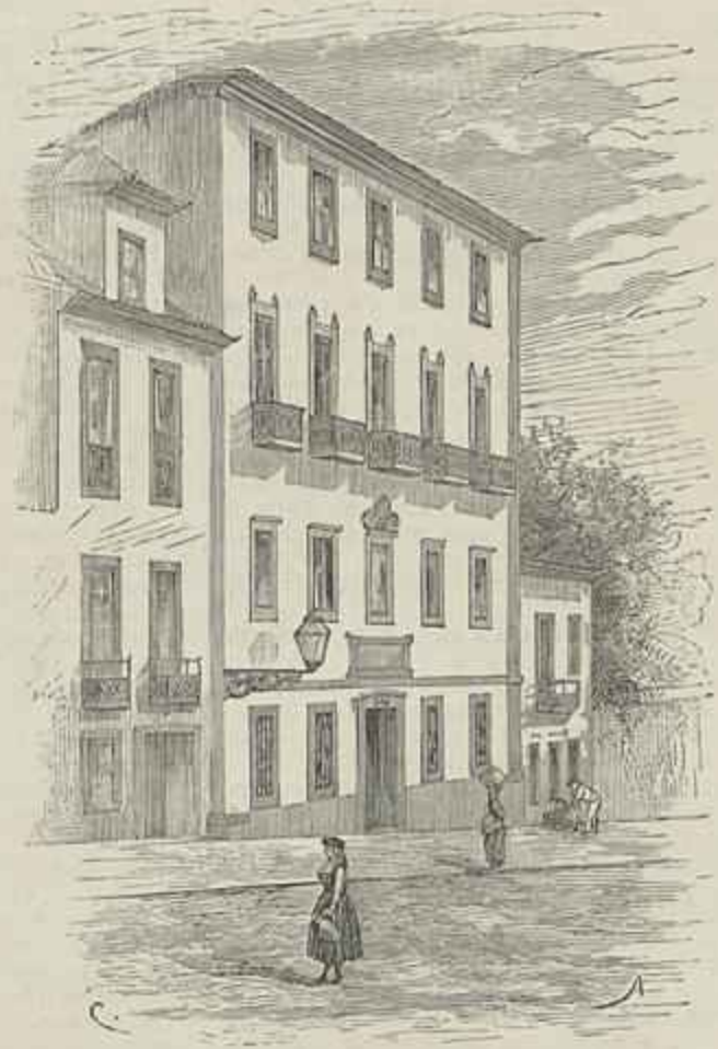
CASA ONDE MORREU CASTILHO, NA RUA DO SOL AO RATO, EM LISBOA. (Desenho do natural por Cazellas)

o retrato foi pintado para figurar em um concerto nocturno, no palco de um theatro, o auctor serviu-se de um colorido, em que o excesso do branco poderá produzir bom effeito á luz do gaz, mas que em uma galeria qualquer destoa completamente.