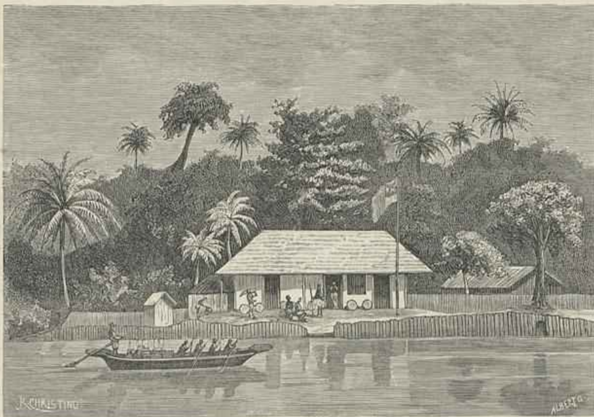
AFRICA PORTUGUEZA — QUISSANGA, NO ZAIRE (Segundo um desenho do sr. J. A. Celestino Soares).

predio, Jaen, Marbella, Cordova, Granada onde morreram dois individuos e outros feridos, em Andaluzia produzindo alguns estragos em Almeria e derrubando varios edificios em Antequera. Em Velez-Malaga fez algumas victimas desabando a estação telegraphica; a população fugiu toda para os campos. Loja ficou muito arruinada e em Monril morreu um homem e acham-se muitos feridos. Albuñuelas ficou quasi destruida e em Sevilla houve grande panico mas pouco importantes estragos. Os despachos officiaes de Andaluzia dizem que o tremor produziu a morte a cerca de 260 pessoas em varias villas e aldeias das provincias de Malaga e Granada. Desde 1857 que na península se não sentiam tão fortes tremores de terra, ou que pelo menos fizessem tantos estragos e victimas. Em Lisboa, Porto, Evora e outras terras de Portugal sentiram-se alguns ligeiros abalos, repercussão dos que houve em Hespanha, sendo alguns tão imperceptiveis que apenas foram accusados pelos instrumentos do observatorio do infante D. Luiz da Escola Polytechnica de Lisboa.