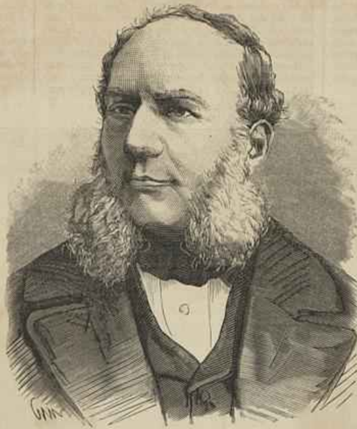
WILLIAM SIEMENS — FALLECIDO A 20 DE NOVEMBRO DE 1883

D. Eleva, ficando viuva e sem filhos, fundou junto ao mosteiro um recolhimento de beatas , observando tambem a regra de S. Bento; por fórma que os dois institutos religiosos, fundidos n'um, vieram a constituir assim um mosteiro dos chamados duplices , em que viviam frades e freiras em aposentos separados, reunindo-se todos na egreja em alguns dias sole-