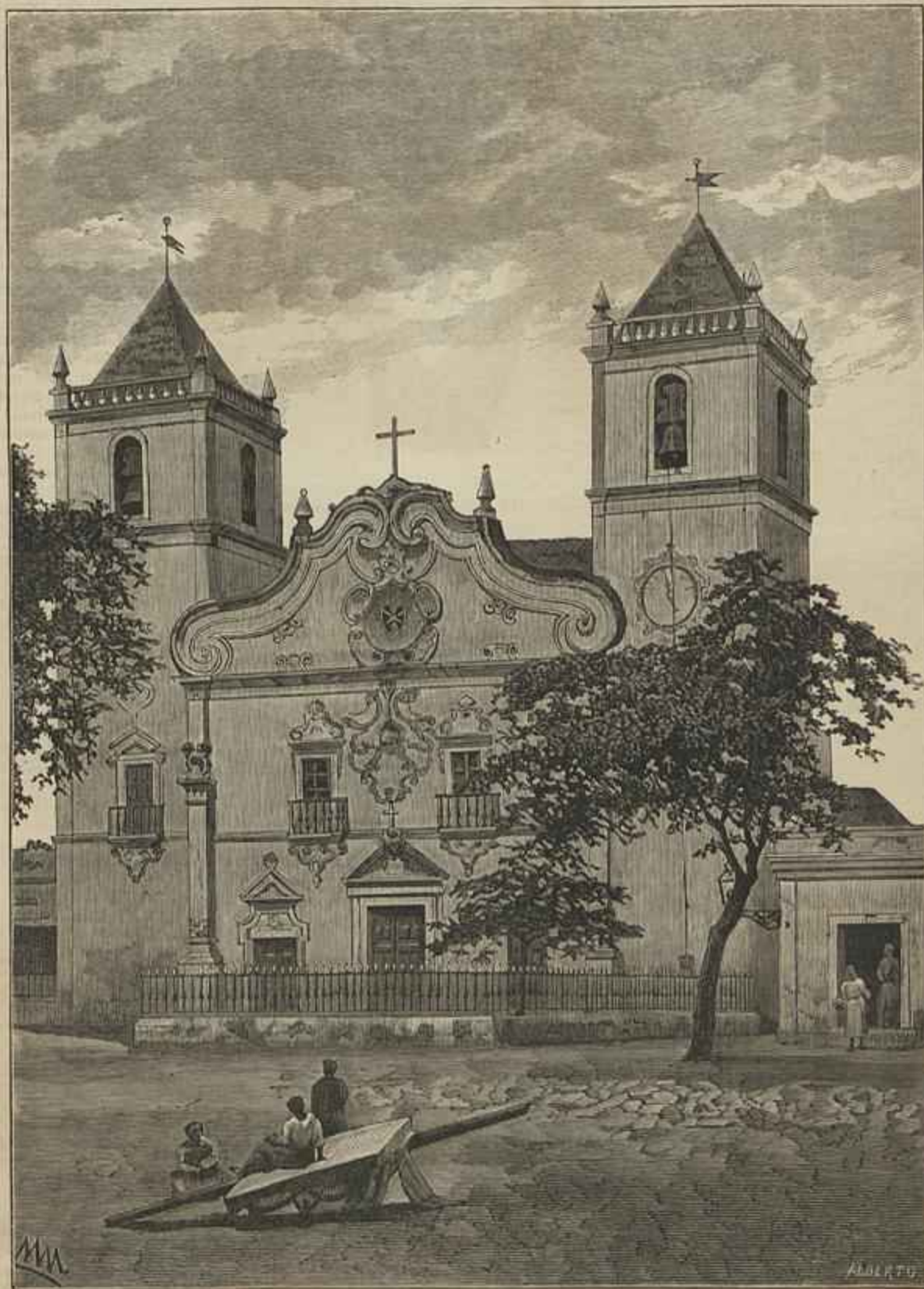
AFRICA PORTUGUEZA — LOANDA, EGREJA DE NOSSA SENHORA DOS REMEDIOS

nicioso exemplo dos seus antigos collegas na reclusão, se fóssem manso e manso desmandando, a ponto de esquecerem não poucas o acatamento e modestia devidas á regra em que haviam professado. E a rainha D. Mafalda, que em 1220 entrava os aditos do mosteiro, resolvida a passar n'elle santamente o resto de seus dias, achou-o desmoralizado e facil nos costumes, e arruinado e pobre de haveres. Para logo curou de amplificar-o,