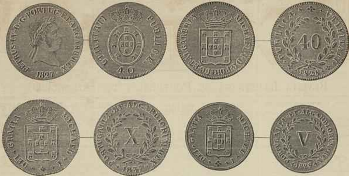
MOEDAS DE COBRE DO REINADO DE D. PEDRO IV E D. MIGUEL I, QUE RETIRAM DA CIRCULAÇÃO

RÁTICE ALLEMA. O intendente de um palacio, proximo de Goglan, prohibiu a cultura dos espargos na horta respectiva, sob pretexto de que elles são uma planta aristocratica. Tem coizas estes ratões!