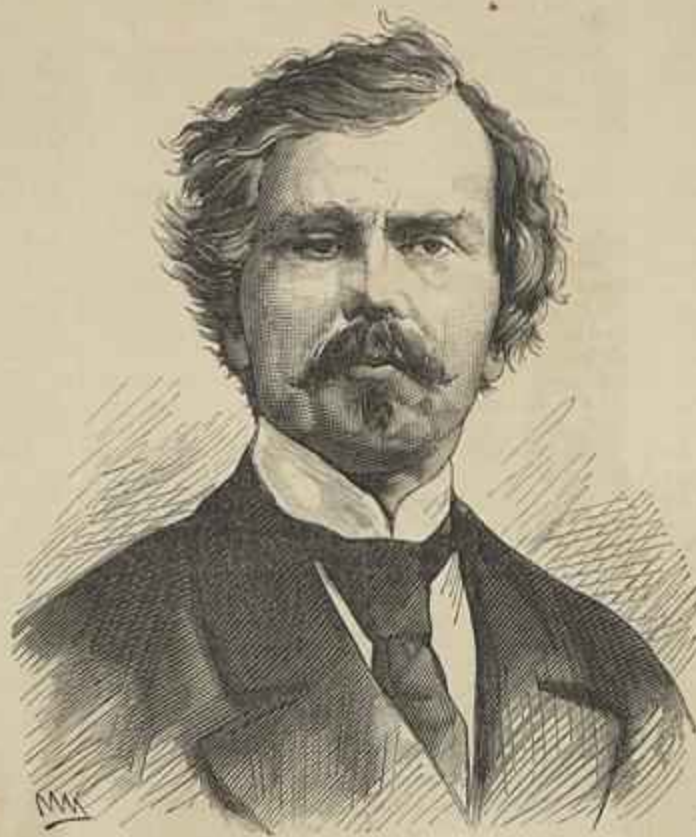
O CAPITÃO MAYNE REID — FALLECIDO EM 22 DE OUTUBRO DE 1883

Todos os chronistas são accordes em descrever D. Mafalda como assaz formosa de corpo e bondosa e perfeita na alma. Duarte Nunes de Leão chama-lhe fermosissima . Ruy de Pina