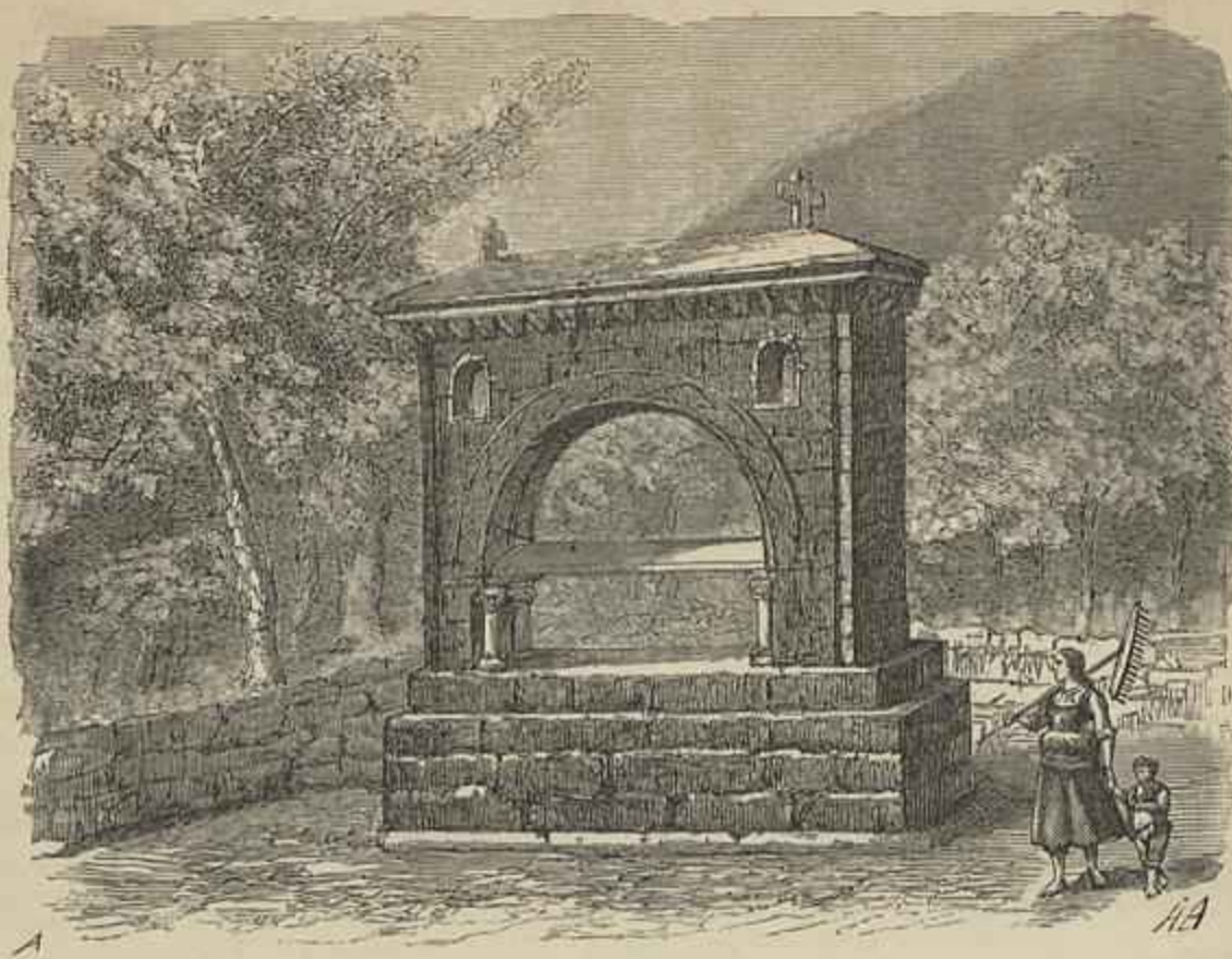
MONUMENTO EM BURGO, COMMEMORATIVO DO ENTERRO DA RAINHA D. MAFALDA — Vid. art. Mosteiro de Arouca (Segundo um desenho do natural por Abel Accacio)

OBRIGATORIEDADE DO ENSINO. Discursos proferidos pelo dr. J. Eduardo Freire de Carvalho Filho, na Assembléa provincial da Bahia em 1883 . — 8.º de 41 paginas, sem logar de impressão. Discutiu-se o assumpto n'aquella assembléa, e houve grande controversia sobre o ensino religioso na escola, o orador defendeu este principio e argumentando com o exemplo de muitas nações europeas, incluiu tambem Hespanha e Portugal; outro deputado sr. Caldas de Brito disse que estes dois eram pai-