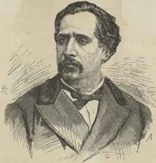
A. C. BARJONA DE FREITAS Ministro do Reino