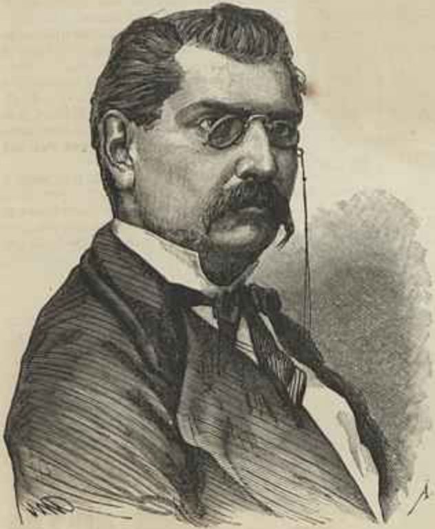
MANUEL PINHEIRO CHAGAS (Ministro da Marinha e Ultramar)