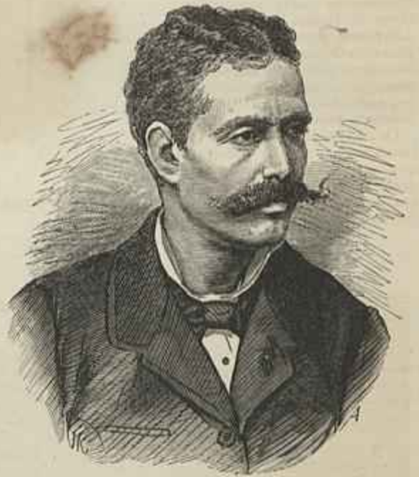
LOPO VAZ DE SAMPAIO E MELLO (Ministro da Justiça)