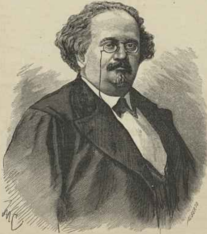
ANTONIO AUGUSTO D'AGUIAR (Ministro das Obras Publicas)