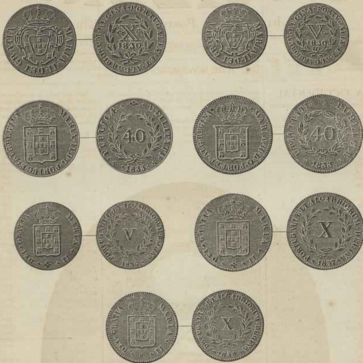
MOEDAS DE CORRE DO REINADO DE D. MARIA II, QUE RETIRAM DA CIRCULAÇÃO

AGENCE INTERNATIONALE DE LA PRESSE, CORRES-