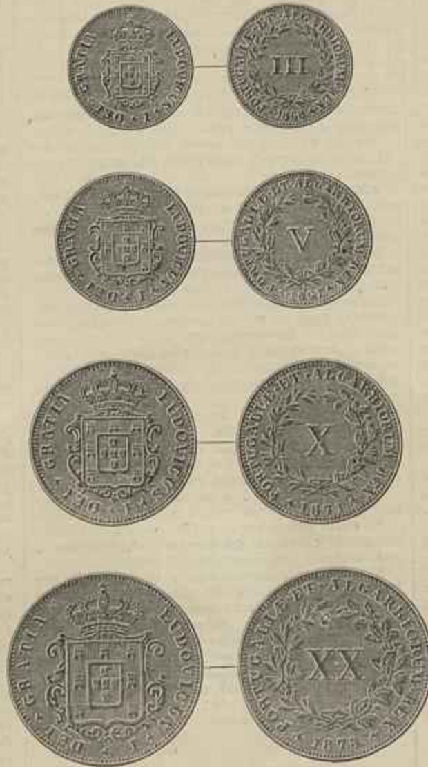
MOEDAS DE COBRE, DO REINADO DE EL-REI D. LUIZ I, QUE RETIRAM DA CIRCULAÇÃO

Tudo quanto possa interessar respeitante ao Bussaco tudo se encontra nas 252 paginas d'este livro illustrado com gravuras e que apenas custa 500 reis.