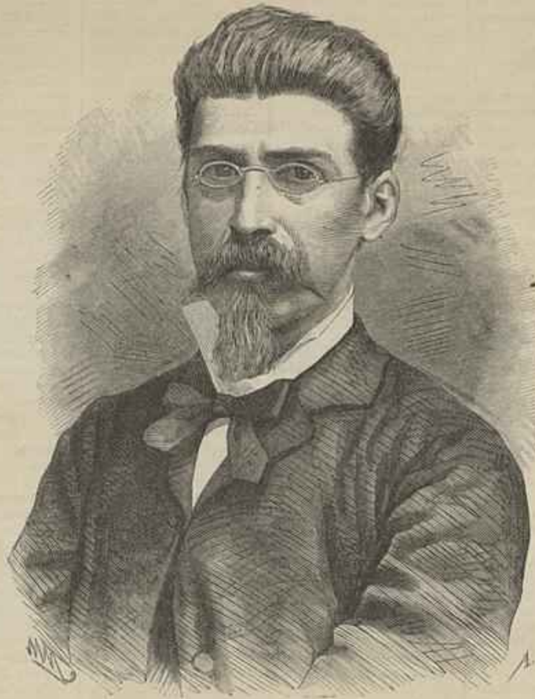
J. BARBOSA RODRIGUES, BOTANICO BRAZILEIRO