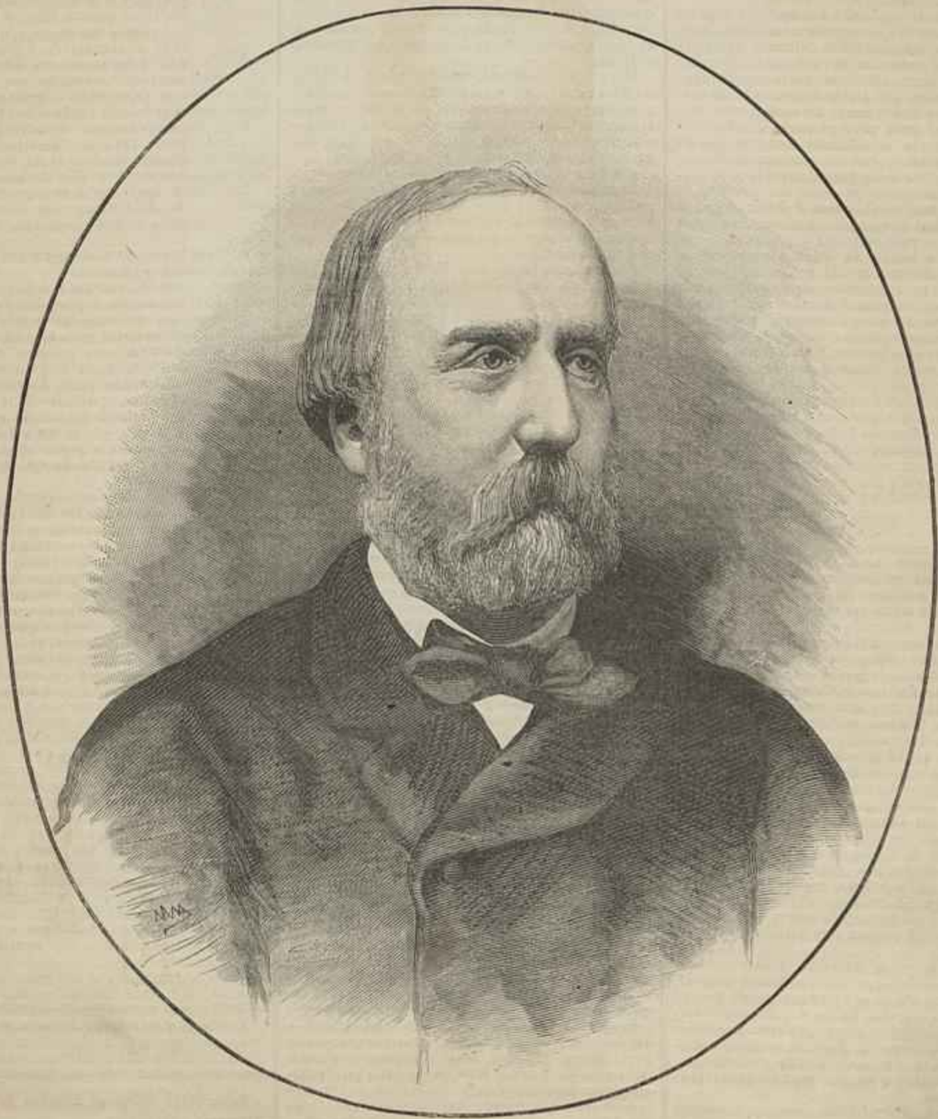
CONDE DE CHAMBRORD — Fallecido a 24 de agosto de 1883 — (Segundo uma photographia de Ernesto Pfanz)