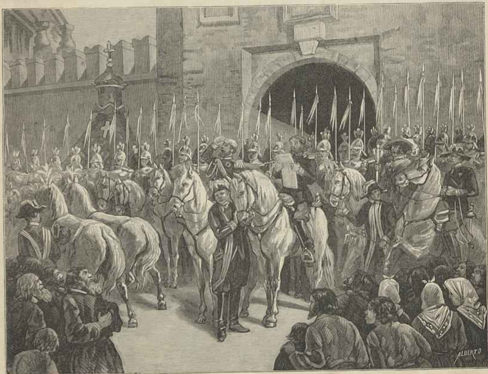
LEITURA DA PROCLAMAÇÃO DO CZAR AO POVO, DIANTE DAS PORTAS DO KREMLIN

sas de quartzo, de silica, de talco, e de argilla, tudo em desordem, offerecendo aos amadores de geologia, elementos de estudo importantissimos.