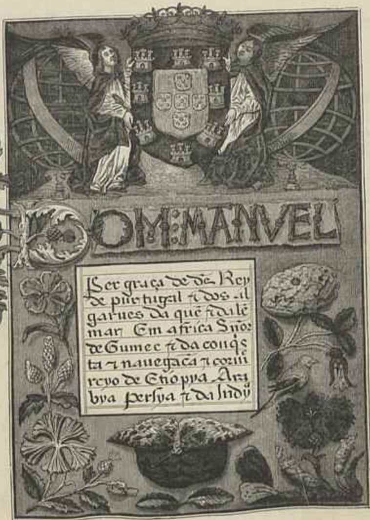
PRINCIPIO DO FORAL DE EL-REI D. MANUEL

Gravura extrahida do livro Monumentos e Lendas de Santarem — Edição de David Corazzi