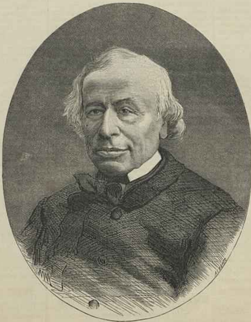
EDUARDO LABOULAYE — Fallecido em 25 de maio de 1883

Isto não se comprehende, diz Salustio com a voz e attitude magestática do tribuno.