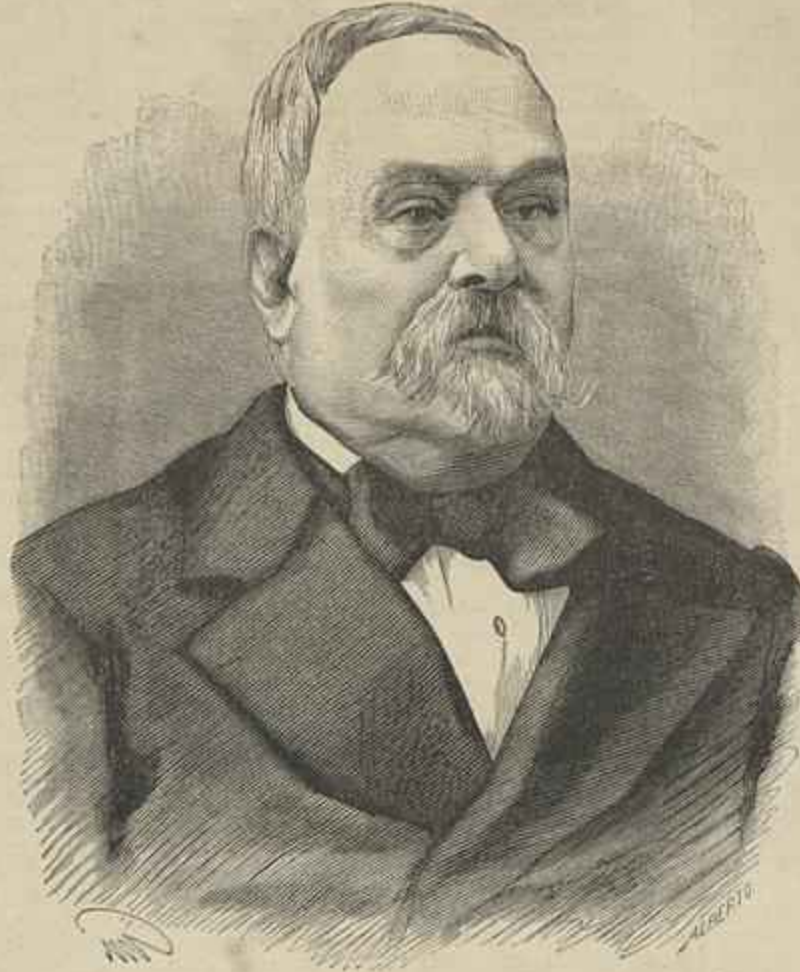
O GENERAL ANTONIO L'AZEVEDO E CUNHA — Fallecido em 26 de maio de 1833

Os miguelistas tinham concentrado toda a defesa n'aquella ponte, e no vau que offerece o Tamega no sitio do Paul. O valente engenheiro marchou com a columna que assaltou a dupla barricada construida na ponte. Acompanhado por alguns soldados de sapadores, foi visto proceder com o maior