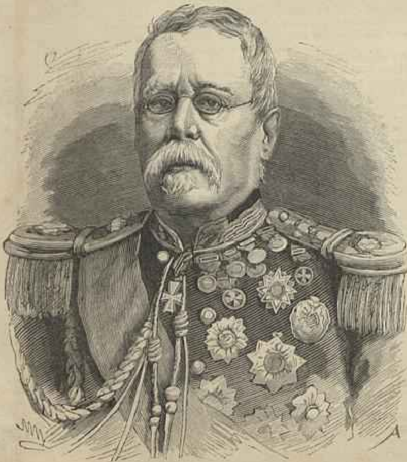
O GENERAL D. ANTONIO JOSÉ DE MELLO — Fallecido em 21 de maio de 1833

Azevedo e Cunha foi promovido a 1.º tenente de engenharia em