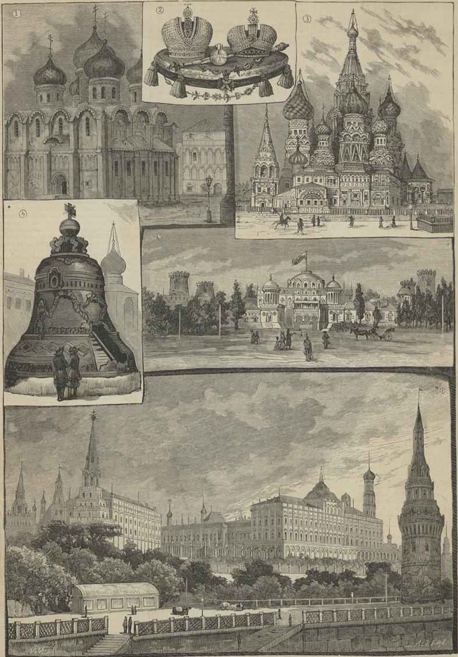
COROAÇÃO DO CZAR EM MOSCOW — 1, CATHEDRAL DE USPENSKI — 2, INSIGNIAS IMPERIAES — 3, IGREJA DE S. 1 WASSILI 4, O BINO GRANDE DE KREMLIN — 5, PALACIO IMPERIAL NO PARQUE DE PETROUZEI — 6, O KREMLIN EM MOSCOW (Desenhos de M. de Macedo)