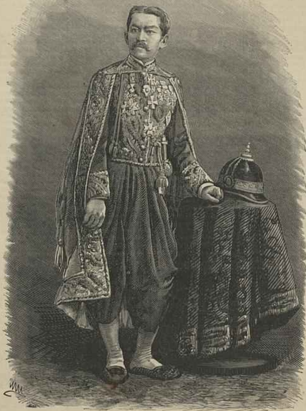
O PRINCE PRISDANG, EMBAIXADOR DO REINO DE SIÃO

Gervasio Lobato já era conhecido e apreciado n'aquella capital, por algumas das suas produc-