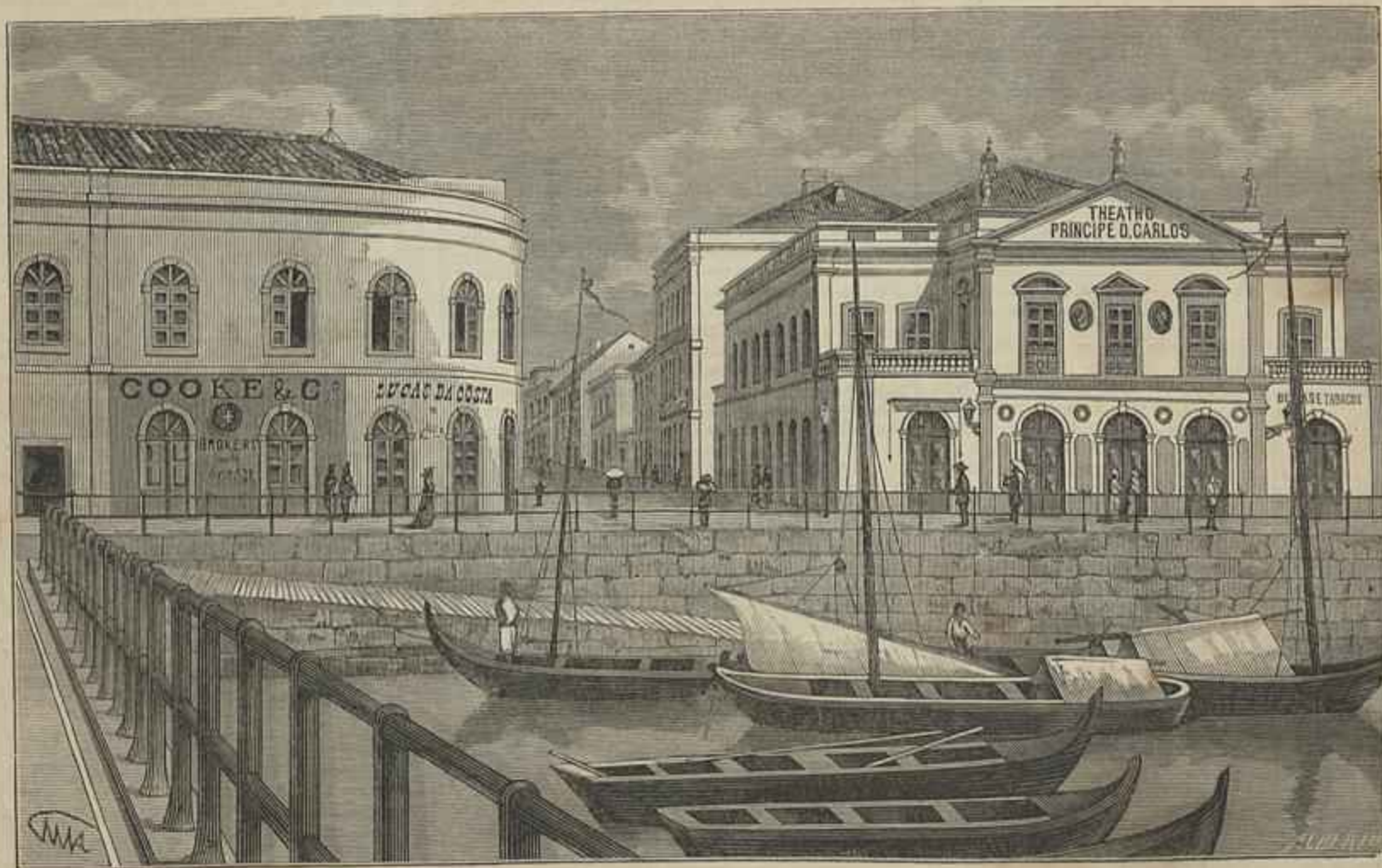
FIGUEIRA DA FOZ — THEATRO DO PRINCIPE D. CARLOS (Segundo uma photographia de Ubaldo)

Desde 1820 até á vinda de Emilio Doux para Portugal, continuaram os nossos theatros dando espectaculos todos modelados, mais ou menos pelos que deixamos descriptos nos artigos precedentes. O modo de representar dos actores portuguezes d'aquella epocha, por via de regra exagerado, condunava-se com a indole das peças interpretadas, e assimilava-se de certo ao que a escola de declamação hespanhola ainda hoje pratica, especialmente pela melopea da recitação.