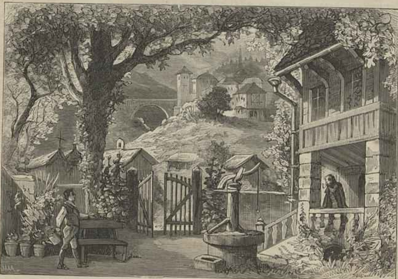
THEATRO DA TRINDADE — SUSANA — Opera de Alfredo Keil, scenario de E. Machado

Estas peças provocaram de certo nos seus avós o enthusiasmo que nunca deixa