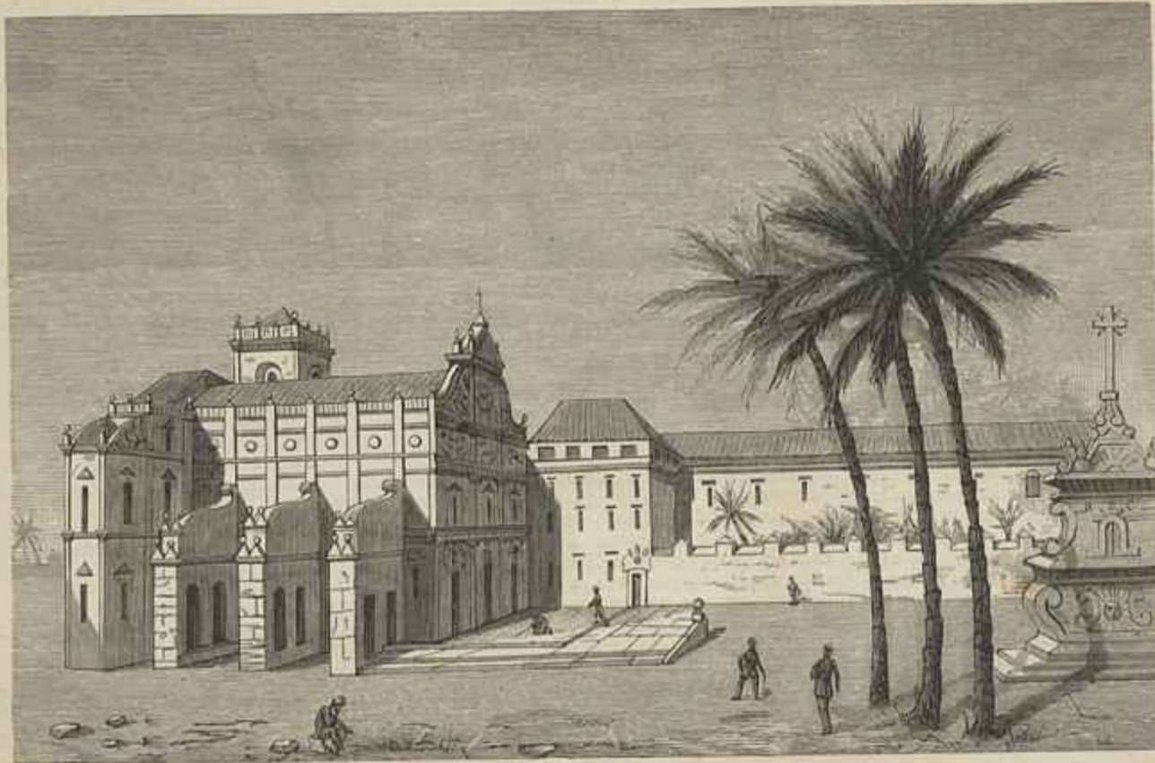
INDIA PORTUGUEZA — CONVENTO E EGREJA DO BOM JESUS, EM GÓA (Segundo um desenho de Lopes Mendes)

1883, LALLEMANT FRÈRES, TYP. LISBOA 6, Rua do Theouro Velho, 6