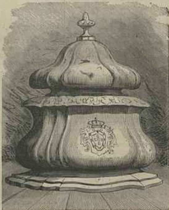
TINTIeiro DO SÉCULO PASSADO PERTENCENTE Á REAL ACADEMIA DE BELLAS ARTES

como tal foi uma das recompensas dadas a Vasco da Gama pelo seu grande feito, a muitos individuos que nunca o tiveram, e até o ajunta ás vezes ao appellido; quando deve ir sempre junto ao nome proprio; algumas vezes os nomes estão um pouco alterados. Entre os nomes dos homens mais celebres que habitaram Paris, vemos ommittidos os de Filinto Elysio, Garrett, Barreto Feio, marechal Saldanha, quando o primeiro n'ella residiu cerca de quarenta annos, escrevendo alli a maior parte das suas obras, ensinando francez a homens importantes, entre os quaes Lamartine, que lhe dedicou uma das suas bellas meditações, Garrett que alli escreveu o Camões , a mais bella joia da literatura portugueza depois dos Lusiadas , o general Saldanha, depois marechal e duque, tão estimado de Lafayette, e que representou papel importante no movimento liberal de julho de 1830, etc.