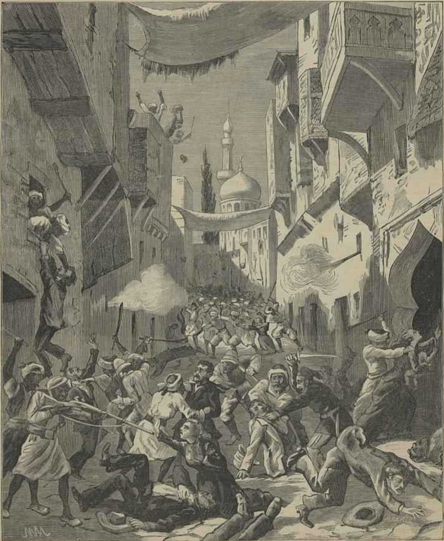
SUCCESSOS DO EGYPTO — ALEXANDRIA — MATAÇA NA RUA DAS IRMÃS EM 11 DE JUNHO DE 1882.

Entre os dramas que se representaram com musica no theatro da Rua dos Condes , e que a Bibliotheca Nacional de Lisboa possui, ha um