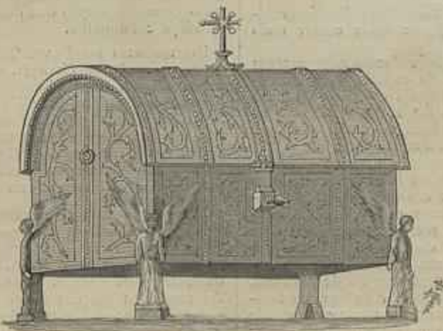
COPRE DE PRATA DOURADA PERTENCENTE Á REAL ACADEMIA DE BELLAS ARTES