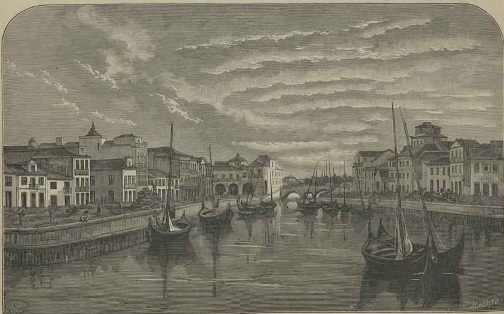
AVEIRO — RUA DO CAES E DA ALFANDEGA NA RIA (segundo uma photographia)

«Primó, pelo logar em que está situado este theatro e por ter a largueza que é bem manifesta. Secundó, por ser um theatro com todas as commodidades precisas para este trabalho. Tertió, por terem largueza os corredores que dão serventia aos camarotes, para não acontecerem as desordens que de ordinario succedem