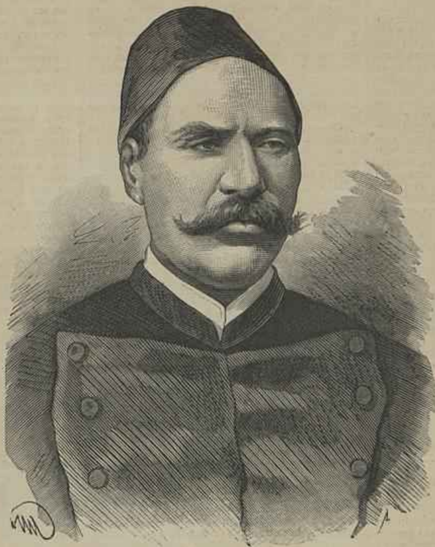
SUCCESSOS DO EGYPTO — ARABI-PACHÁ

mente o motivo que determinou a exiguidade das dimensões de algumas partes do edificio.