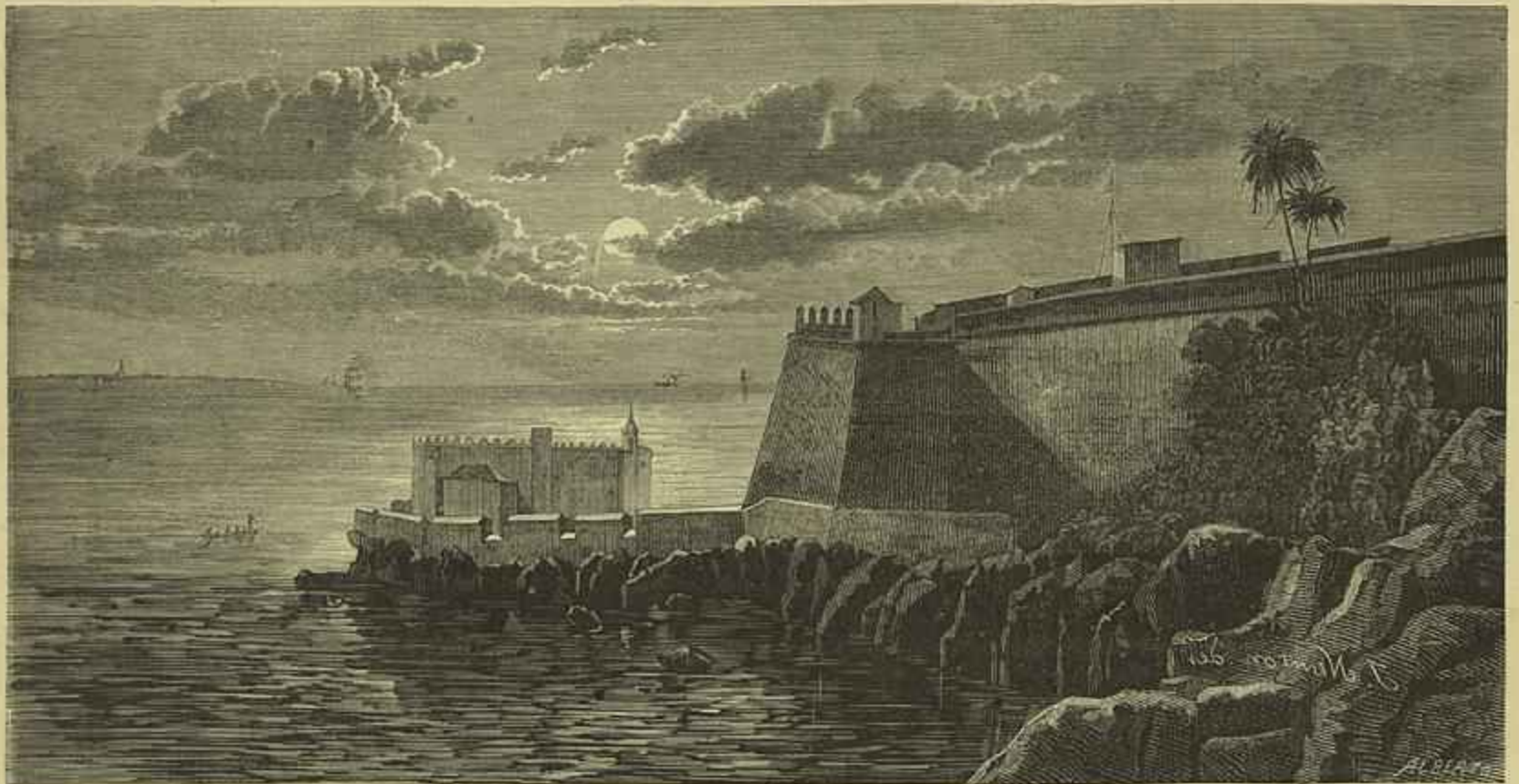
AFRICA PORTUGUEZA — A FORTALEZA DE S. SEBASTIÃO EM MOÇAMBIQUE (Desenho do natural por Isalas Newton)

O plano primitivo era illuminar o salão por meio de serpentinas, a gaz, postas ao centro das columnas da galeria, para o que já se havia feito a necessaria canalisação. O sr. Soller entenden porém que o calor das luzes, assim collocadas prejudicaria o dourado dos ornatos e supprimi-os, illu-