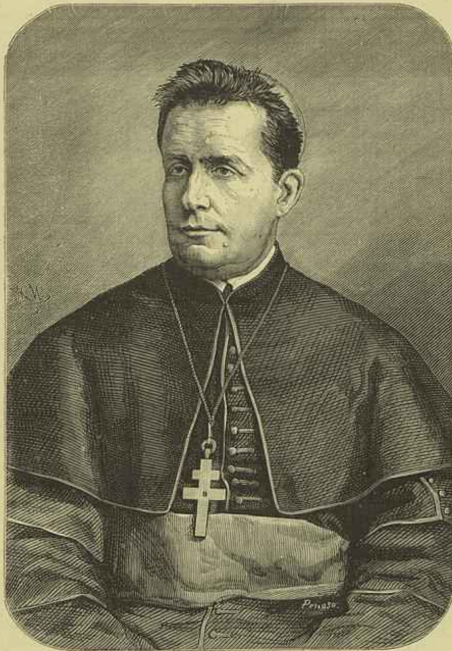
D. AYRES DE ORNELLAS E VASCONCELLOS Arcebispo de Goa Primaz do Oriente, fallecido em 23 de novembro de 1880 (Segundo uma photographia de Camacho)

Ora sendo o arco a feição que melhor assignala um estylo de architectura, e tendo-se querido dar ao salão a forma arabe, é imper-