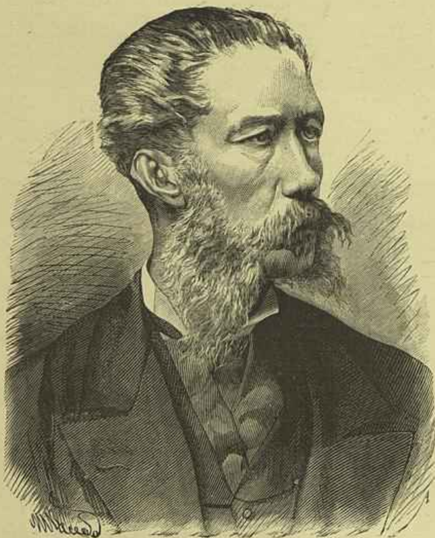
ERNESTO BIESTER — Fallecido em 12 de Dezembro de 1880 (Segundo uma photographia de Pilon)

O outro começou a celebrar as praticas religiosas que lhe eram permittidas e em breve a Misericordia da, então villa, sabendo que os dois religiosos eram portadores de grande quantidade de reliquias santas, lhe acudiram com o necessario e instaram com elles para que as manifestassem ao publico.