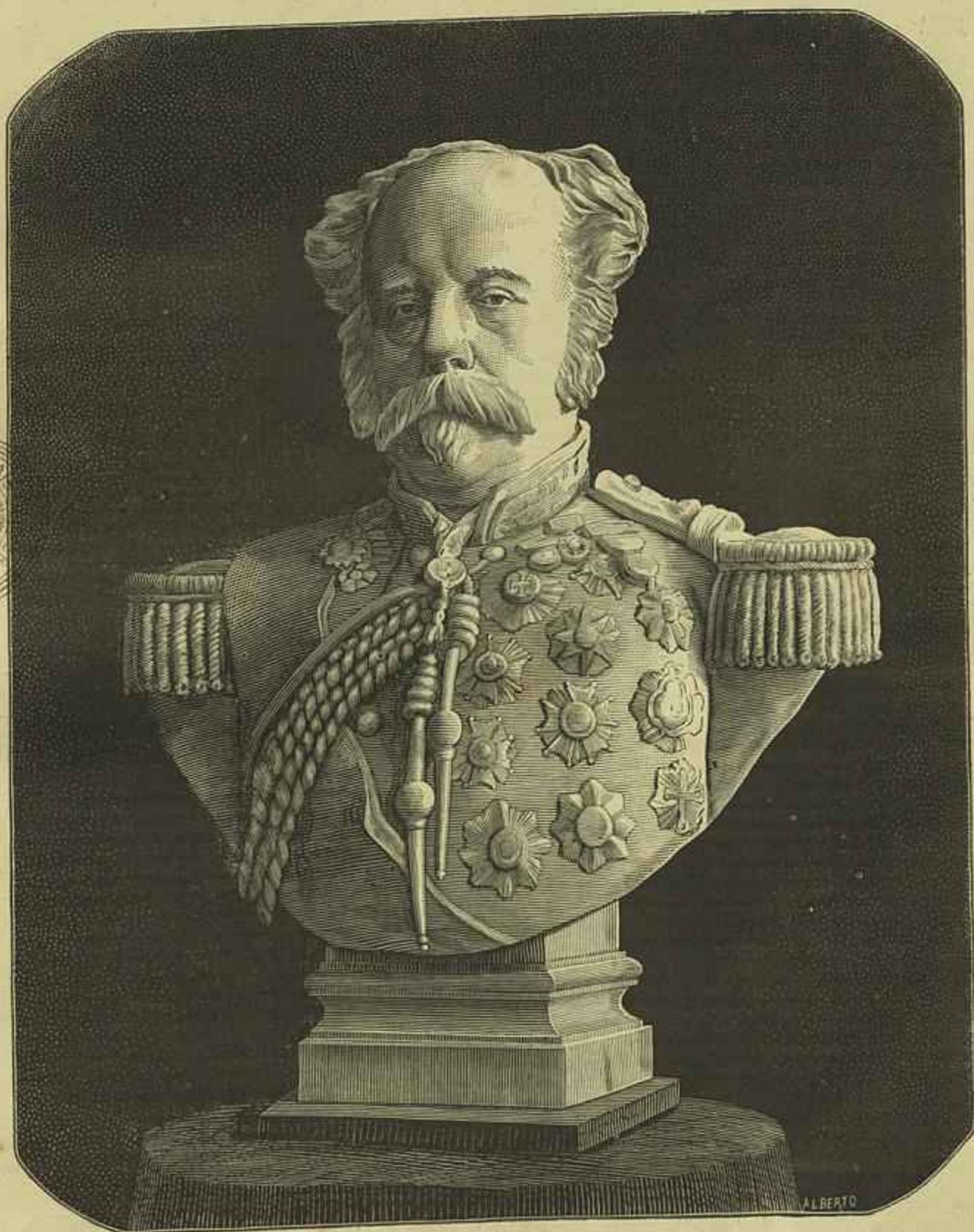
MARECHAL DUQUE DE SALDANHA — Busto em mármore, escultura por Alberto Nunes, executado para a Câmara das Póvoas