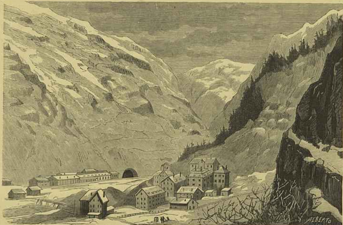
O TUNEL DE S. GOTHARDO, ABERTURA EM GOSCHENEN, NA SUISSA