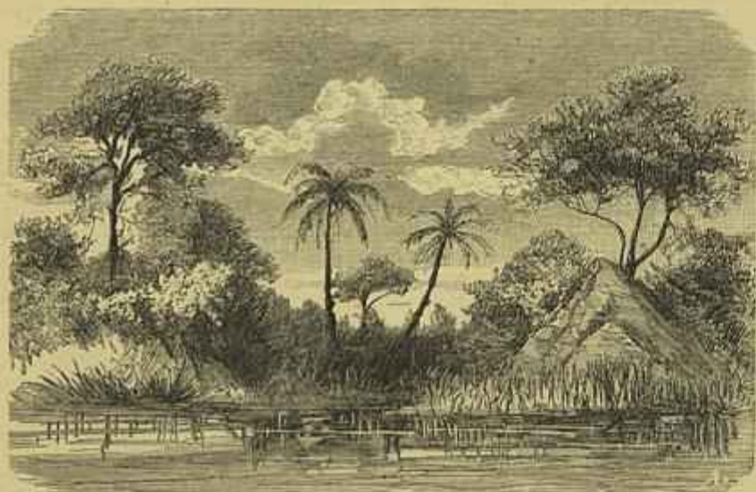
XINZALLA — Vista do S. O.