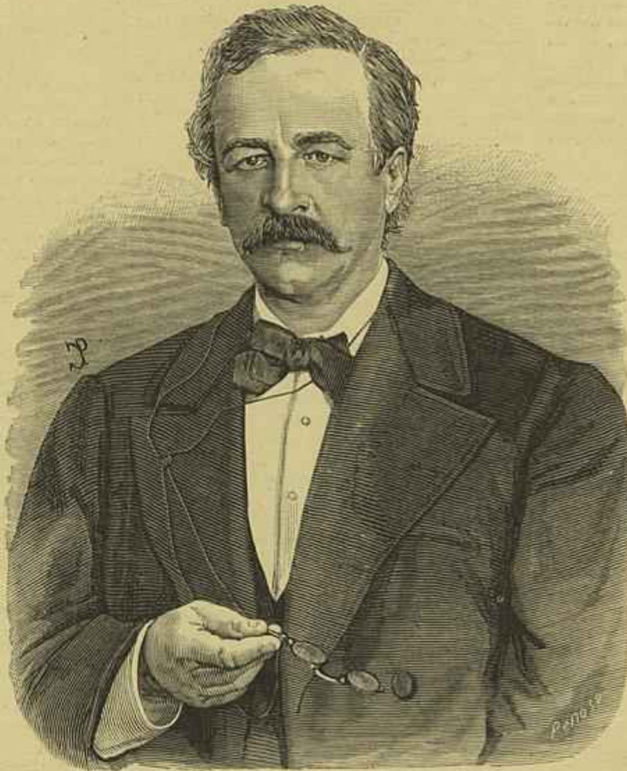
A. E. NORDENSKIÖLD, EXPLORADOR DOS MARES GLACIAES. (Segundo uma photographia tirada ultimamente em Napoles)

N'uma das grandes estações feitas ao norte