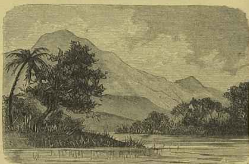
XINHIME — Ponta do O.