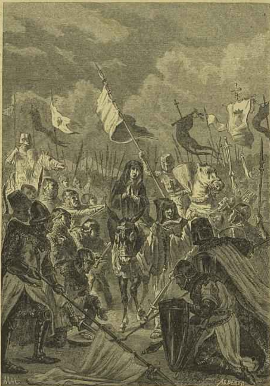
A RAINHA D. ISABEL, PENETRANDO POR ENTRE AS HOSTES DO REI E DO INFANTE, EVITA A BATALHA DO CAMPO DE ALVALADE

Gravura extrahida do 2.º volume da Historia de Portugal, edição da Empresa Litteraria de Lisboa