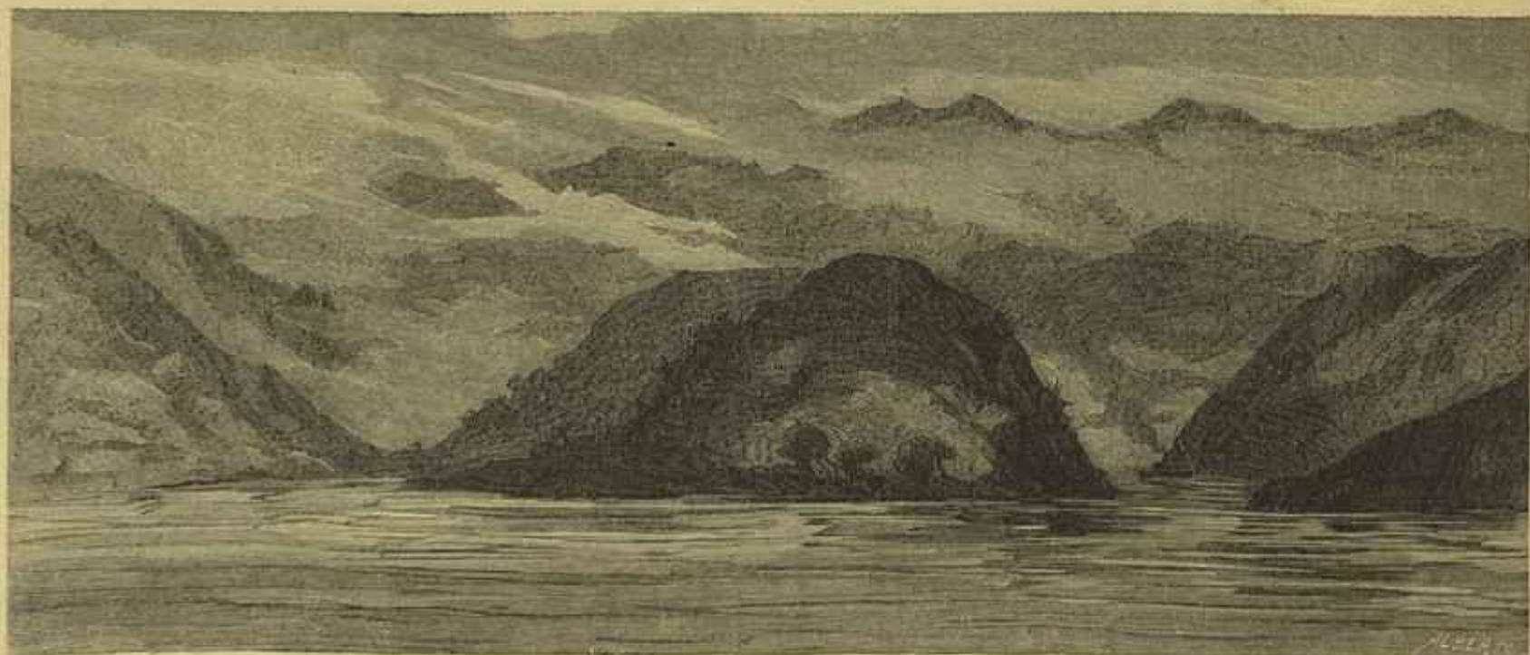
O ZAIRE JUNTO AOS RODOMINHOS DE FUMA-FUMA (Segundo desenhos do explorador Roberto Ivins)